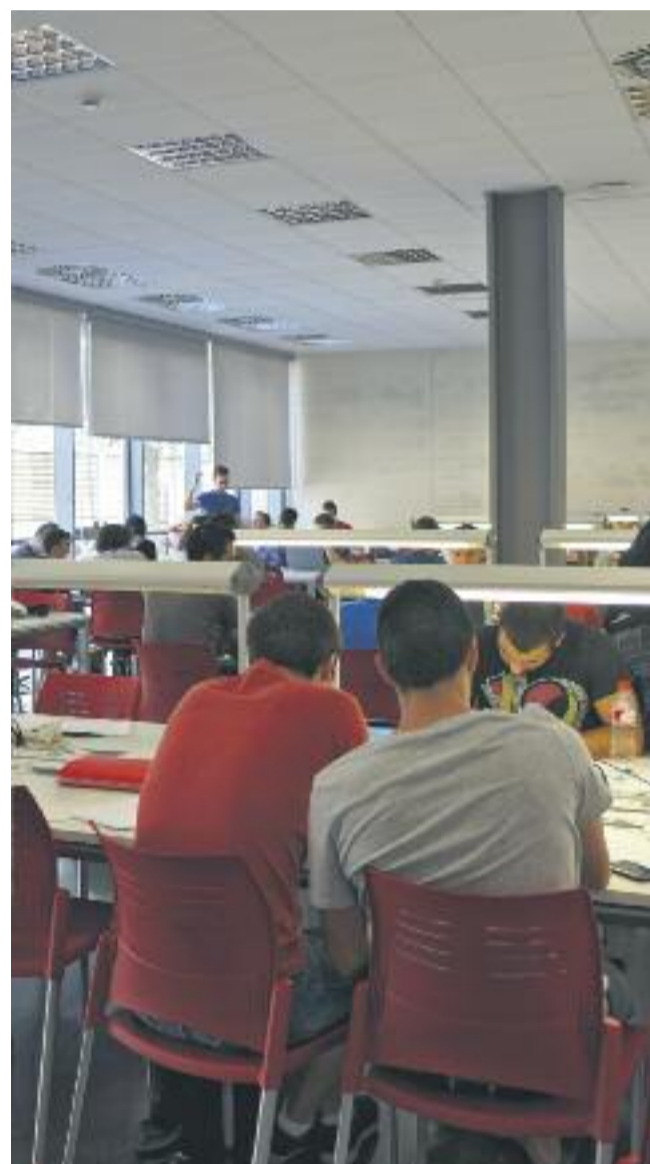
El mapa de les sales habilitades a la ciutat i una imatge de diversos nois estudiant.