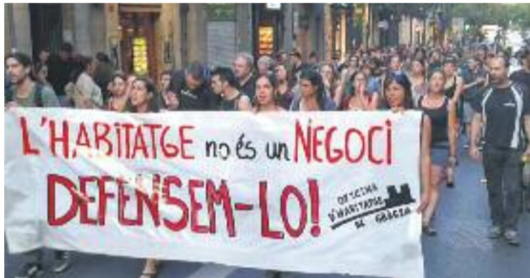
Imatge de la manifestació de protesta.

En el moment del desallotjament, segons van explicar els Mossos d'Esquadra, a l'edifici no hi havia ningú. Posteriorment uns agents d'una empresa de seguretat privada van custodiar l'edifici, que és de propietat privada. Per la seva banda, la pla-