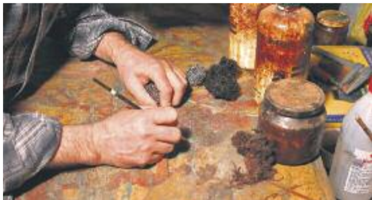
Gràcia és un epicentre de l'artesanía.