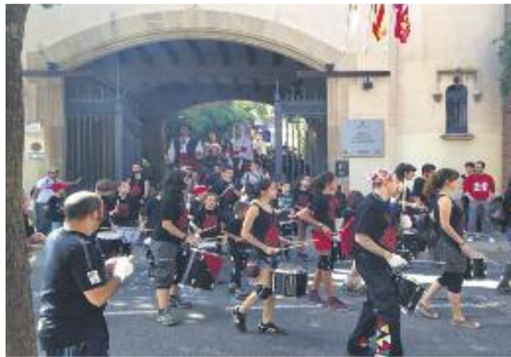
Una imatge de la cercavila de l'any passat.