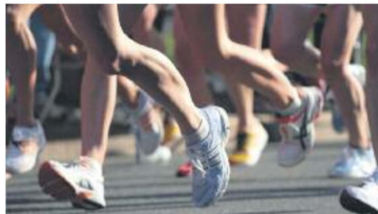
La cursa es fa pels carrers del districte.

ATLETISME ▶ La cita atlètica popular per excel·lència a Gràcia escalfa motors de cara al pròxim diumenge 14 de juny, quan els Castellans de la Vila, conjuntament amb Holmes-Place, l'ACIDH i CorreCATagafo organitzin la Cursa els 10 Blaus.