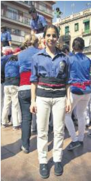
La Roser.