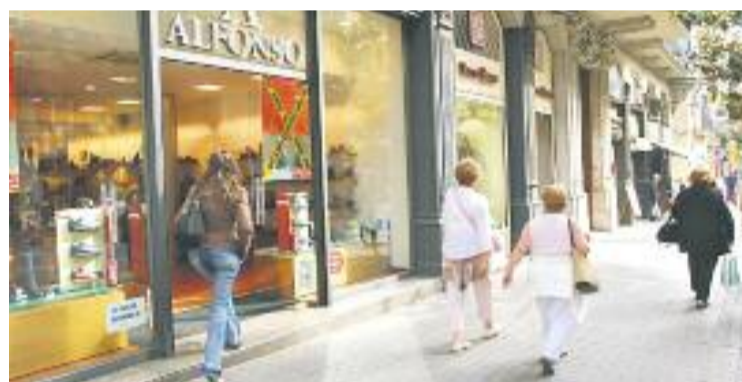
Els municipis han d'escollir dos dies addicionals més als decretats.