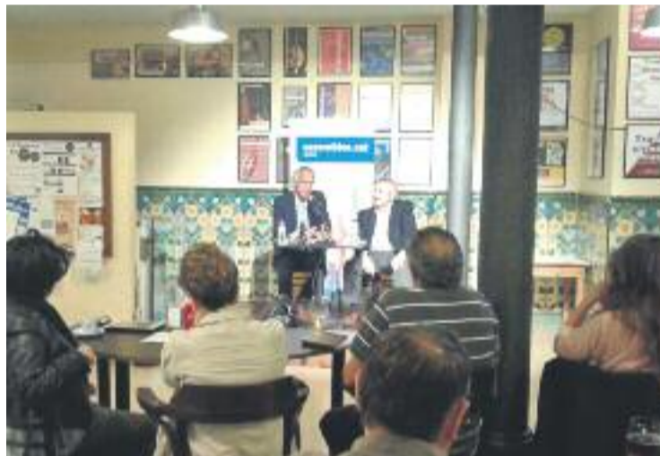
Imatge d'un moment de la xerrada.

El doctor Clotet també va remarcar que s'ha d'avançar cap a un sistema de desgravacions fiscals, com és el cas dels Estats Units, on la llei permet desgravar gairebé el 100% del que es dona.