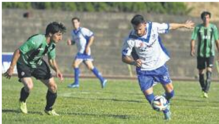
L'Europa no va estar encertat de cara a porteria.

El partit va estar envoltat de polèmica, ja que el primer gol va arribar per un penal molt rigorós assenyalat en contra de l'Europa. Aquest gol va esperonar els locals, que van assetjar la porteria de Rafa Leva fins a la mitja part. A la represa, l'Europa va tornar a agafar el control del joc, tot i el mal estat de la gespa del Manuel Calzado, que va