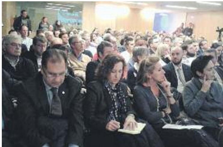
La sala d'actes es va omplir de seguida.