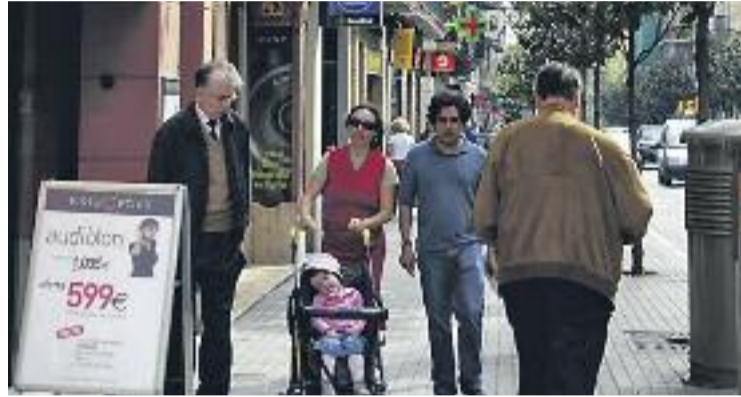
Les rebaixes arribaran a la seva fi la setmana que ve.