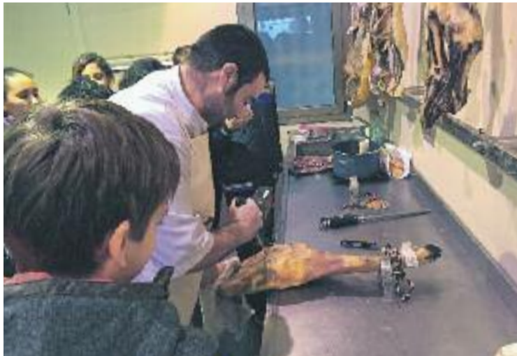
Enguany s'han fet 233 visites a botigues de la ciutat.