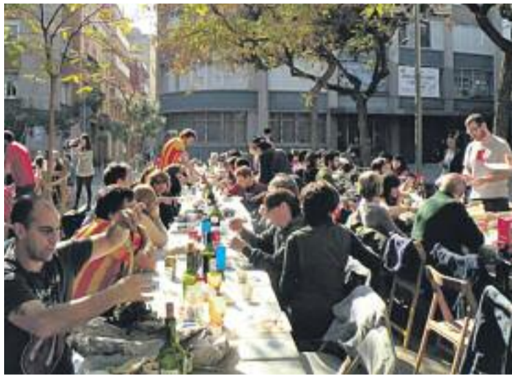
Imatge de la calçotada de la Verdinada de l'any passat.

La primera activitat de la Verdinada serà la celebració de la Magic Line, una prova atlètica promoguda per la Fundació Sant Joan de Déu per sensibilitzar i captar fons per als programes d'atenció a les persones en situació vulnerable que tindrà lloc aquest diumenge. El mateix dia, l'entitat Depana (Lliga per a la Defensa del Patrimoni Natural) ha programat una sortida al Turó de Montcada, un indret molt proper i alhora molt desconegut, per conèixer els seus secrets. Els Lluïsos i Depana seran dues de les seus de la Verdinada,