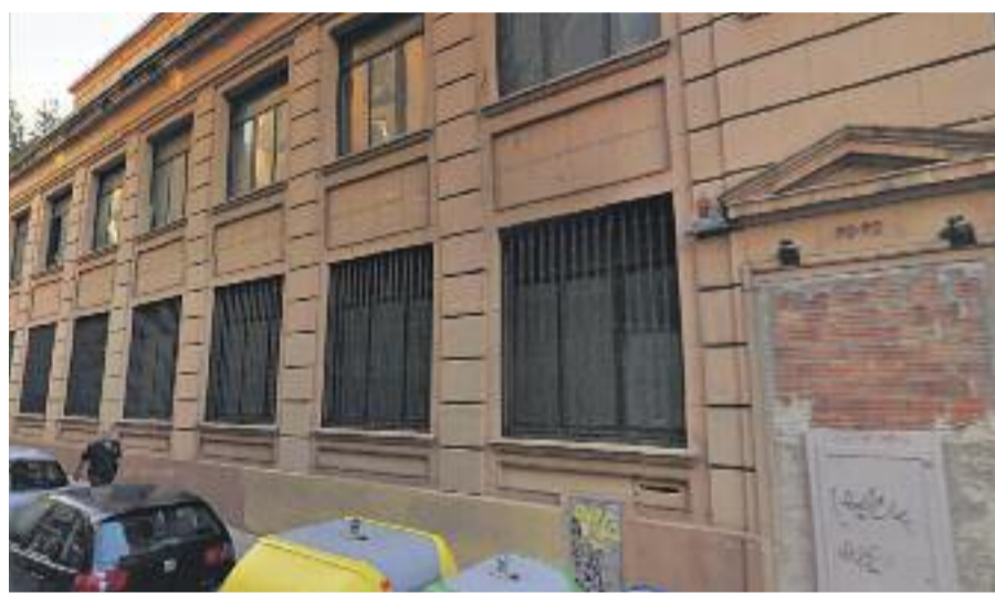
L'edifici que serà la seu del nou Centre de Serveis Socials (a l'esquerra i a baix a la dreta) i les obres del nou equipament de la plaça de la Sedeta (a dalt a la dreta).