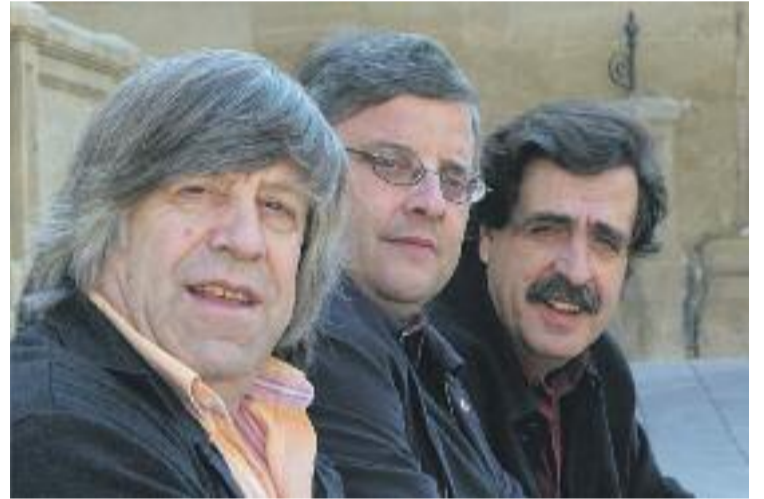
El grup Els Tranquils actuarà als mercats de Gràcia.

Aquest cicle cultural neix de la col·laboració entre l'Institut Municipal de Mercats de Barcelona (IMMB) i el Centre Artesà Tradicionari.