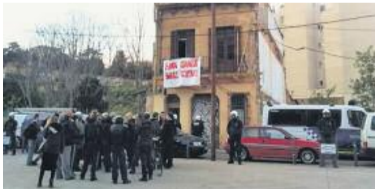
Un moment del desallotjament de la casa.

SOCIETAT ▶ La Guàrdia Urbana va desallotjar aquest dilluns a la tarda una casa del carrer l'Argentera, al barri de Vallcarca, que va ser ocupada dissabte passat.