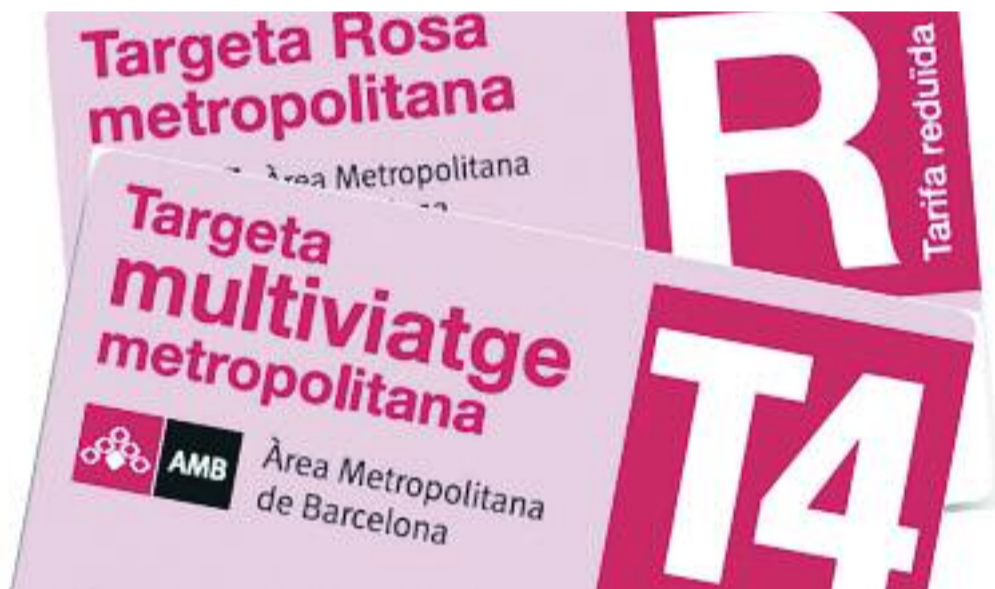
Els transports públics, com el metro, són alguns dels serveis on es veuen beneficiats els usuaris de la Targeta Rosa.