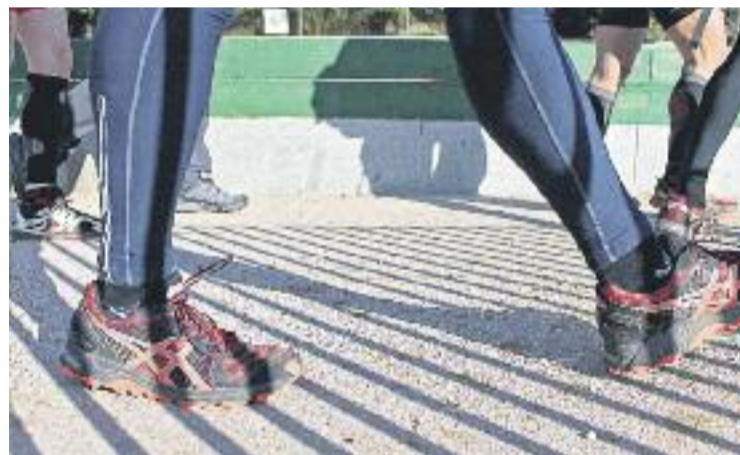
Enguany se celebra la segona edició d'aquesta prova.

CURSA ▶ Ja està tot a punt per a la segona edició de la Barcelona Magic Line, la cursa solidària de muntanya no competitiva que recorrerà 9 turons de la ciutat -cadascun dels quals dedicat a una causa social poc visible- i que pujarà al Turó de la Creueta del Coll, al districte de Gràcia. La carrera tindrà lloc aquest diumenge al matí.