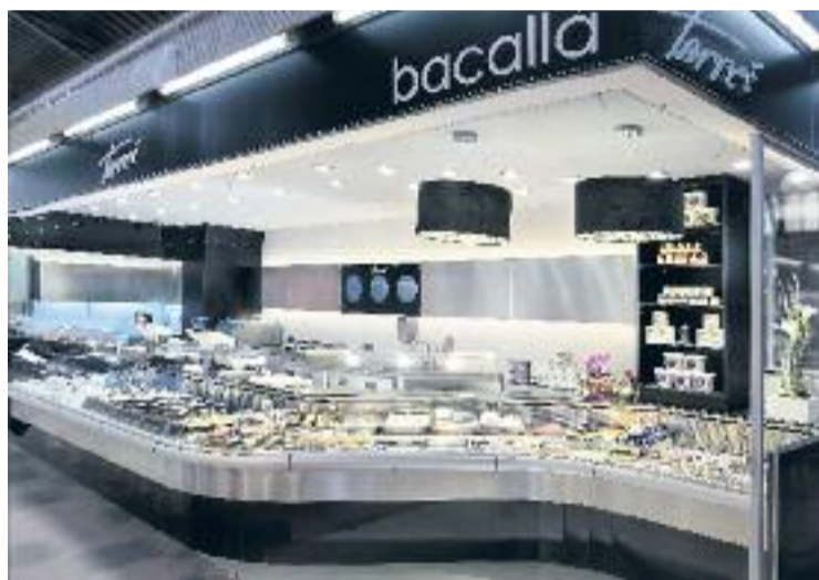
Bacallà Tarrés, al Mercat de la Llibertat, un dels escenaris de la ruta.

Els participants en la ruta, on col·labora Inedit Damm, oferiran menús elaborats a base de bacallà maridats amb cervesa i degustacions d'aquest aliment. A més, també es podrà fer un recorregut per les bacallaneries associades al gremi del sector.