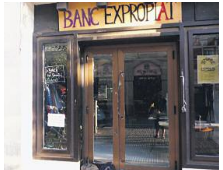
El Banc Expropiat continuarà ocupat pel col·lectiu que el gestiona.

Per acabar, llancen un avís i afirmen que seguiran "resistint les seves amenaces i desobeint les seves lleis gràcies a tota la solidaritat rebuda".