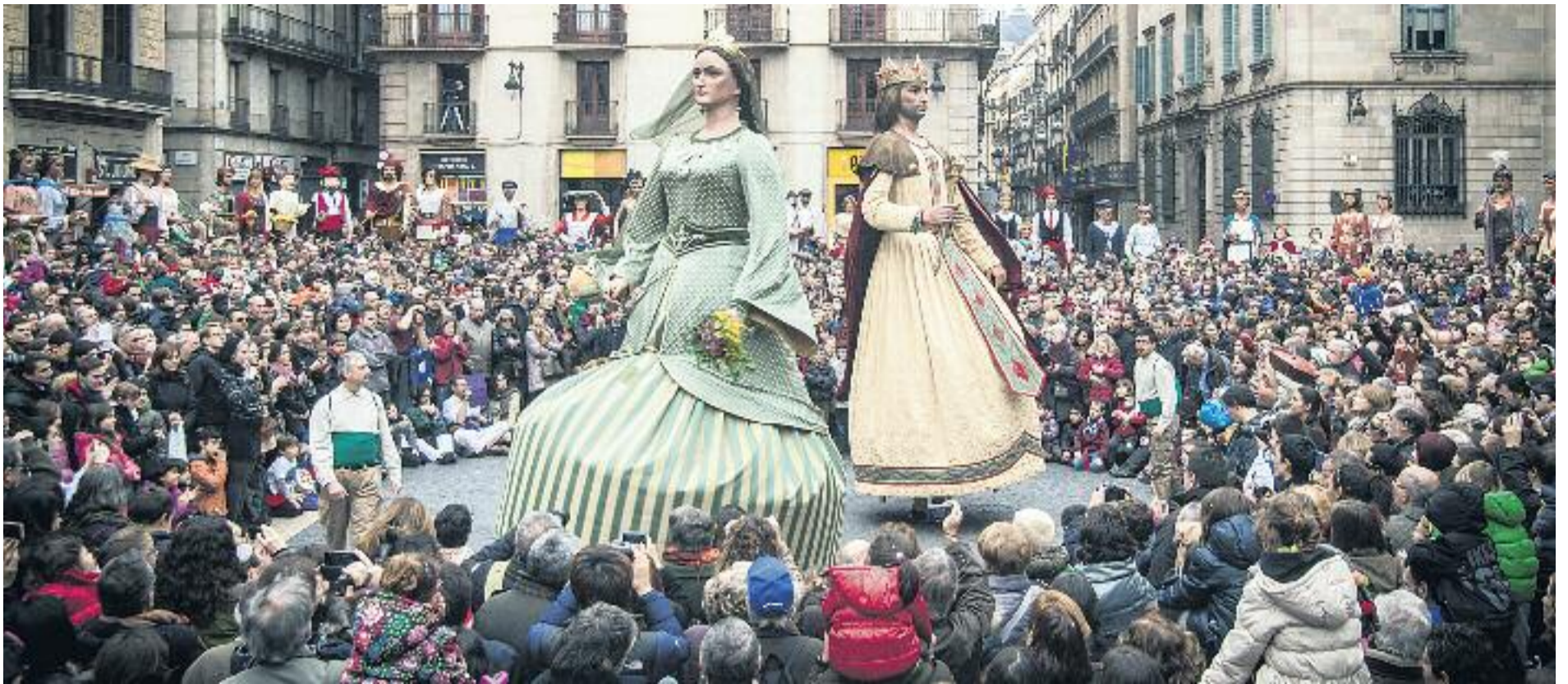
La cultura popular és la protagonista de la festa.