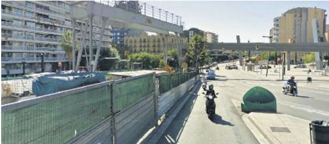
Està previst que les obres de la plaça comencin el març i acabin el setembre.