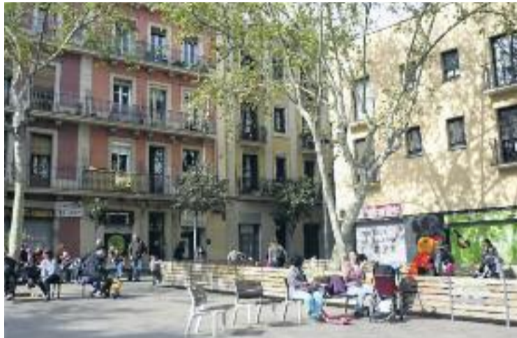
La plaça del Diamant forma part del nucli històric.