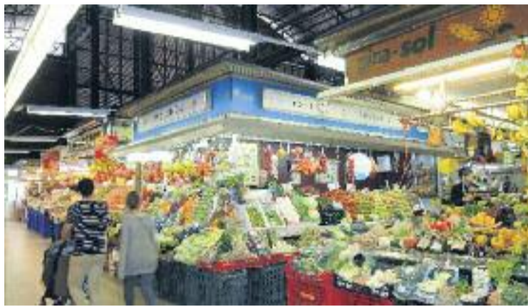
L'Abaceria es posarà el mocador vermell dels 'Sanfermines'.

Pel que fa als mercats del districte, el de la Llibertat i el de l'Abaceria es disfressaran per donar un toc inusual a la seva fisonomia. Els paradistes del Mercat de la Llibertat, per la seva banda, viatjaran al passat i transformaran l'equipament en un mercat de l'antiga Roma a partir d'avui i fins demà. Els botiguers es disfressaran i recrearan l'ambientació d'aquells espais histò-