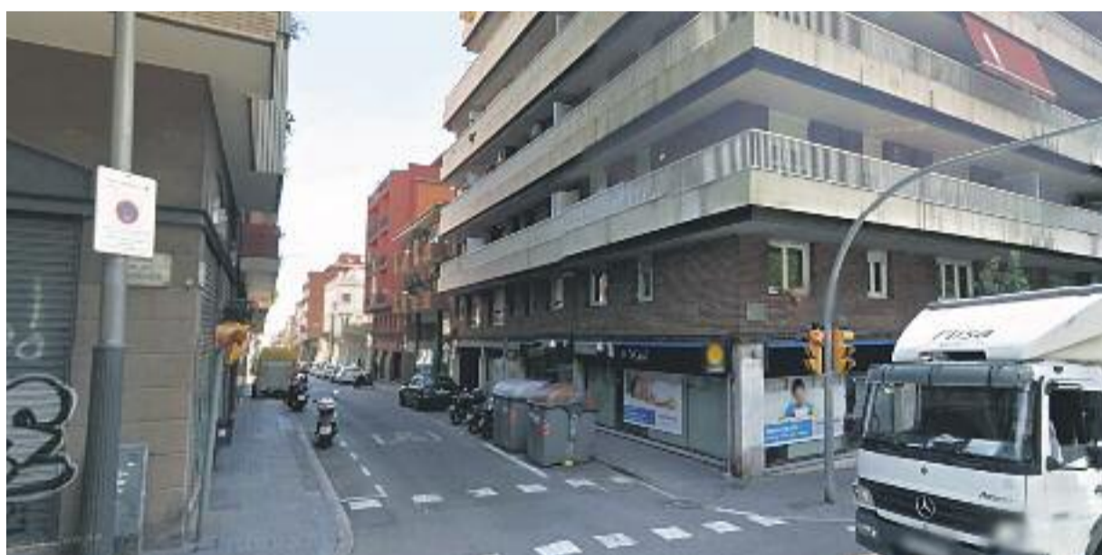
L'origen del carrer Ca l'Alegre de Dalt des de Pi i Margall i la cantonada amb Camèlies (a l'esquerra) i la cruïlla amb el carrer Legalitat (a la dreta).