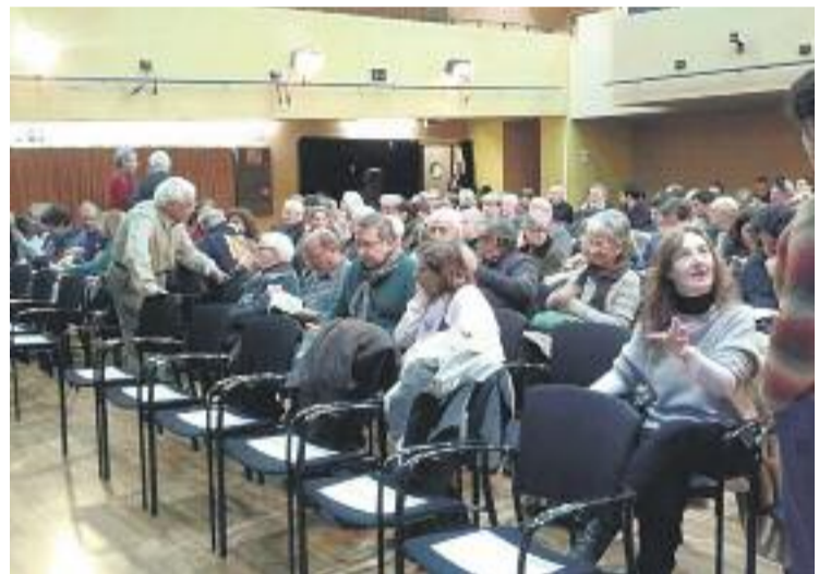
Imatge de la sala, plena, abans de començar l'acte.

Anglada també va tenir l'oportunitat de parlar sobre les eleccions catalanes del pròxim 27 de setembre, de les quals ha assegurat que seria vital poder-ne extreure uns resultats que permetessin presentar a Europa un mandat democràtic. "Europa diu que, si portem el 50% dels vots pel Sí, ens faran cas", va concloure.