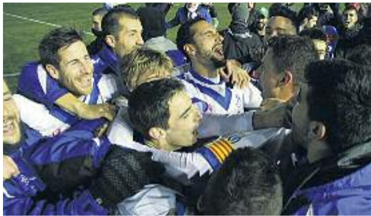
L'Europa jugarà la final de la Copa Catalunya el 25 de març.

Aquesta victòria, a més, s'afegeix a l'assolida el passat 4 de febrer al Nou Sardanya davant del Sabadell (3-0) a les semifinals de la Copa Catalunya, en una nit màgica que serà recordada per l'afició gracienc durant molts anys. D'aquesta manera, els escapulats disputaran la final de la competició catalana el pròxim 25 de març contra