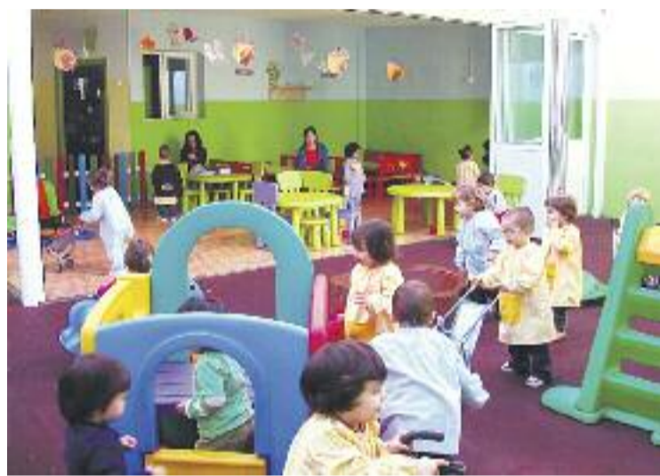
Dos moments de la visita institucional a la futura escola bressol municipal Escorial i una imatge d'una escola bressol en funcionament.