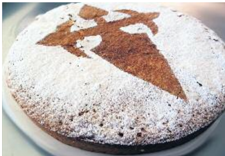
El pastís de Santiago, a l'avituallament de Sant Medir.