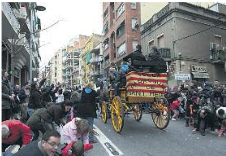
Sant Medir tornarà a omplir els carrers de Gràcia.