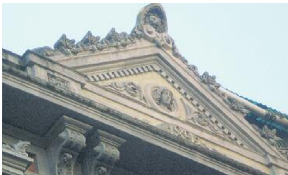
Tres detalls de l'edifici: un dels diables que corona les portes (a l'esquerra), la façana de l'edifici (a dalt a la dreta) i la part superior de la façana (a baix a la dreta).