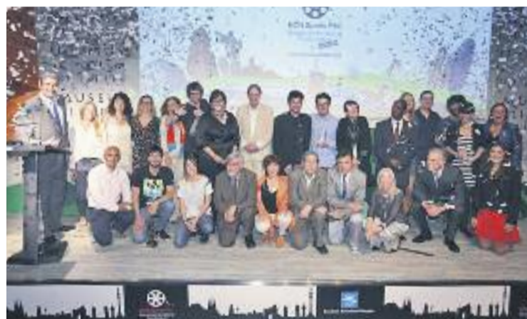
Foto de família dels guardonats de l'any passat.

FESTIVAL ▶ La sisena edició del BCN Sports Film ja comença a caminar. El període per presentar la candidatura per participar en aquest festival de cinema esportiu ja està obert, i seguirà així fins al pròxim 28 de febrer.