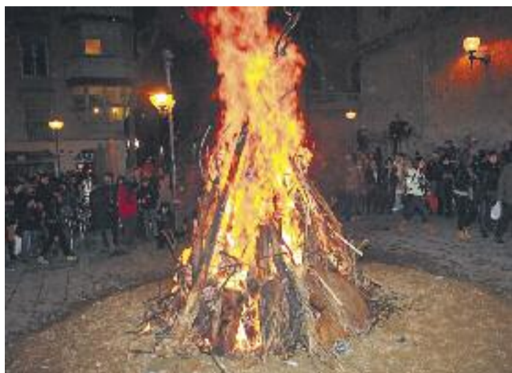
El foc és el gran protagonista d'aquesta festa mallorquina.