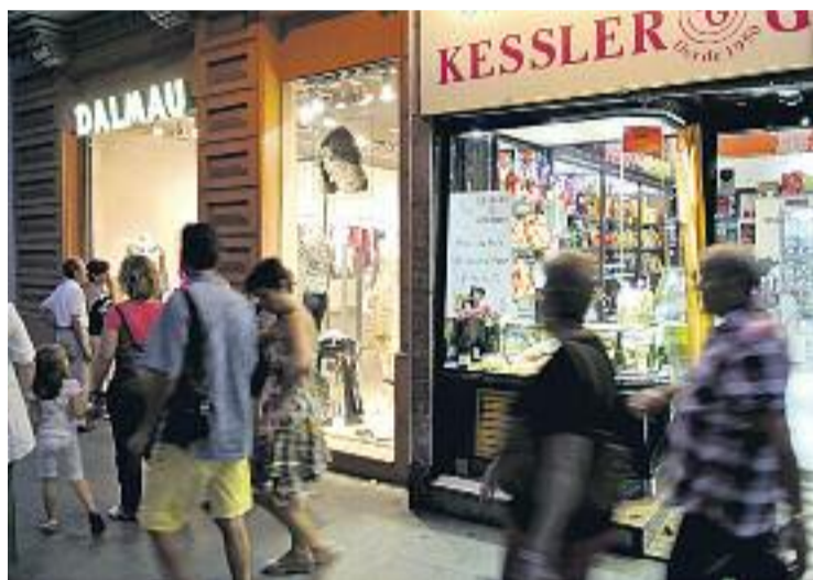
L'augment de vendes es produeix després de 7 anys de caigudes.

Respecte al desembre, l'epicentre de la campanya de Nadal, l'INE indica que el creixement de les vendes va ser del 7,4% a Catalunya, una dada que ha col·laborat a millorar la mitjana de 2014. Pel que fa a l'ocupació, el petit comerç va incrementar el percentatge de contractats en un 0,7% durant l'any passat, una xifra que torna a ser superior a l'estatal —que es queda al 0,1%—.