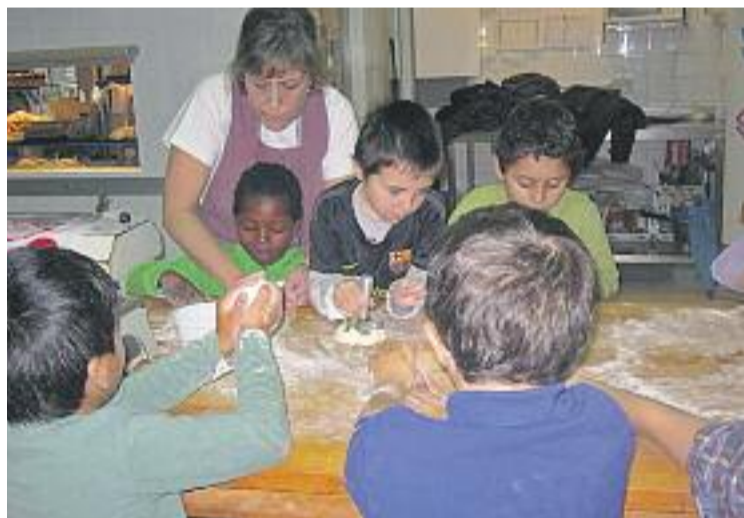
El programa inclou tallers pràctics sobre diferents oficis.