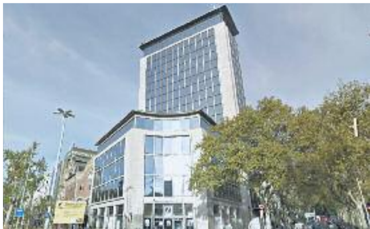
A la Torre Deutsche Bank hi ha projectat un hotel de luxe.

Aquesta nova polèmica afecta de ple el procés participatiu sobre el nou Pla d'usos que estan duent a terme de forma conjunta el Districte i 'Gràcia cap a on vas?', el qual es troba en la recta final i que, fins ara, s'havia desenvolupat en un clima d'entesa. La plataforma, en un comunicat emès abans de la jornada de protesta de dilluns, va acusar el consistori de "manca de transparència i deslleialtat envers el veïnat" i de no haver dit res "dels nous projectes hotelers durant les reunions del procés participatiu, tot i que la controvertida qüestió ha estat al centre del debat en repetides ocasions".