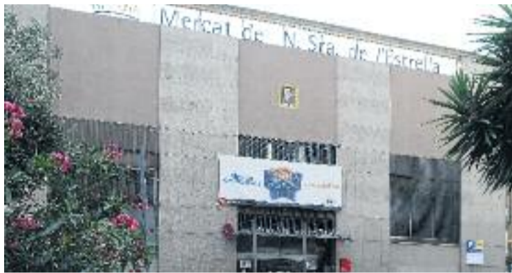
L'Estrella va iniciar el cicle el passat 17 de gener.

Durant més d'un mes, els quatre mercats de Gràcia acullen diferents actuacions de grups de folk. El primer concert va tenir lloc el passat 17 de gener durant el matí a l'Estrella i la Llibertat, de la mà de La Romàntica del Saladar, actuació que va donar el tret de sortida al cicle. Aquell dia, els compradors i venedors d'aquestes dues instal·lacions van poder gaudir d'aquest grup valencià que rescata el sabor popular de les bandes de poble, i que al vespre d'aquell ma-