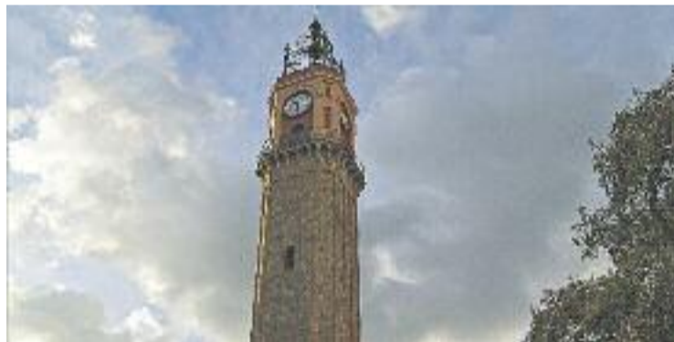
La Torre del Relloige, protagonista de l'obra.

CULTURA ▶ La novel·la 'El rellotger de Gràcia', escrita per Joan Lafarga després de la mort de l'antic conseller de la Vila Albert Mussons, farà el salt al teatre en el marc de la celebració del 150è aniversari de la inauguració del Campanar de Gràcia.