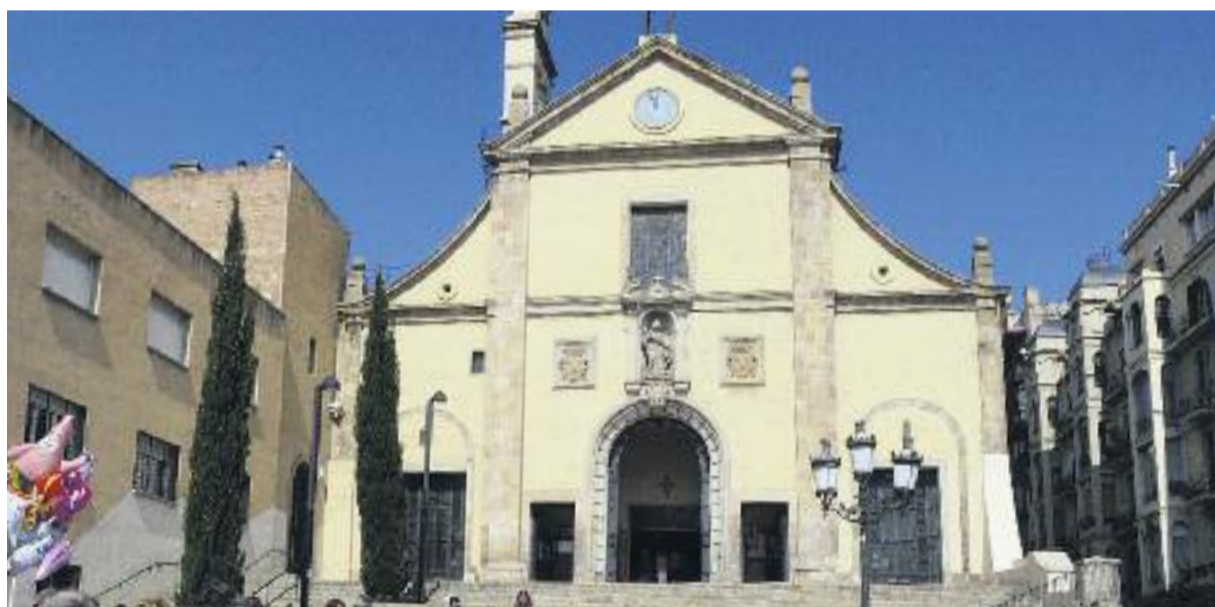
Tres dels edificis més atractius: la façana de la la Casa Comas d'Argemir (a dalt a l'esquerra), l'església dels Josepets (a baix a l'esquerra) i la Casa Rosa Alemany (a la dreta).