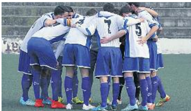
L'Europa es conjurarà per accedir a la final del torneig.

En aquesta competició, escapulats i arlequinats només s'han creuat en una ocasió. Va ser el 8 de maig de 1997, i en aquell partit l'Europa va vèncer per 0 gols a 1 al Sabadell. Finalment, aquell any els graciencs es convertirien en campions de la competició al derrotar a la final el FC Barcelona per 3 gols a 1. L'any següent, el 1998, l'Europa va revalidar el títol de campió de