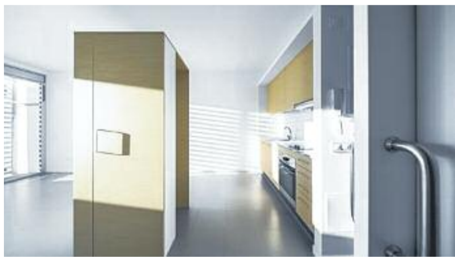
El solar on es construirà l'edifici (a l'esquerra), un moment de l'acte de presentació (a dalt a la dreta) i una projecció de l'interior dels pisos.