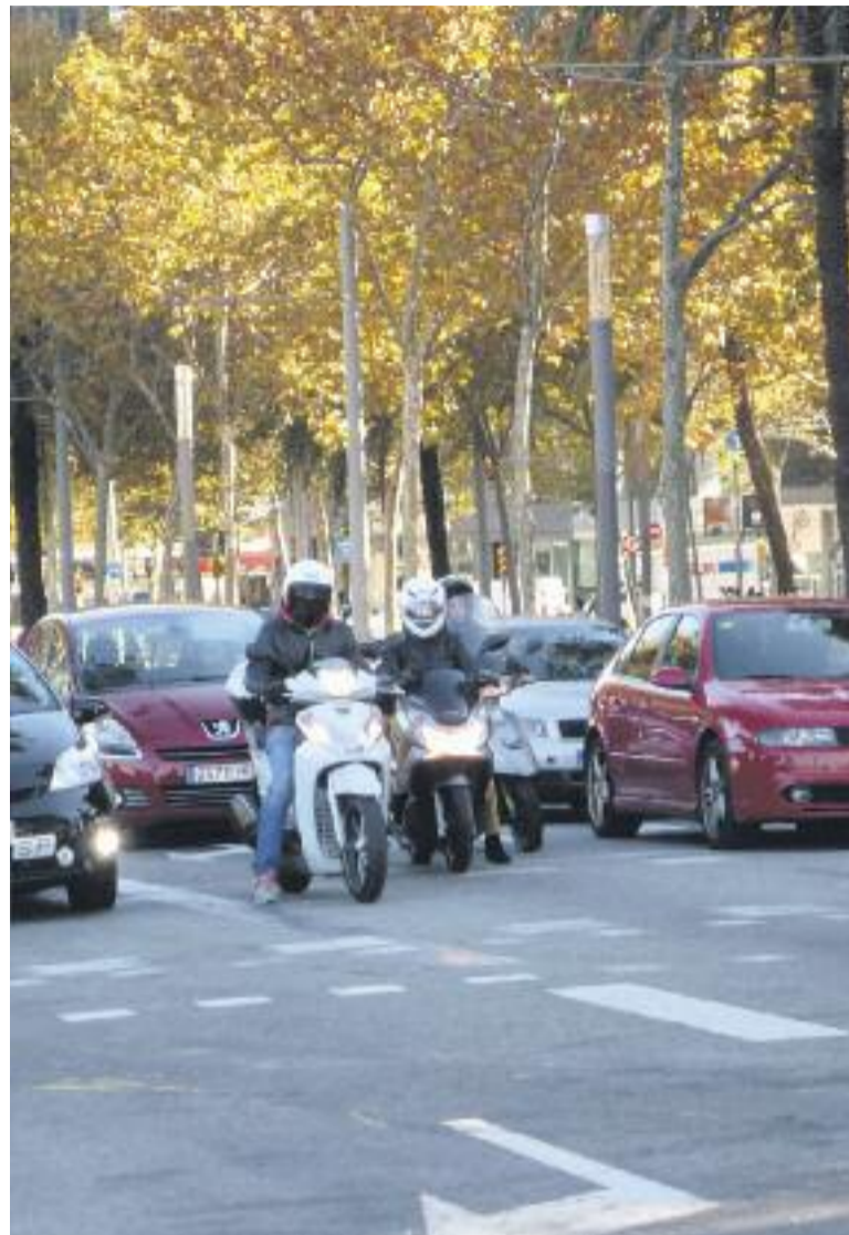
Les motos són un mitjà de transport molt utilitzat pels barcelonins.