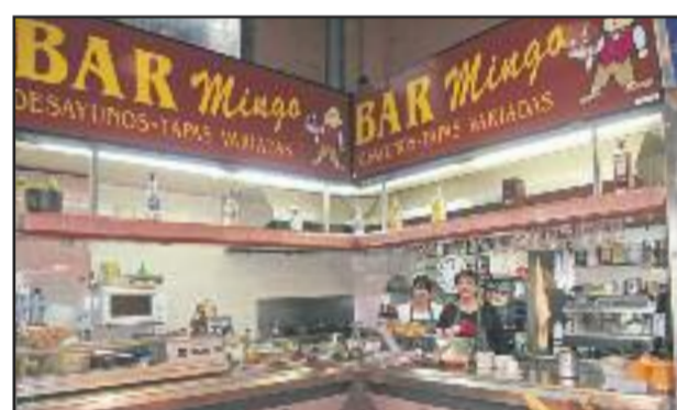
BAR MINGO EL RACONET