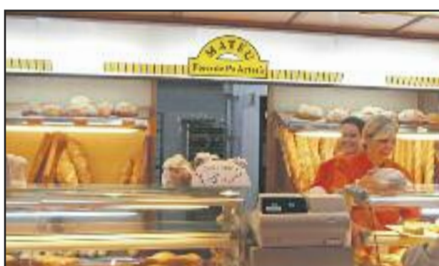
FORN DE PA MATEU