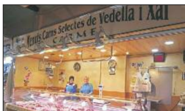
CARNS SELECTES CARME