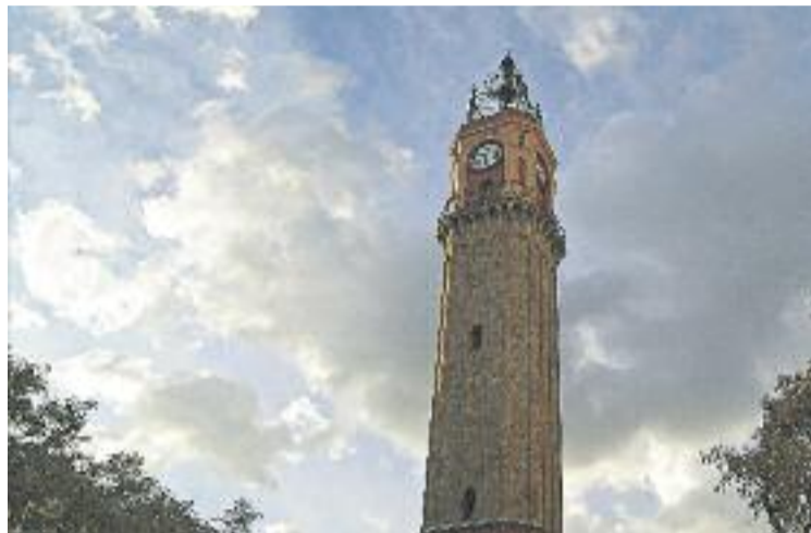
La Torre del Relloige, de l'arquitecte Antoni Rovira i Trias.

Aprofitant aquesta efemèride se celebraran, a partir d'ara i durant l'any que ve, una sèrie d'activitats i actes commemoratius aprovats en una mesura de govern del Districte. Dissabte dia 13 de desembre tindrà lloc una cercavila pels diferents carrers de la Vila que organitza la colla dels Geganters de Gràcia. També servirà per celebrar el 30è aniversari de la construcció del capgròs inspirat en el Campanar, 'El Pepitu Campanar', i el