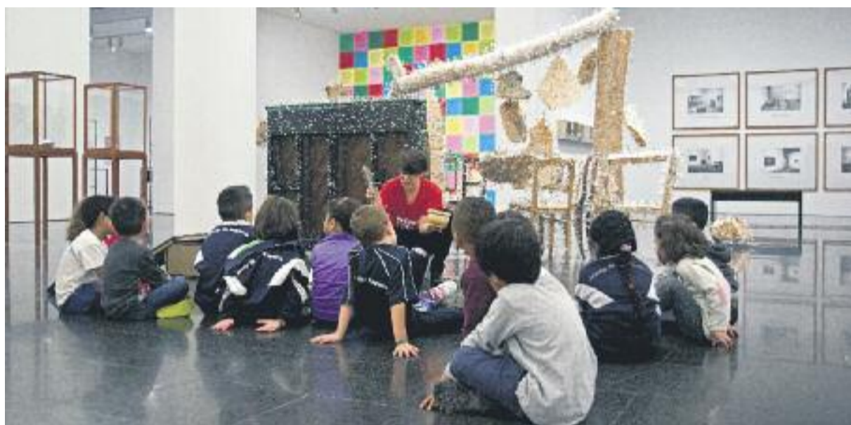
L'ensenyament a l'escola gira al voltant de l'art contemporani i es fan visites al MACBA.