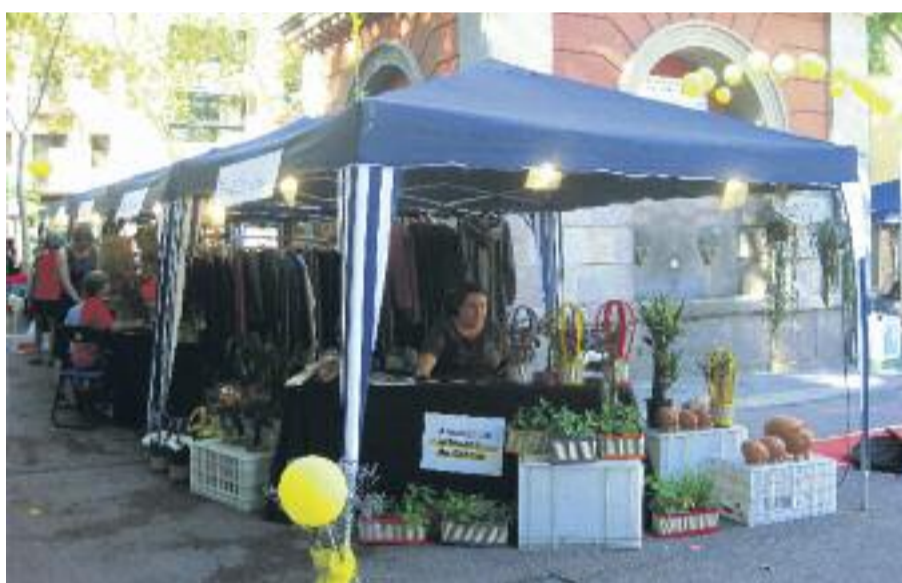
El comerç gracienc s'ha caracteritzat sempre per tenir una personalitat pròpia.