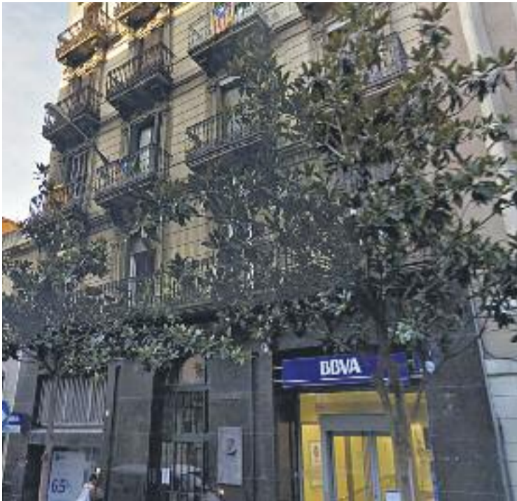
Una de les residències d'estudiants del districte.