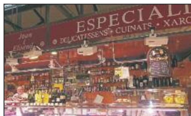
DELICATESSENS JOAN I ELISENDA