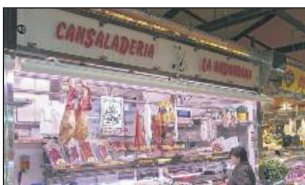
CANSALADERIA LA ANDORRANA