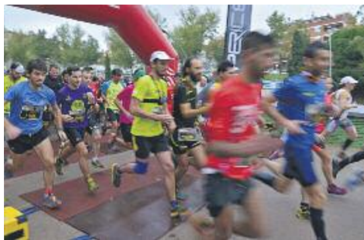
La cursa va tenir més de 400 participants.

ATLETISME ▶ Més de 400 corredors van participar el passat 30 de novembre en la segona edició del Cros 3 Turons, la cursa de muntanya que recorre tres turons de la ciutat, un d'ells al districte de Gràcia -el Turó de la Creueta del Coll-. A més, la carrera va passar per un altre dels indrets emblemàtics de Gràcia: el Park Güell.