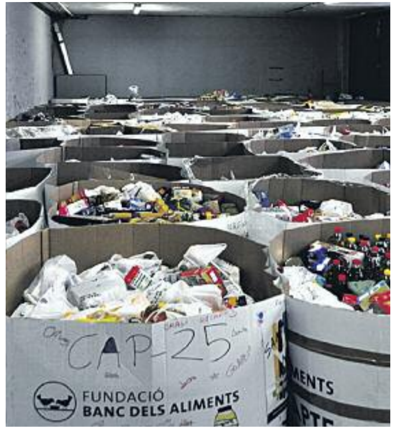
El paper dels voluntaris ha estat clau, un any més, perquè el Gran Recapte hagi funcionat.