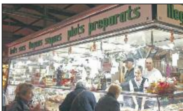
LLEGUMS I CUITS VILELLA