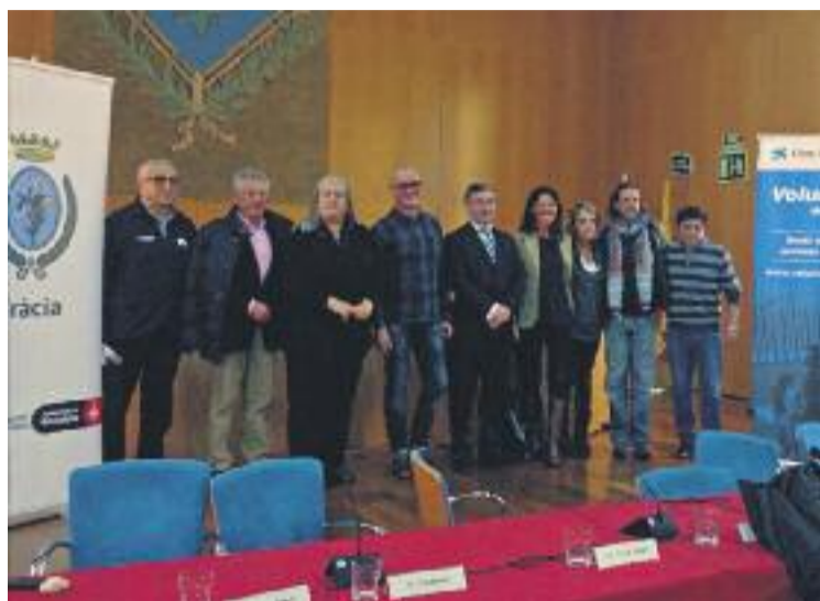
La campanya es va presentar dilluns passat.