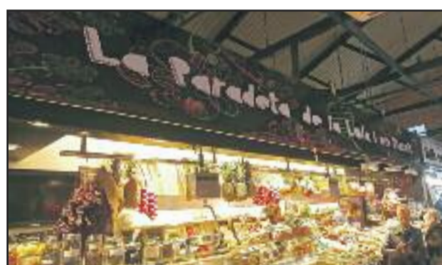
LA PARADETA DE LA LOLI I EL NARCÍS