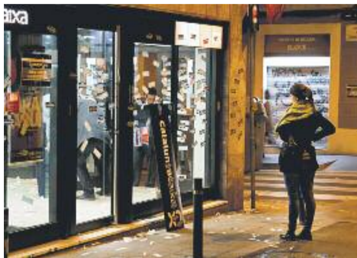
Una imatge antiga de l'espai.

Per fer-ho, fan una crida a tota la gent que els ha donat suport i afegeixen que "per intentar aturar el desallotjament només ho podem fer amb el suport de tots plegats".