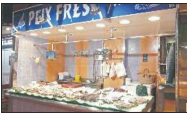
PEIX FRES MIRARI