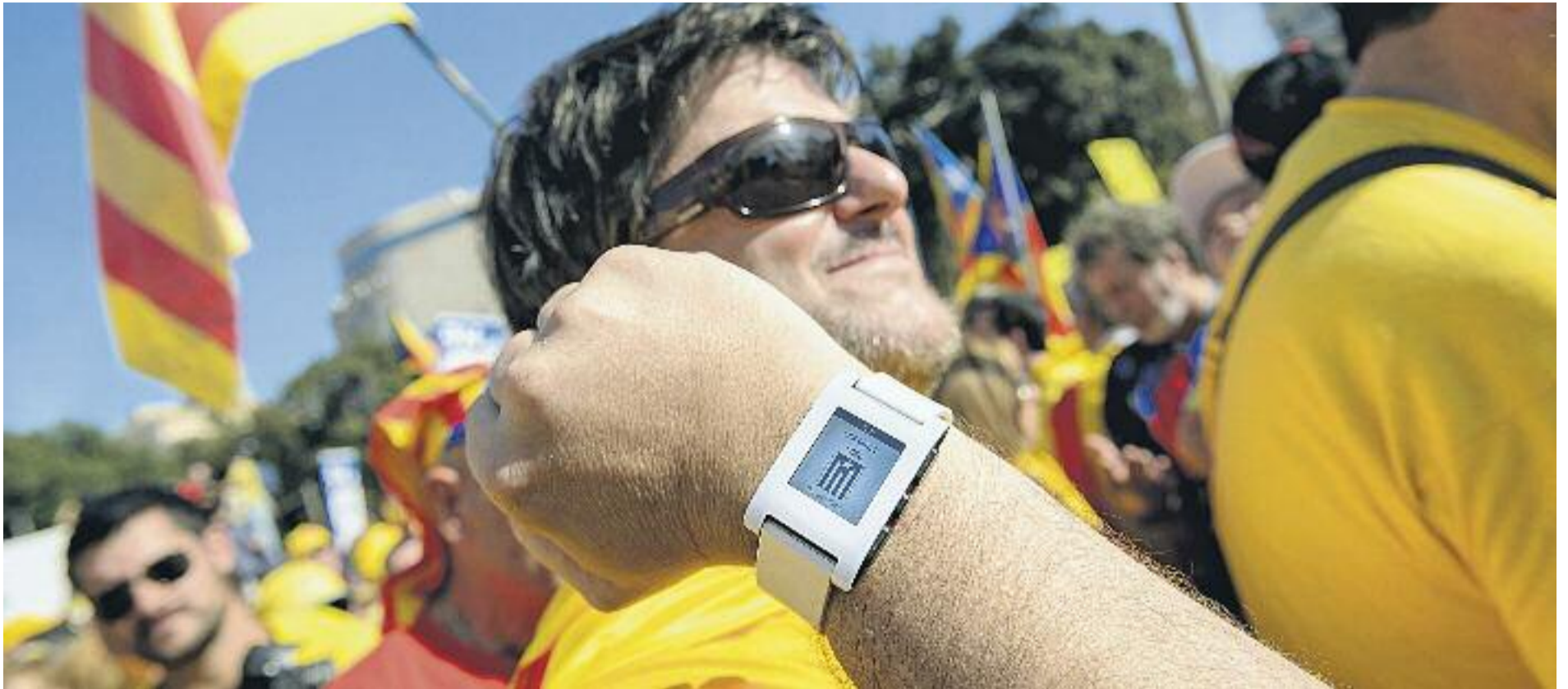
El 9N serà una nova oportunitat perquè els catalans expressin la seva voluntat política.