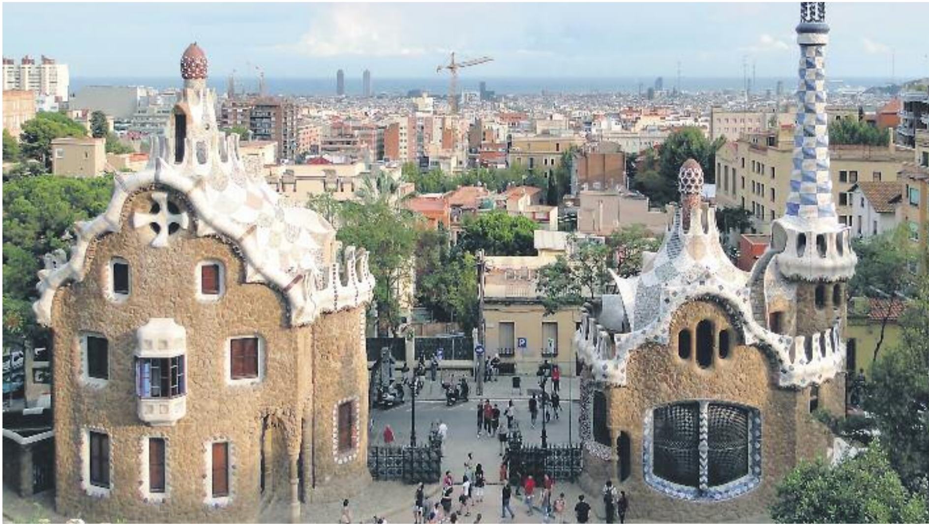
El Park Güell és una de les grans atraccions turístiques de la ciutat.

L'horari d'obertura de la Zona Monumental és de 8:30 del matí fins a les 6 de la tarda a la tardor i l'hivern, i varia la resta de l'any en funció de les hores d'il·luminació solar. Així, de l'1 de maig al 14 de setembre, l'horari és de 8 del matí a 9 del vespre; i entre el 24 de març i el 30 d'abril i entre el 15 de setembre i el 26 d'octubre, el parc està obert de 8 del matí a 8 del vespre.