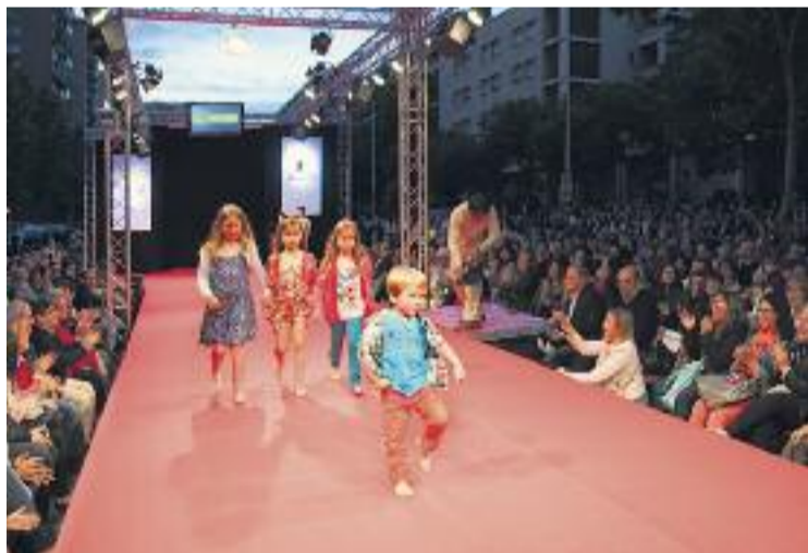
El programa de passarel·les fa enguany 7 anys de vida.