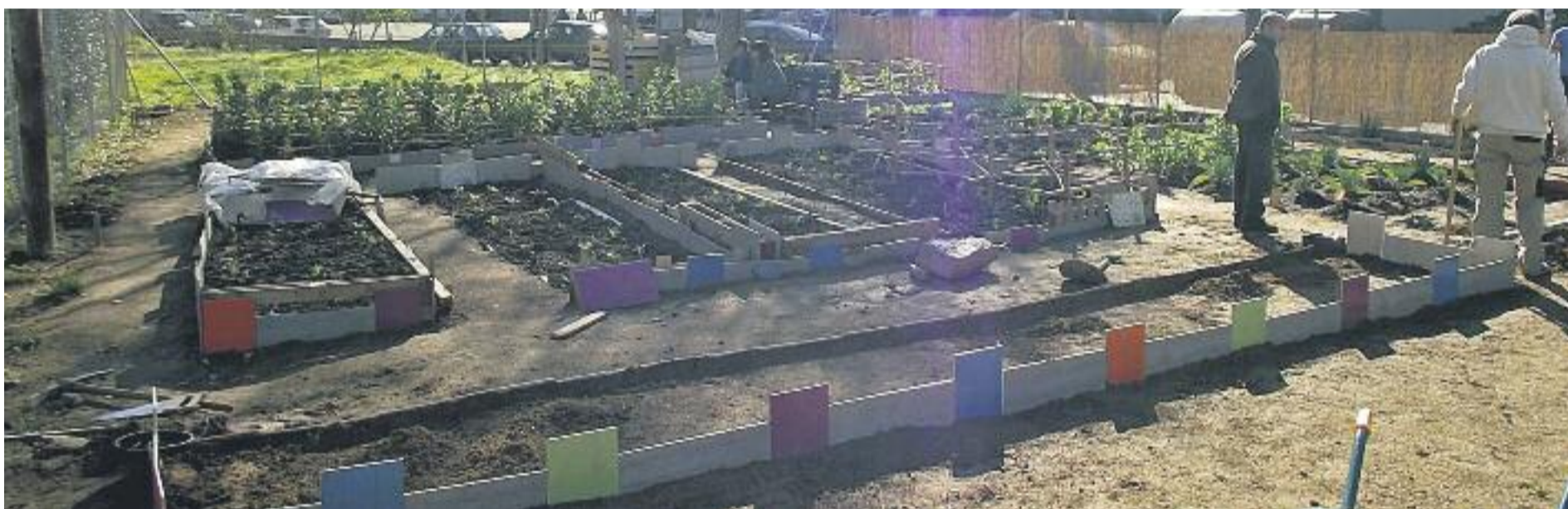
Una exposició al centre (a dalt a l'esquerra), la tradicional sortida a Les Planes (a dalt a la dreta) i l'hort que gestiona el centre (a sota).