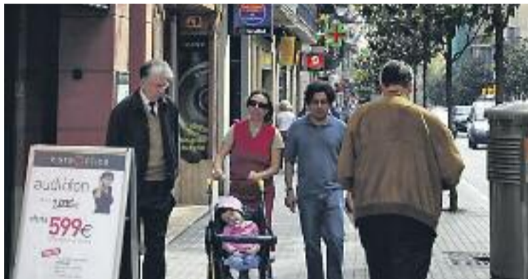
Les dades de l'IcoB es corresponen a l'últim trimestre.

Aquest estudi, elaborat per ESADE i la Fundació Barcelona Comerç, mostra les dades de vendes corresponents al tercer trimestre d'enguany, entre juliol i setembre. Aquest estudi es re-