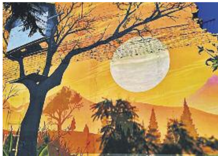
Imatge del grafit que s'ha dibuixat a la paret.

La Casita Blanca va ser fins al febrer de l'any 2011 un meublé de la ciutat amb molta història, després de la seva obertura un segle abans, tot i que en aquell moment era una senzilla sala de la part de dalt d'una marisqueria que el 1912, veient el seu èxit, es va ampliar.