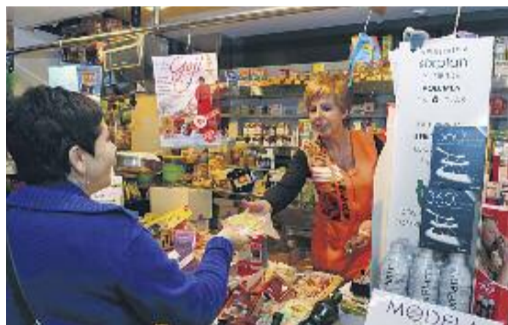
Els comerciants graciencs escalfen motors de cara a Nadal.

Per altra banda, els comerciants de Gran de Gràcia, els del carrer Astúries i els de Traversera han arribat a un acord amb el Cinema Texas perquè durant la campanya de Nadal els seus clients puguin gaudir de descomptes en les entrades de dilluns a dijous.