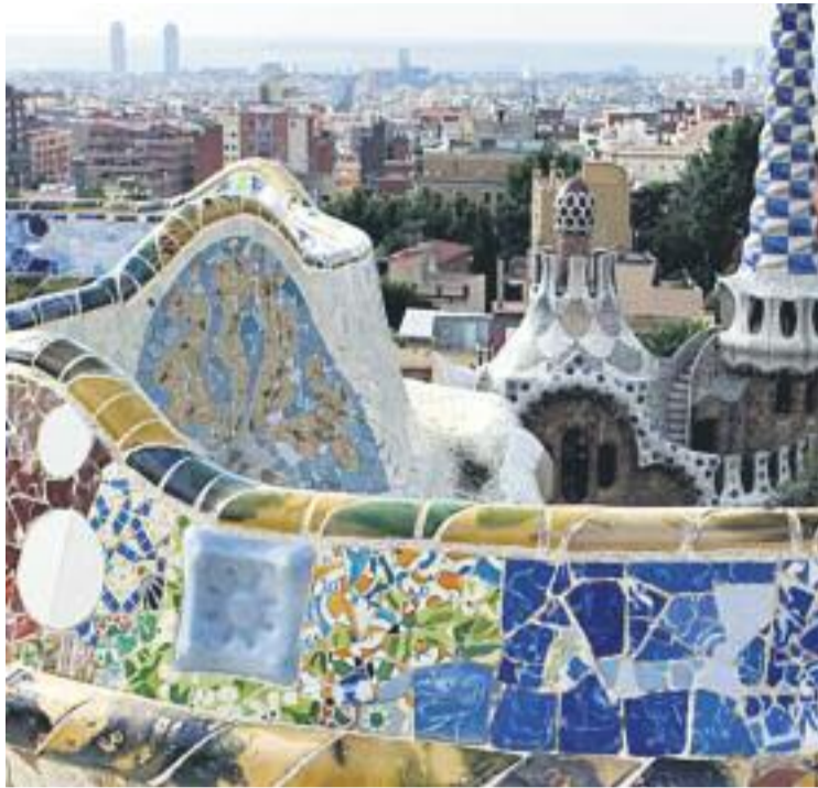
Defensem el Park Güell qüestiona el missatge del consistori.