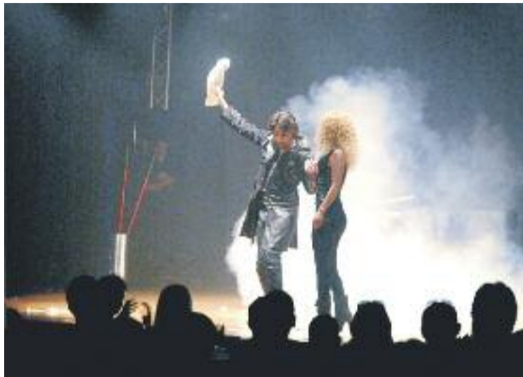
El públic va respondre i va omplir els actes del Màgicus 2014.

El Concurs de Joves Mags, que es va celebrar divendres 17 a partir de les 8 del vespre, va comptar amb 8 participants i va reunir unes 150 persones de públic. Aquest concurs és un dels actes més destacats del festival, ja que aquest té com a objectiu promocionar els mags més joves. L'endemà, a l'activitat Màgia als Mercats, quasi