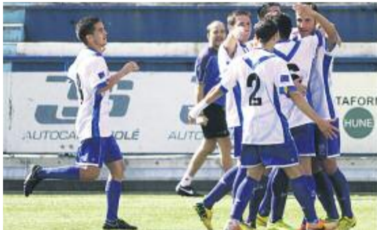
L'Europa jugarà aquest diumenge contra el Rubí.