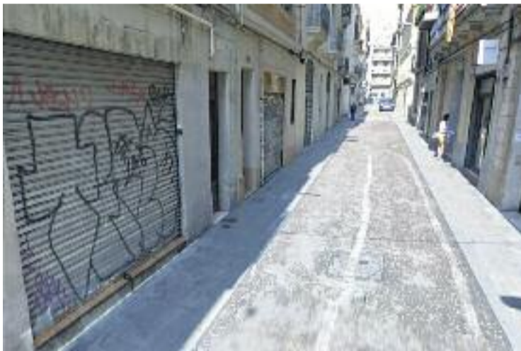
El carrer Sant Pere Màrtir, on es van produir els fets.

pulsats sembla que algun assistent al debat hauria fet córrer un avís per Whatsapp que s'hauria convertit en una cadena que hauria acabat provocant l'arribada dels ara detinguts. Quan els ucraïneses expulsats marxaven de la zona s'haurien topat amb els tres agressors, que els haurien començat a increpar. Posteriorment, el més jove del grup hauria propinat un cop molt fort amb un casc a un d'ells. L'home en qüestió continua hospitalitzat en estat molt greu.