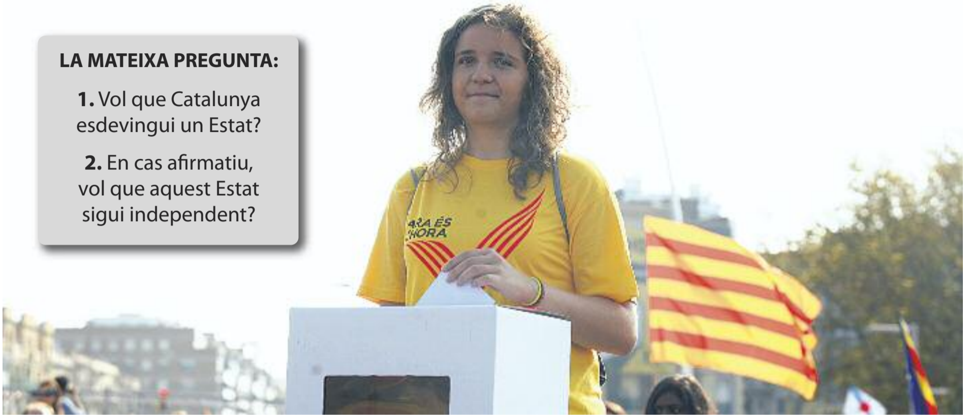
Artur Mas assegura que el dia 9 de novembre hi haurà "locals, urnes i paperetes" per votar la pregunta acordada des d'un principi.