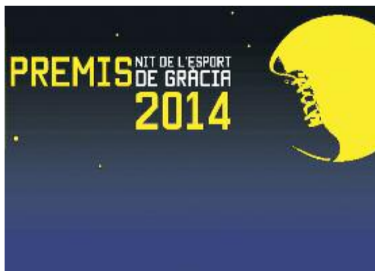
Els premis són un reconeixement a l'esport gracienc.

tes o iniciatives rellevants aconseguïdes durant la temporada 2013-2014. Els vuit guardons restants seran per al millor esportista masculí, la millor esportista femenina, el millor equip masculí, el millor equip femení, la millor iniciativa pedagògica lligada a l'esport, la millor iniciativa social lligada a l'esport, la millor iniciativa comunicativa lligada a l'esport, la millor iniciativa empresarial o empresa lligada a l'esport.