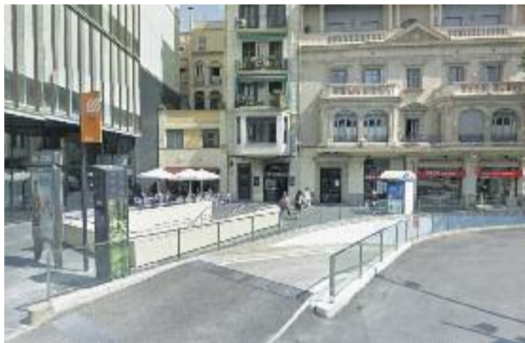
Una de les entrades de l'estació dels FGC.

Això és el que dijous passat el conseller d'Obres Públiques de la Generalitat, Santi Vila, i l'alcalde de la ciutat, Xavier Trias, van exposar durant la presentació de l'estudi informatiu de perllongament de la línia L8 dels Ferrocarrils de la Generalitat de Catalunya (FGC). L'obra, que està contemplada en el Pla Director d'Infraestructures 2011-2020 com a actuació prioritària, suposaria la construcció de quatre quilòmetres de vies i tres noves estacions, que tindrien un cost de 321 milions d'euros. La nova línia, que pujarà pel subsòl del ca-