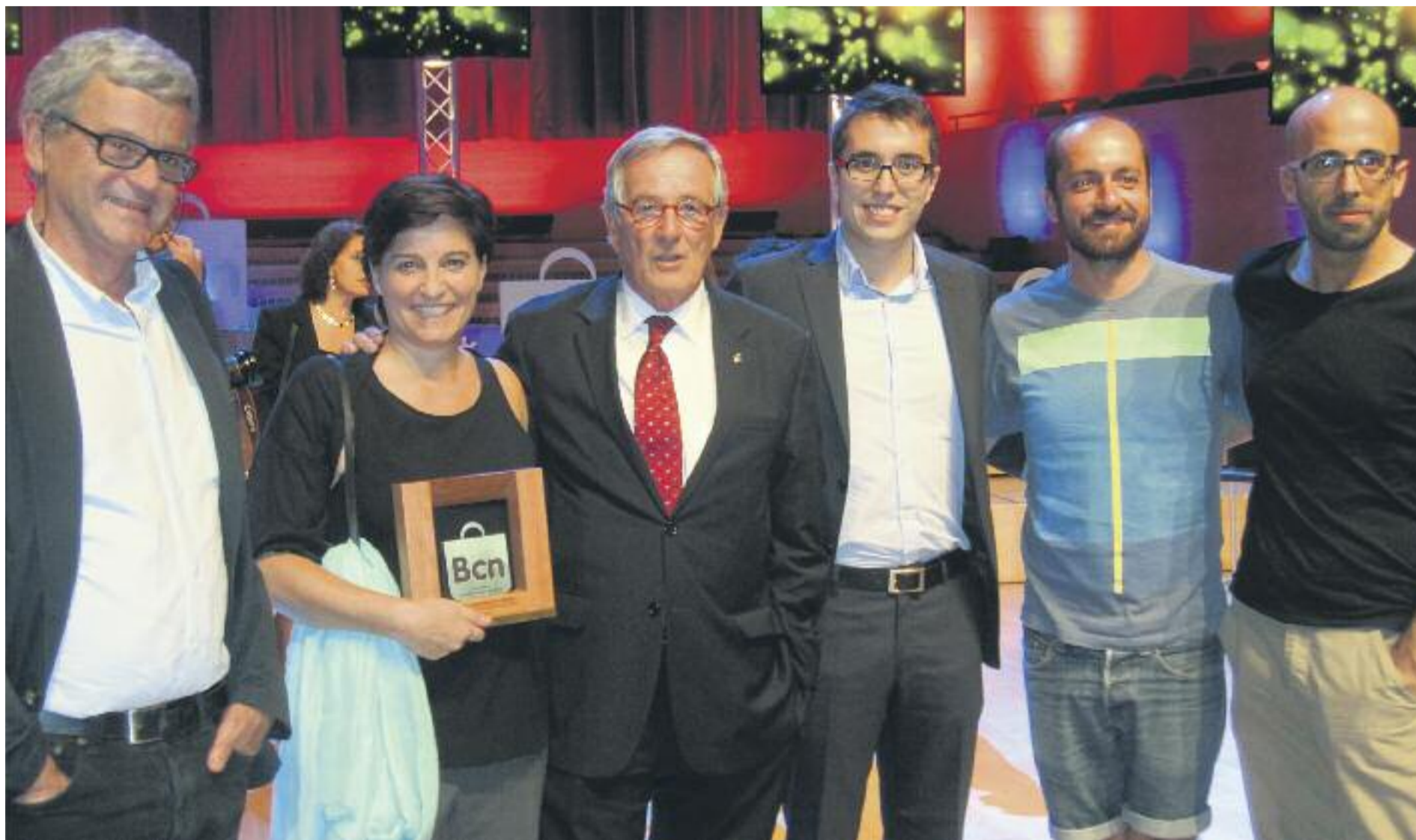
L'Associació de Llibreters Independents de la Vila de Gràcia va recollir, amb el seu president al capdavant, el guardó.

» L'Associació de Llibreters de la Vila i CoopMercat reben premis a la gala de Barcelona, la millor botiga del món