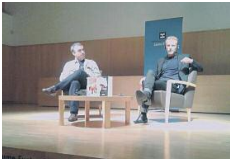
Lorenzo Silva i Jo Nesbo durant la conversa.