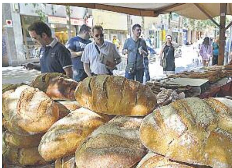
Les Botigues al carrer de Gràcia tenen lloc a la primavera –al maig– i a la tardor –a l'octubre–.