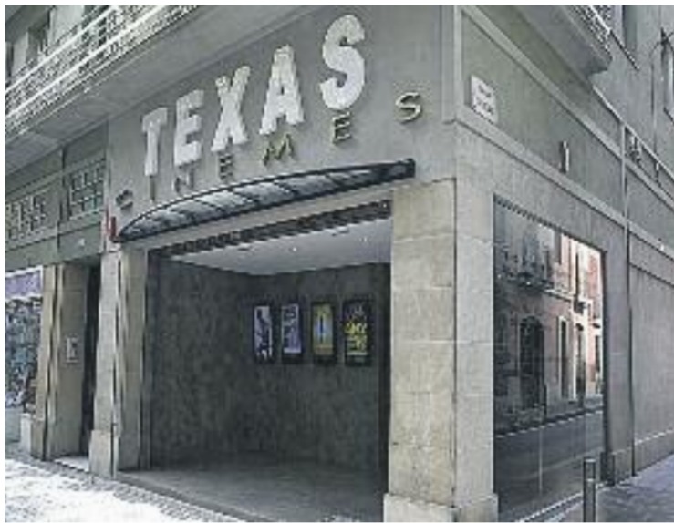
Els Texas aposten per uns preus populars.

La filosofia del Texas, tal com explica el cap visible d’aquest nou projecte, el director Ventura Pons, és oferir una