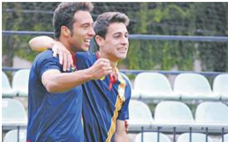
Catalunya va golejar el Piatykhatska per 4 a 0.

A l'espera del retorn dels internacionals, la lliga de Tercera es reprendrà el pròxim diumenge 5 d'octubre, on l'Europa visitarà el camp del Vilafranca. Els homes de Dólera són ara per ara setens