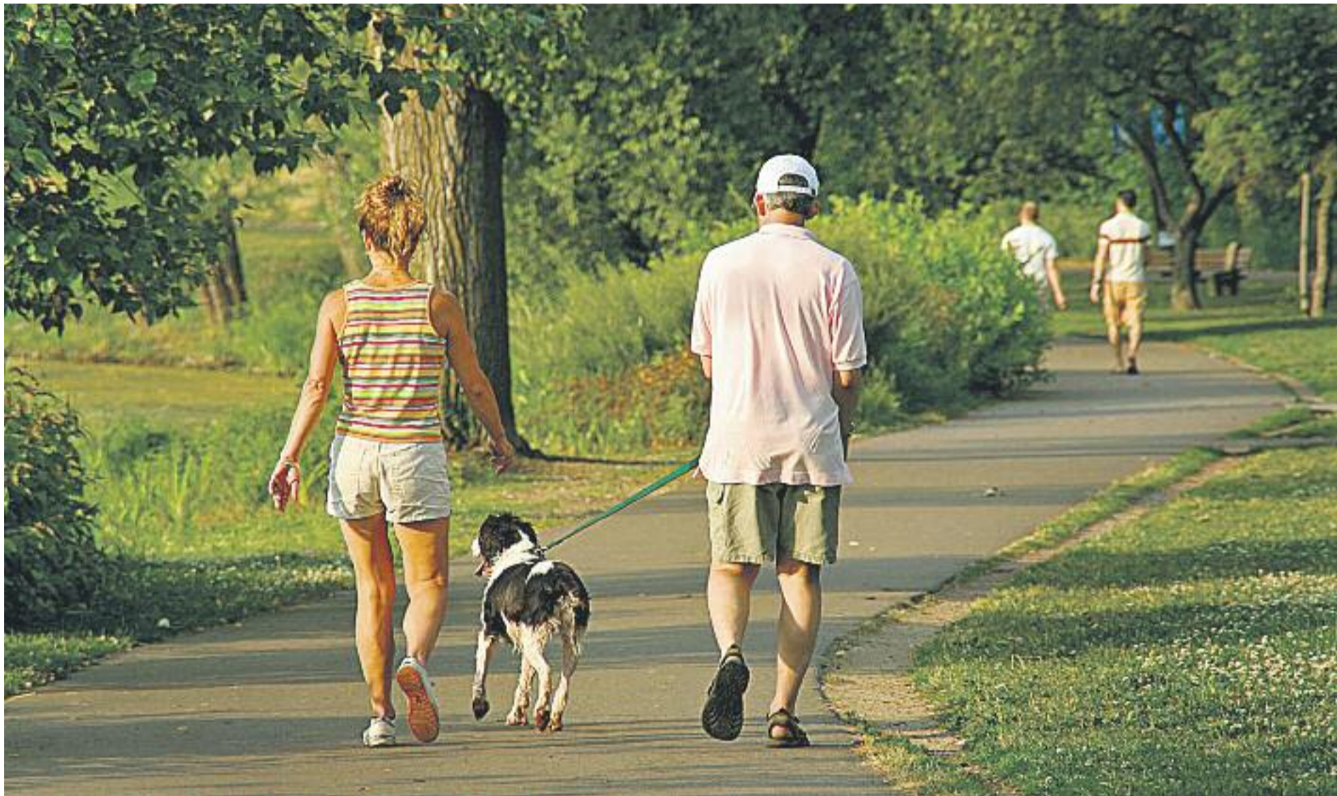
Els propietaris que disposin del carnet de tinença cívica responsable podran tenir el seu gos deslligat en els espais compartits i les franges horàries que s'acordin.

La nova Ordenança Municipal de Protecció, Tinença i Venda d'Animals aprovada per l'Ajuntament de Barcelona prohibeix la tinença de primats, el seu comerç i la cessió entre particulars. El motiu pel qual la nova norma fa aquesta prohibició és perquè els primats no són considerats animals de companyia i per això han de viure en llocs adequats per a la seva supervivència.