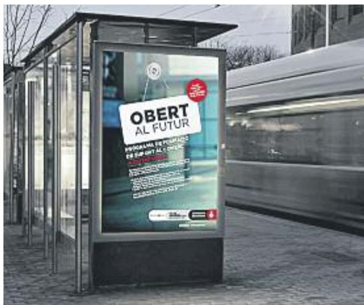
A Gràcia el programa començarà el pròxim dia 30.

Les càpsules formatives són independents i tenen una durada total de 3 hores cadascuna i s'imparteixen en horari de tarda. En el cas de Gràcia, els cursos de formació s'efectuaran a la Biblioteca Jaume Fuster i a la Sedeta, entre altres equipaments del districte.