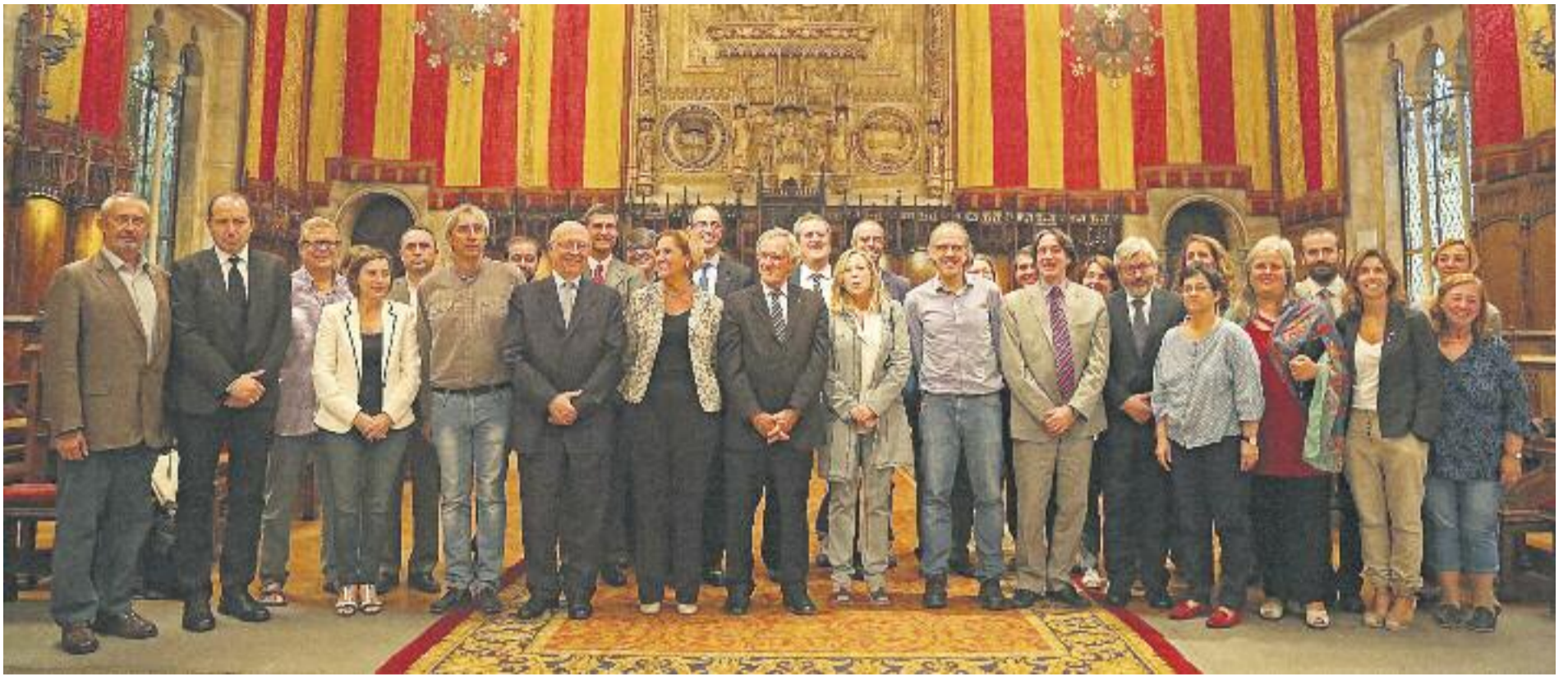
El Ple extraordinari de suport a la consulta del 9N va deixar una foto per a la història.