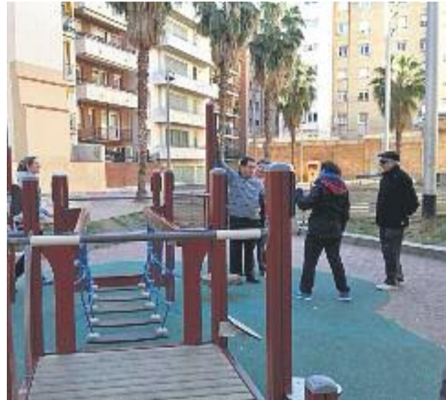
La gent gran té a la seva disposició diversos equipaments i serveis per gaudir d'un envelliment saludable.