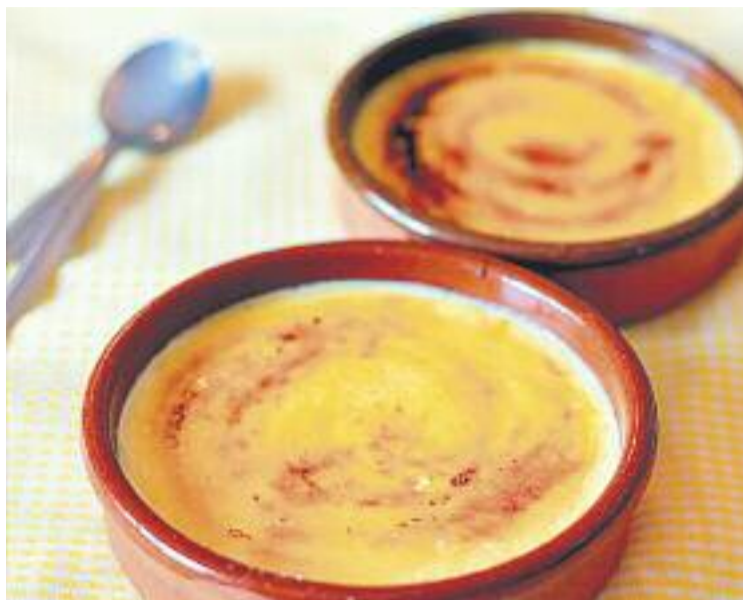
El concurs de receptes finalitzarà el pròxim dia 12.

D'aquest concurs sortiran dos guanyadors, que rebran dos lots de productes dels mercats valorats en 100 euros cadascun. El jurat estarà format, per la seva banda, per un representant del