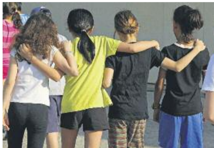
Les sol·licituds es poden lliurar des del passat dia 10.

AJUTS ▶ Amb l'inici del nou curs escolar, l'Ajuntament destinarà 1 milió d'euros perquè tots els escolars puguin inscriure's en activitats esportives fora de l'horari lectiu. Segons informa el consistori, prop de 8.000 escolars d'entre 6 i 17 anys es podran beneficiar d'aquests nous ajuts econòmics. La subvenció s'atorgarà en funció de la renda familiar, amb un màxim de 315 euros per nen i curs. Les famílies interessades poden presentar la