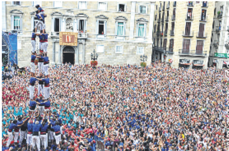
La plaça Sant Jaume va presentar un aspecte immillorable.

Els graciencs van completar el que sens dubte és la millor actuació de la seva història després de descarregar la tripleta gracienc, formada pel tres de nou amb folre (3d9f), el quatre de nou amb folre (4d9f) i el tres de vuit amb agulla (3d8a). Per arrodonir la jornada van fer el pilar de set amb folre (p7f) i dos pilars de cinc, que van servir per posar la cirereta a una diada que també va suposar que es convertissin en una de les colles que porten castells de nou a la plaça de Sant Jaume, juntament