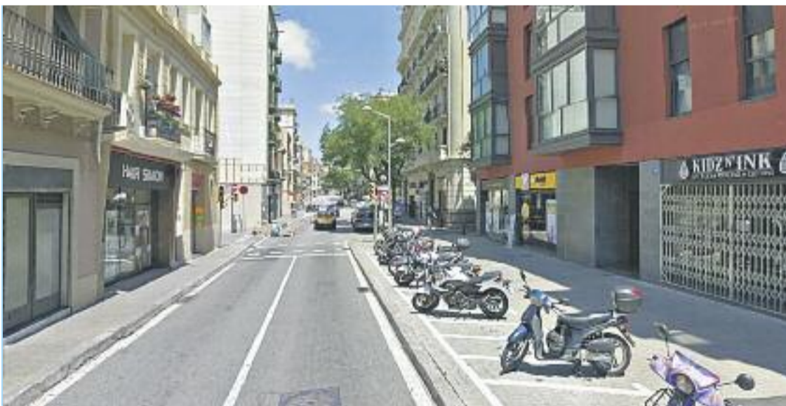
Un aparcament de motos a la Travessera de Gràcia.

TRANSPORT ▶ La Comissió de Seguretat i Mobilitat va rebutjar la setmana passada la proposta del grup municipal d’ICV-EUiA que demanava la retirada del pla d’estacionament de motocicletes del Districte, que suposarà que Gràcia tingui un 17% més d’aparcaments per a aquest tipus de vehicles.