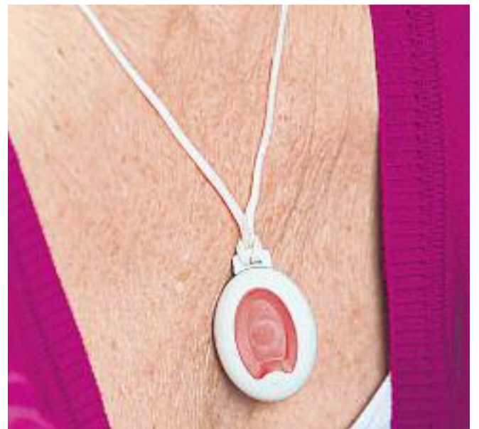
El servei de teleassistència en l'àmbit de la salut és un clar exemple dels beneficis per al ciutadà d'una smart city .