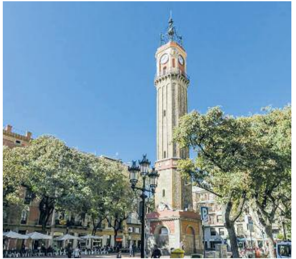
El boom turístic dels darrers anys ha provocat que la xifra d'apartaments turístics que hi ha al districte hagi crescut molt.