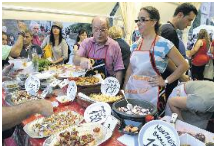
Un instant de la passada edició de la fira.