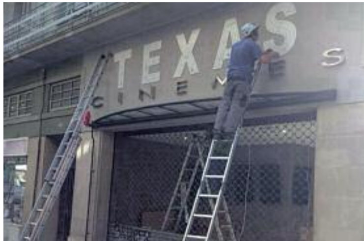
Un operari col·loca el nou cartell.

Sota l'impuls i la direcció de Ventura Pons, els Texas, amb quatre sales noves, tindrà una programació exclusivament en versió original. En el cas dels films estrangers, els subtítols sempre seran en català. El cinema ha estat renovat i estrenarà noves butaques, moqueta i projectors digitals en totes les sales. Les quatre sales, amb 540 butaques en total, estaran dedicades a diferents personalitats del cinema català: el director de fotografia Néstor Almendros,