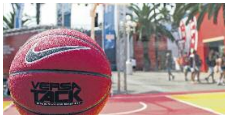
S'han organitzat un bon grapat d'activitats a tota la ciutat.

BÀSQUET ▶ El Mundial de bàsquet ja ha aterrat a Barcelona. Des del passat cap de setmana el Palau Sant Jordi acull alguns partits de la segona fase de la competició, la corresponent als vuitens de final, als quarts i a les semifinals.