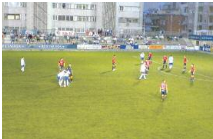
Una imatge del partit del Centenari contra l'Osasuna del 2007.

Moltes coses han succeït des d'aleshores, però ara l'entitat gracienc vol ampliar la seva memòria, motiu pel qual ha fet una crida a l'afició per recopilar fotografies antigues per millorar