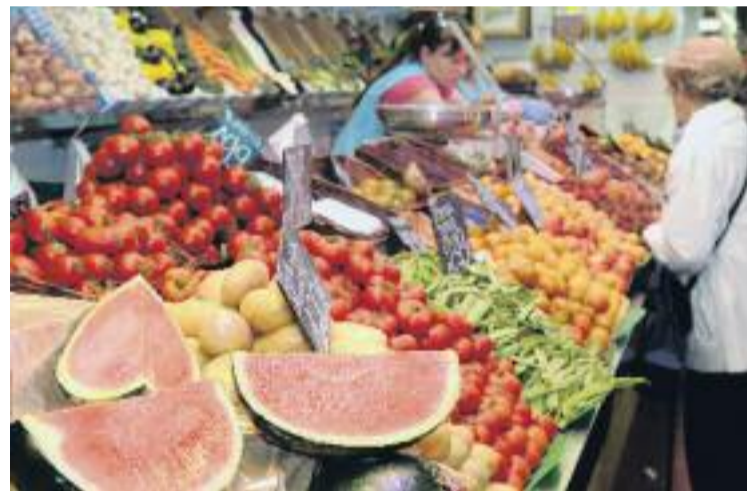
La campanya vol posar en valor els productes frescos.

El protagonista d'aquesta campanya és el migcampista del primer equip del FC Barcelona, Sergio Busquets.