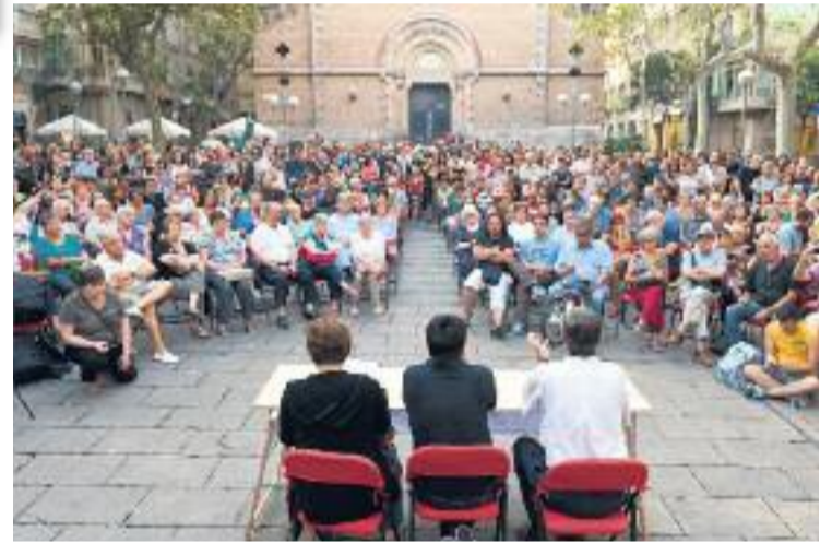
700 graciencs es van reunir a la plaça Virreina.

El moment més important de la intervenció de Colau va ser quan va anunciar l'acte que prepara Guanyem pel pròxim 16 de setembre. La plataforma té la intenció de començar a articular la candidatura municipalista i presentar tota la feina feta fins ara després que a mitjans agost ja assolissin les 30.000 firmes de suport. En un comunicat, la plataforma ha explicat recentment que aquest acte ha de servir per "decidir com guanyem Barcelona de manera real i concreta".