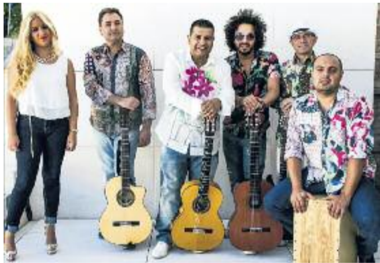
Sabor de Gràcia tornarà als escenaris ben aviat.