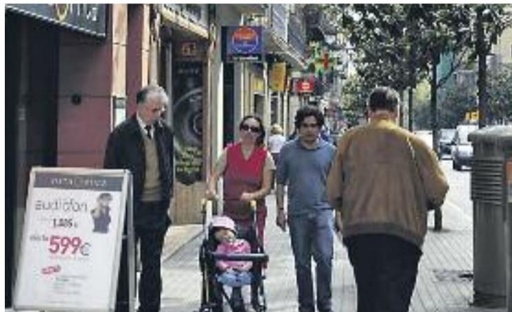
La ciutat és un centre atractiu per al comerç detallista.

Aquest document permet constatar que la capital catalana manté un bon posicionament econòmic i empresarial en els àmbits internacional i continental.