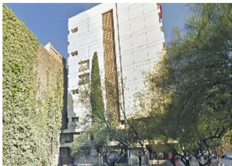
Imatge de l'antiga comissaria de Lesseps.