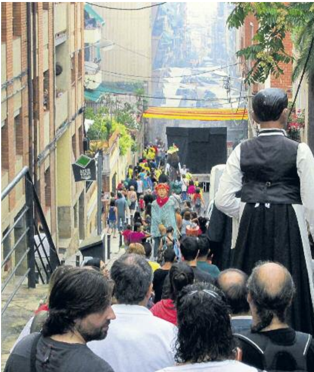
La cultura popular té una presència destacada a la Festa Major dels barris del nord.