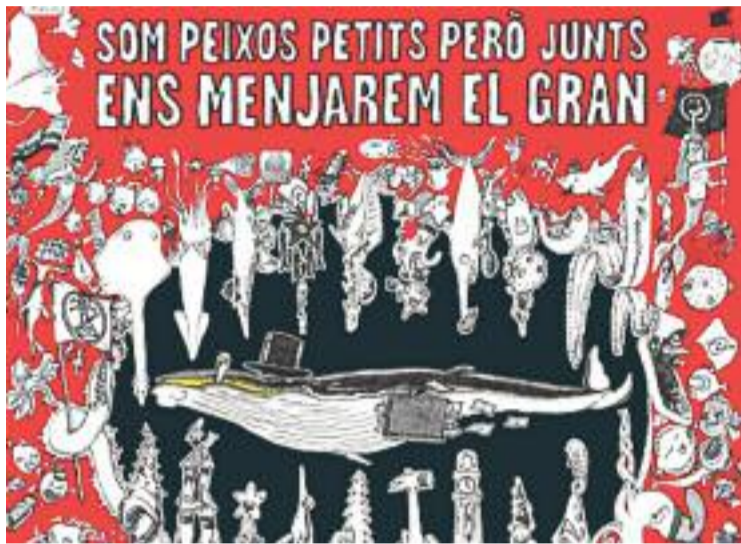
El cartell de la celebració d'enguany.

Per altra banda, la programació de la festa alternativa de Gràcia tindrà un esperit continuïsta i similar a la dels anys anteriors, però sense perdre el seu esperit combatiu, que queda re-