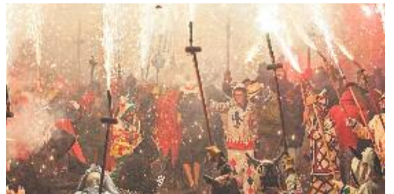
Els organitzadors demanen precaució als participants del correfoc.

El torn del correfoc serà el pròxim dijous 21 a partir de dos quarts de 10 de la nit, una cita on es recomana seguir tot un seguit de consells com portar roba de cotó o tenir cura de protegir-se zones delicades com els ulls.