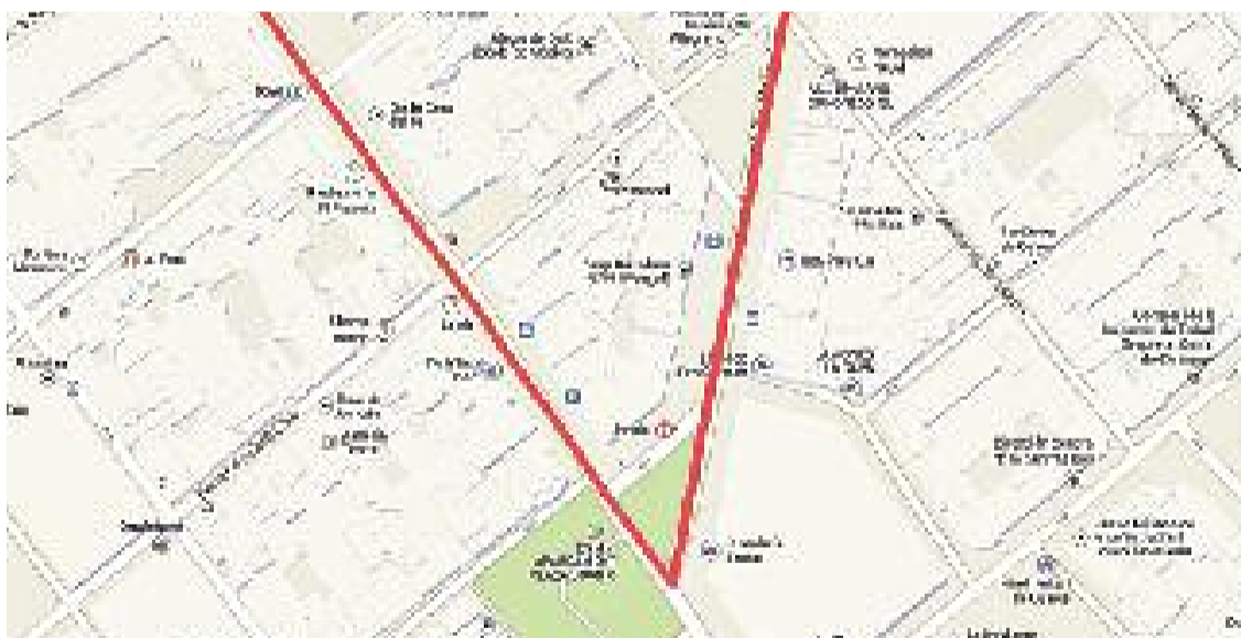
La 'V' graciencina es farà el dia 19 d'agost a la cruïlla Pi i Margall-Escorial.

AGENDA NACIONAL ▶ Com ja va succeir l'any passat, el toc polític i reivindicatiu més important de la Festa Major el posarà l'Assemblea Nacional Catalana (ANC), que a través de la seva territorial graciencina durà a terme un assaig de la 'V' de l'Onze de Setembre el dia 19 d'agost a la cruïlla Pi i Margall-Escorial.