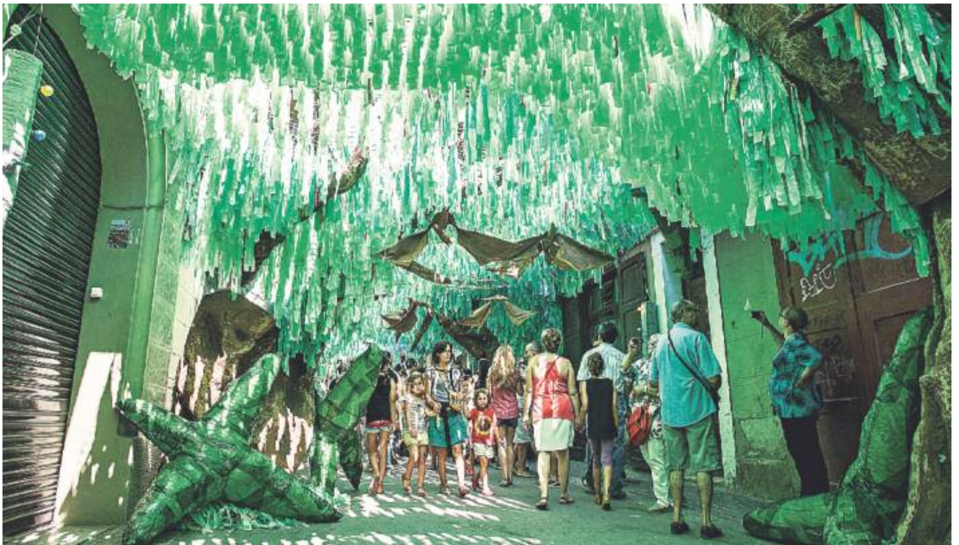
Imatges d'arxiu dels guarniments del carrer Progrés, guanyador de la Festa Major de l'any passat.