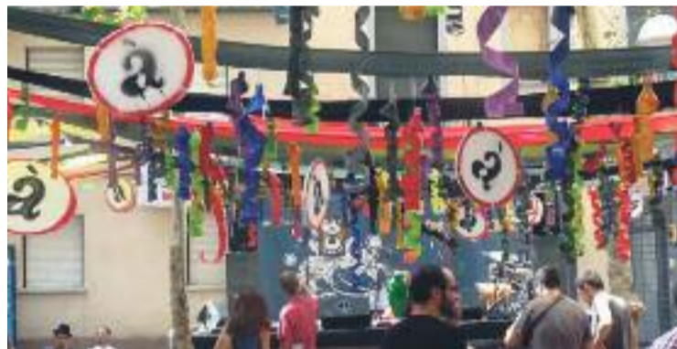
La programació seguirà la tònica de l'any passat.

L'endemà dia 19 serà el torn de la Plataforma d'Entitats Juvenils de Gràcia per organitzar la programació, on destacarà la gimcana lúdico-festiva de les set de la tarda. La festa acabarà dimecres dia 20 amb una marxa de torxes a dos quarts de nou i una actuació musical.