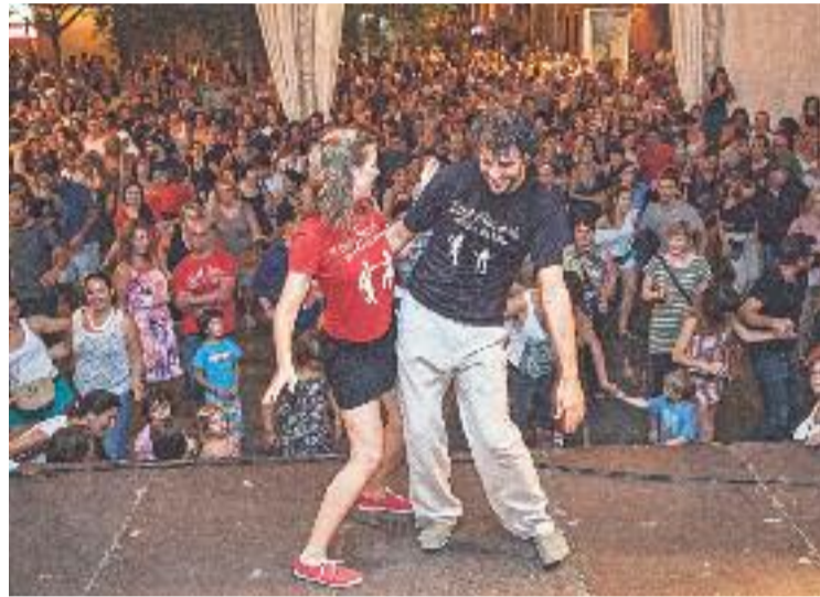
Classe a l'espai del 'swing' del 2013.

La plaça del swing serà el nom que durant els dies de festa durà la plaça del Diamant, on