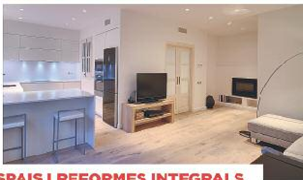
ESPAYS I REFORMES INTEGRALS