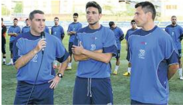
Dólera i els dos capitans a la presentació de l'any passat.

D'aquesta manera, l'Europa començarà a preparar el pròxim Torneig d'Històrics, que tindrà lloc a partir del pròxim 4 d'agost al Municipal del Guinardó.