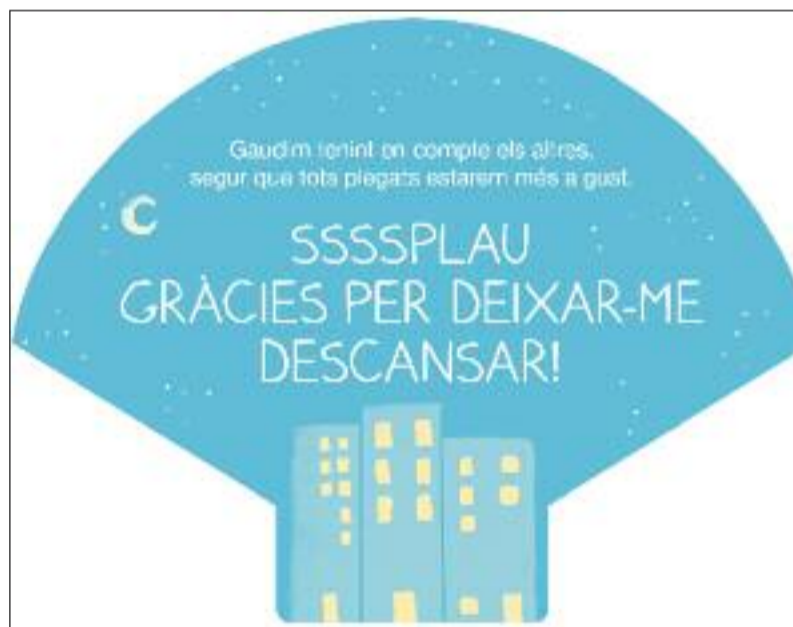
Les dues parts del ventall que repartirà el Districte (dreta). A sota, el vinil que s'instal·larà a les persianes dels comerços graciencs.