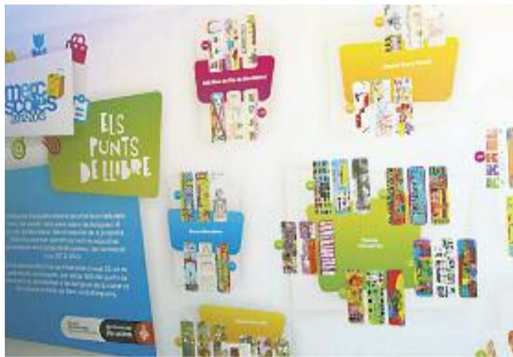
Les escoles interessades poden inscriure's-hi fins a l'octubre.