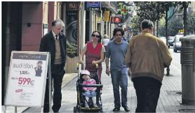
Els botiguers, esperançats amb els resultats de venda de l'estiu.

Aquestes dades esperançadores fan que els comerciants esperin que els resultats millorin a molt curt termini i que les vendes durant aquest estiu i el següent trimestre puguin millorar. En el marc d'aquest panorama, destaca la dinàmica del sector de l'a-