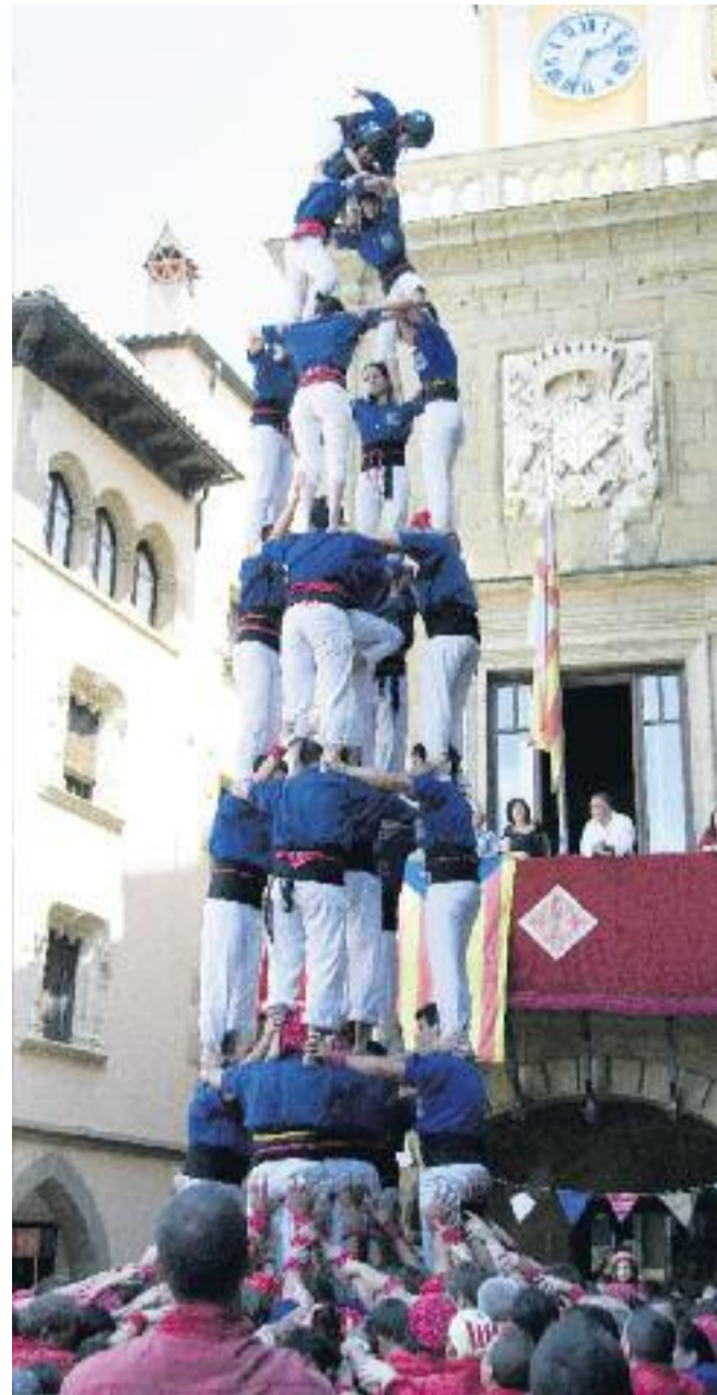
Els castellers van completar una actuació per a la història.