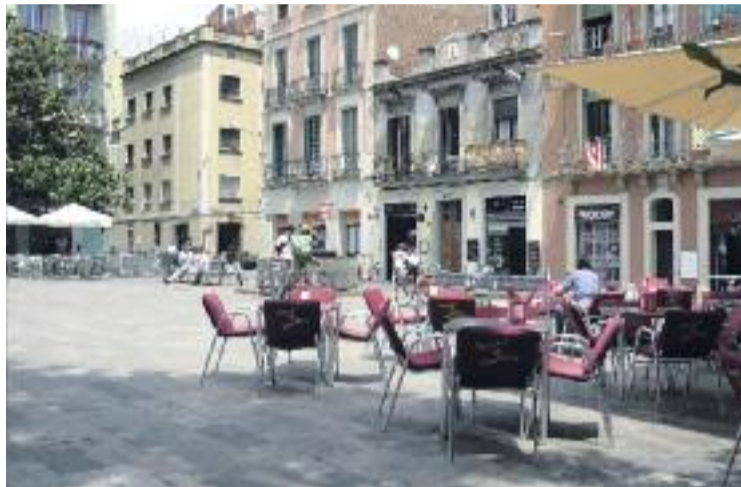
Imatge d'una terrassa de la plaça del Sol.