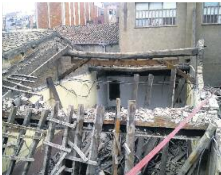
La reforma de l'emblemàtic edifici ja ha començat.