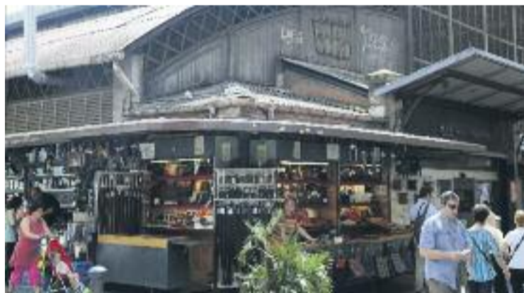
El Mercat de l'Abaceria va acollir una part de la fira.

Pel que fa als comerciants participants, aquests asseguren que a primera hora "la festa va anar molt bé", però que a partir de les 11 de la nit "va baixar considerablement", tal com expliquen a Línia Gràcia des de l'Associació de Comerciants Nova Travessera. Per aquesta raó, des de l'associació demanen que aquesta festa comercial es pugui avançar, ja que el descens de visitants que van registrar a última hora podria respondre a què molts ja havien marxat de vacances.