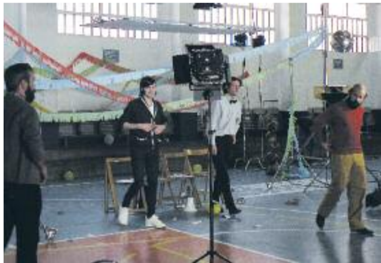
Imatge d'un moment del rodatge del videoclip.