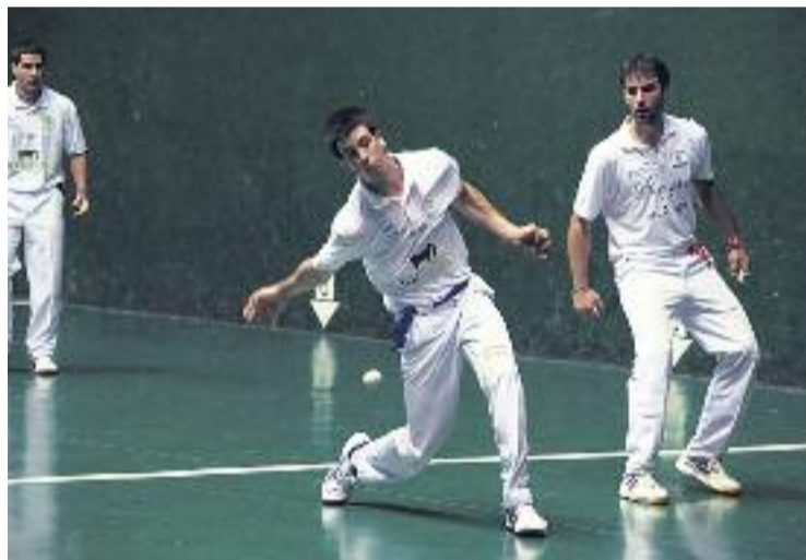
Els millors clubs del continent es donaran cita a Barcelona.

PILOTA ▶ El Centre Municipal de Pilota de la Vall d'Hebron acull a partir de demà i fins diumenge la Copa d'Europa de Pilota, en les modalitats de Frontó de 36 metres –pilota mà, individual i parelles, paleta cuir i paleta curta–.