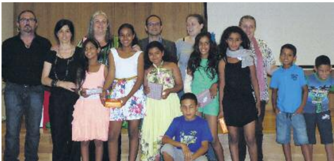
Imatge de la rebuda d'enguany als nens i nenes.

SOLIDARITAT ▶ Com cada estiu, els nens sahrauís tornen a ser a Gràcia. Enguany són 8 els nens i nenes que han vingut a passar els dos mesos d'estiu acollits per diferents famílies graciencques.