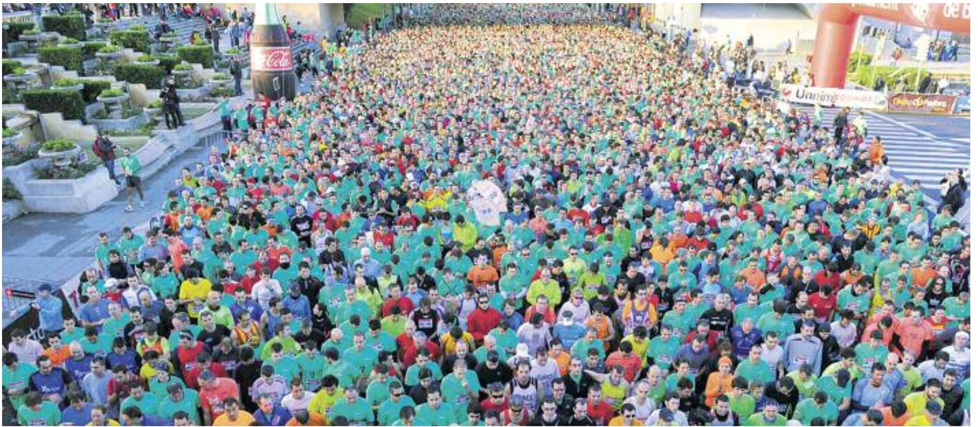
Imatge de la sortida de l'edició 90 de la cursa degana de Barcelona, la Jean Bouin, disputada el novembre de l'any passat.