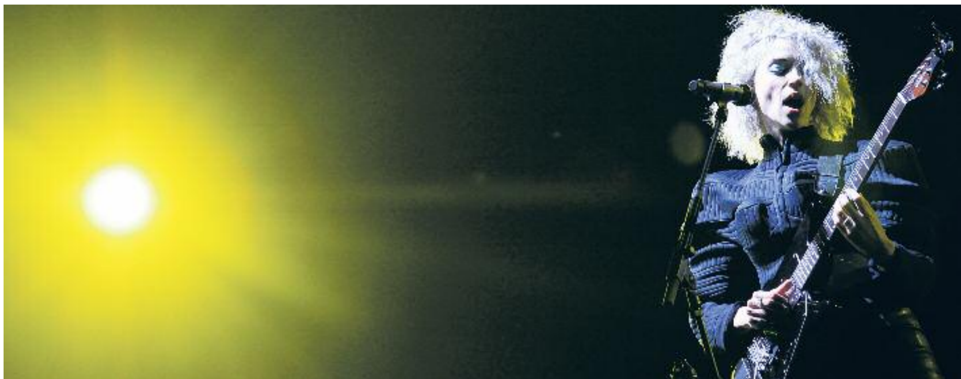
Un moment de l'actuació de la cantautora St. Vicent durant el Primavera Sound d'enguany.