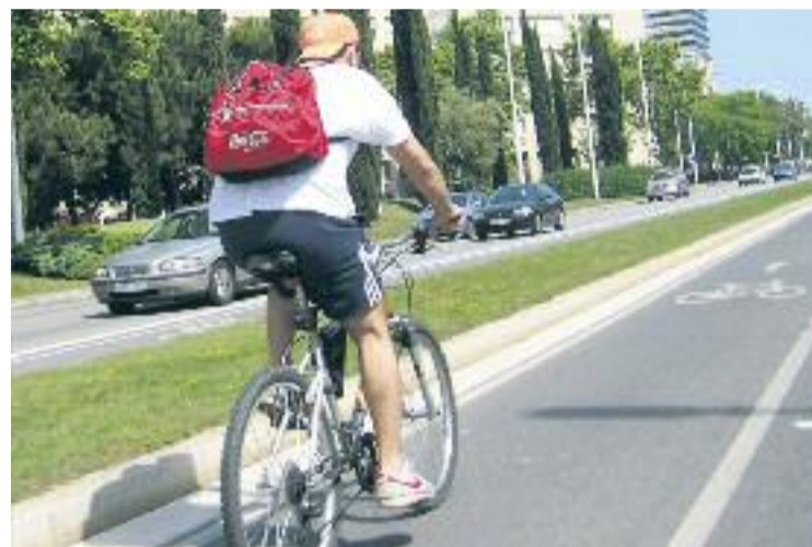
Les administracions volen promoure l'ús de la bicicleta.

La programació de la Setmana de la Bicicleta inclou circuits infantils, un punt d'Inspecció Tècnica de Bicicleta (ITB), concursos de fotografies, pràctiques per als adults que vulguin aprendre a anar en bicicleta, rutes guiades, passejades per la ciutat, biciletada nocturna i compravenda de segona mà. Tot per impulsar un mitjà de transport sostenible i sa.