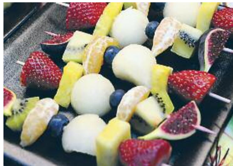
Una de les propostes de la Nit de Tast.

El vespre gastronòmic va ser amenitzat amb l'actuació de la Big Band Valona i del grup Arrels de Gràcia, que van actuar durant tot el temps que va durar l'esdeveniment, ben entrada la nit. El Tast de Nit va coincidir amb altres que es van celebrar a altres mercats de la ciutat.