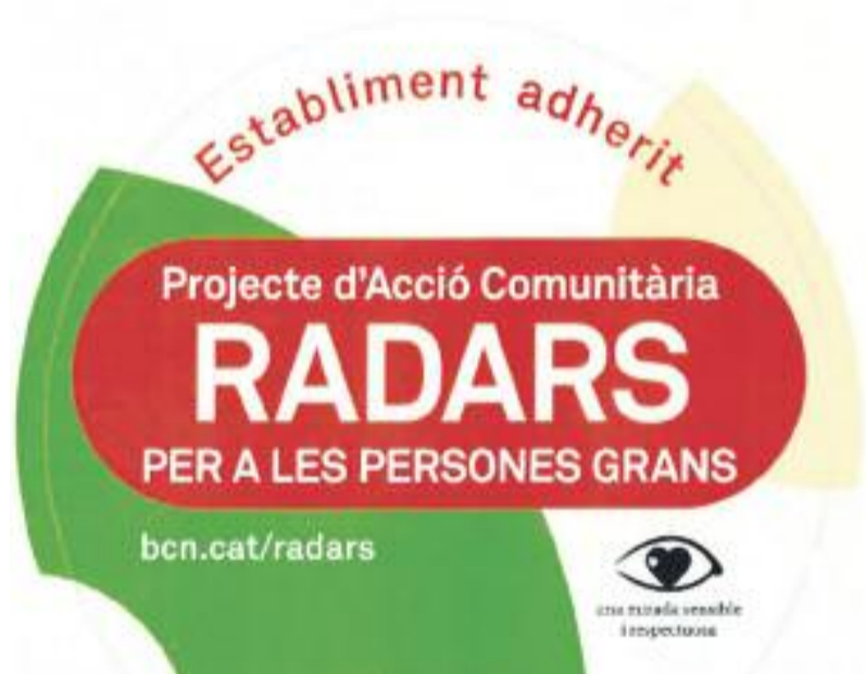
El Districte ha impulsat una campanya perquè els comerços de proximitat s'adhereixin al projecte Radars.