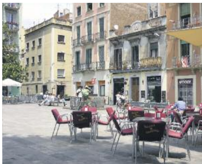
L'Operatiu Estiu 2014 vol garantir la convivència i la seguretat ciutadana.