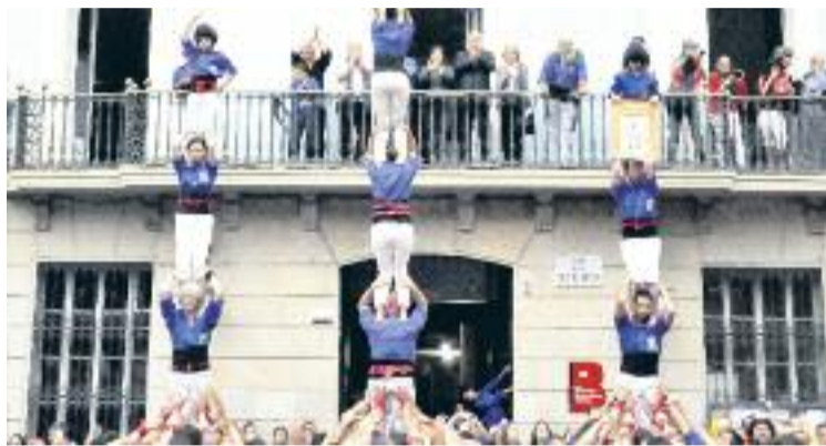
Imatge de tres pilars en una actuació dels CVG.

Roger Gispert, fundador dels castellers de la Vila de Gràcia, as-