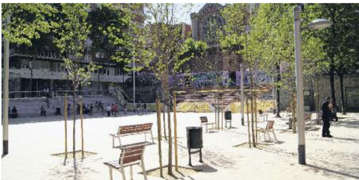
L'Ajuntament preveu que, amb la millora de la zona, aquesta plaça es consolidi com a plaça Major del Camp d'en Grassot.