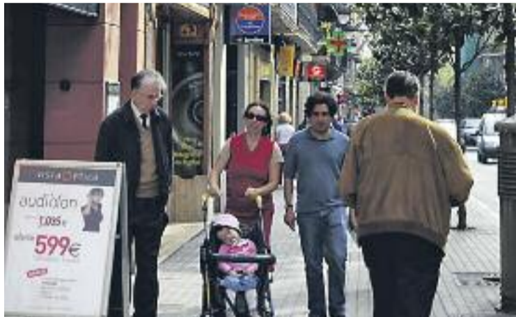
El comerç del districte s'implica amb l'art alternatiu.

Aquesta conjunció d'art i comerç ha estat possible gràcies a la col·laboració entre la regidoria de Comerç i Consum i l'Institut de Mercats de Barcelona amb els organitzadors del festival. Durant