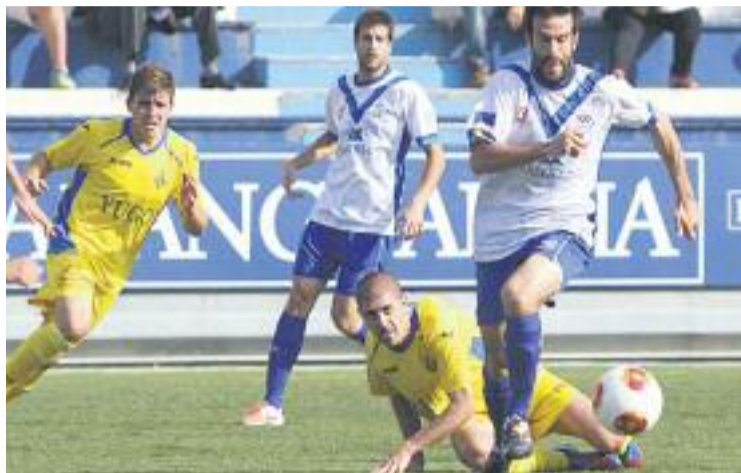
El partit d'anada va tenir una forta càrrega física.

Els castellans van ser un rival molt físic i ben posicionat al terreny de joc i no van concedir cap espai perquè els escapulats creessin ocasions de gol. A poc a poc, però, l'Europa es va fer amo i senyor de la pilota i va assetjar la porteria defensada per Ruiz Caba amb molt d'ímpetu, però sense èxit. El zero a zero final ho deixa tot obert de cara a la tornada de l'eliminàtoria, on els catalans han de marcar obligatòriament per passar de ron-