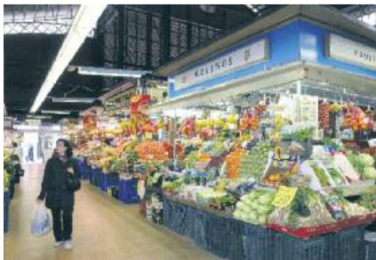
Mercat de l'Abaceria, un dels quatre amb què compta Gràcia.