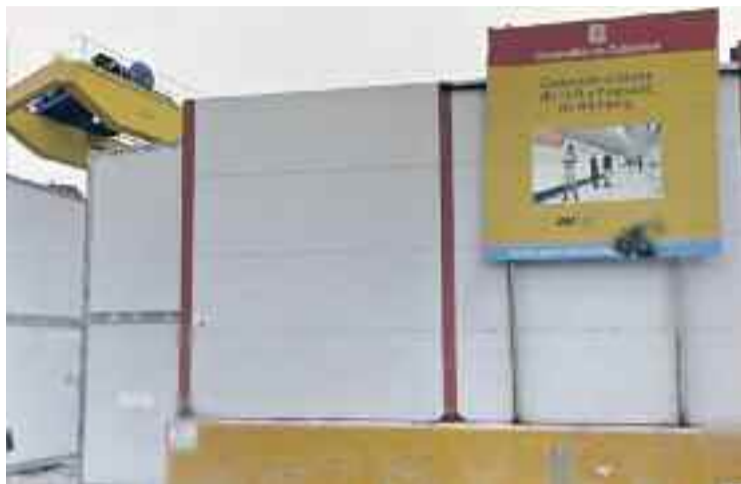
El pressupost per reurbanitzar la plaça és de 2,5 milions d'euros.

Després d'un any amb les obres aturades, l'anunci ha coincidit amb la represa de les protestes per part dels veïns de la