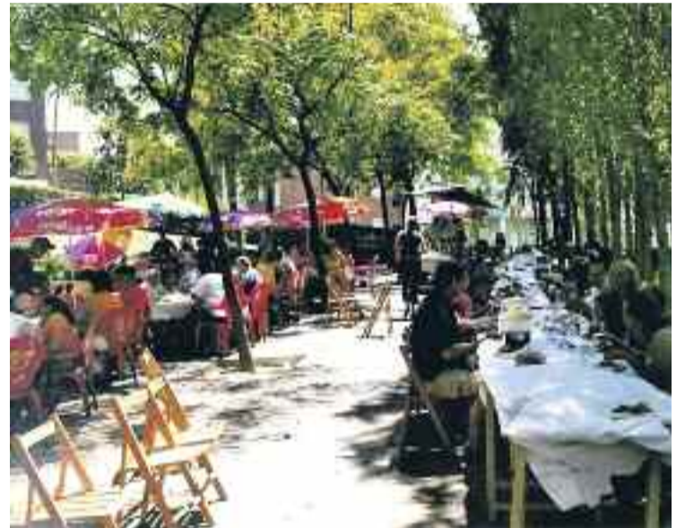
Dinar popular de la festa major de l'any passat.

Teixonera-Penitents, que se celebra demà les 10 del matí a la plaça Vall d'Hebron; el gran xupinazo d'inici de festes del dia 30 protagonitzat per les entitats del barri; la fira d'artesans amb formatges i embotits del diumenge 1, també a la plaça Vall d'Hebron; la festa d'aniversari del dia del Casal d'Avis Penitents, que comptarà amb un lliurament de premis, o l'onzena festa d'aniversari de la Penya Barcelonista Teixonera, que inclourà una petita programació d'activitats esportives i un dinar amb una paella.