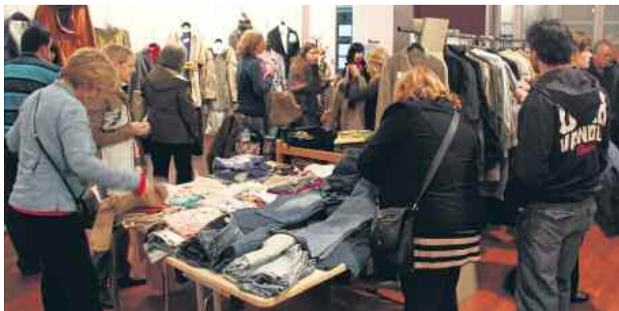
El Renova la teva roba té molt bona acollida entre els barcelonins.