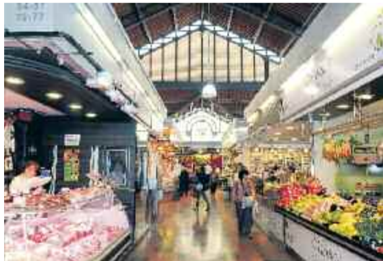
Interior del Mercat de la Llibertat.