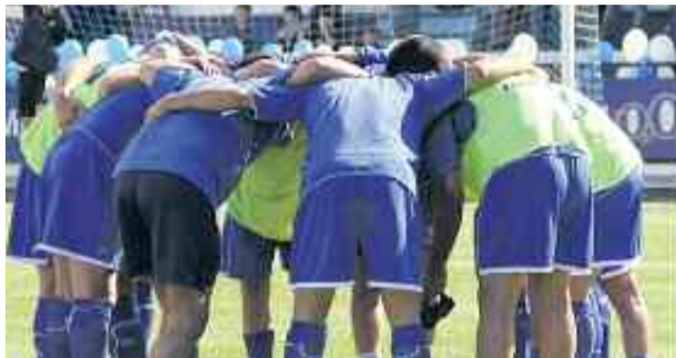
L'equip es concentrarà per al partit a partir de demà.

Pel que fa a la visita a Mutilvera, l'Europa sortirà en autobús des del Nou Sardenya demà dissabte a partir de tres quarts de dues de la tarda, i arribarà al mu-