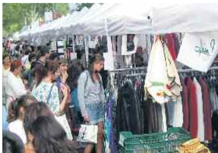
Gairebé tots els eixos comercials del districte van sortir al carrer.

Pel que fa als productes que la gent va comprar, els dels artesans van ser els que van tenir més demanda entre la gent.