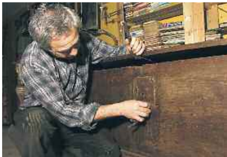
L'Atelier Robert, un dels tallers que obrirà.