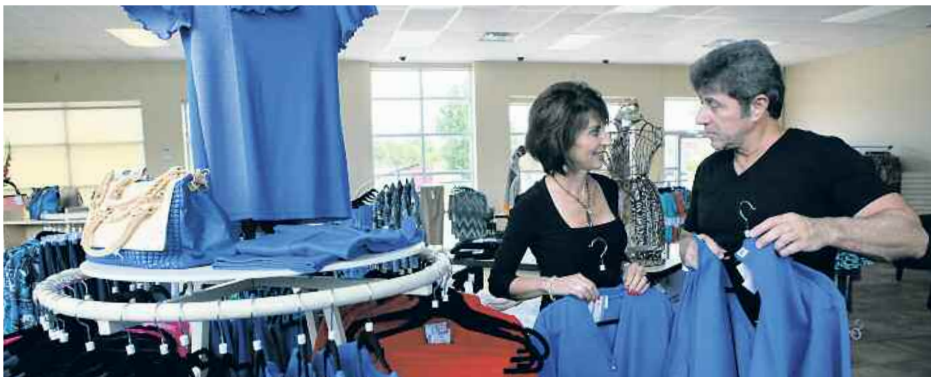
El comerç barceloní busca la manera de poder absorbir tot el turisme que arriba a la ciutat.