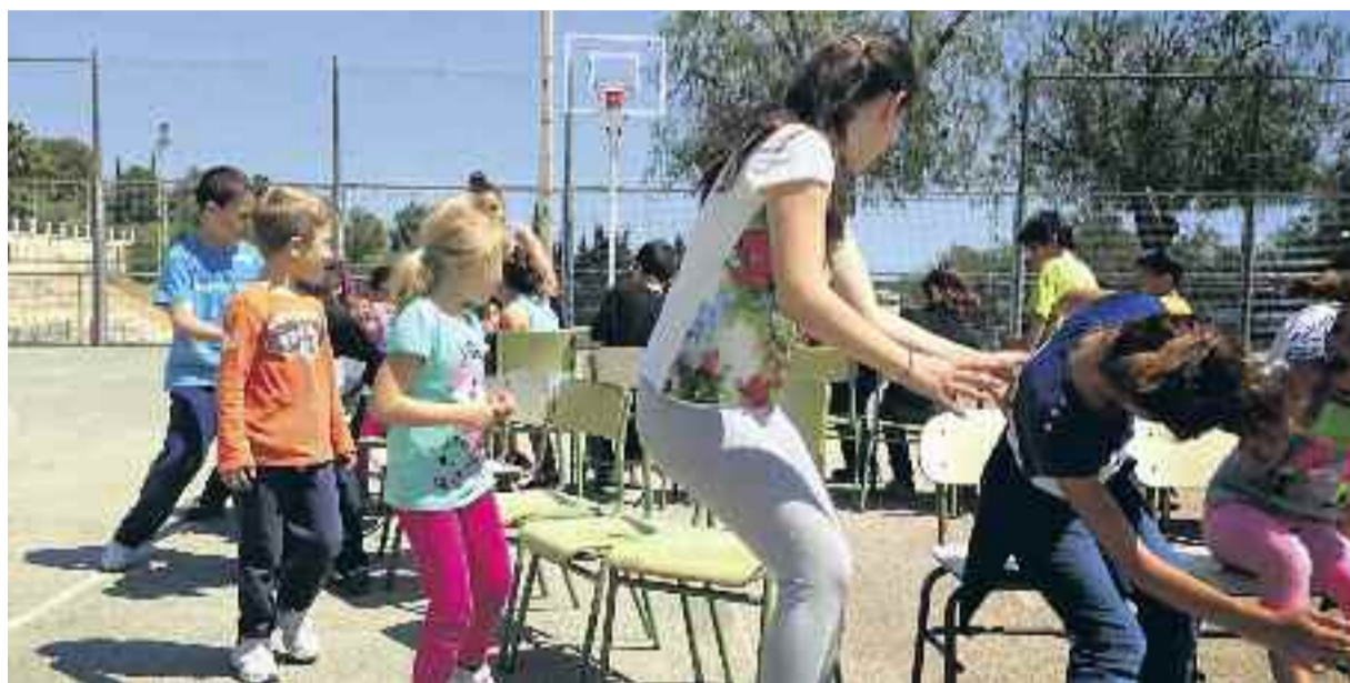
El joc del mocador, el joc de les cadires i el joc d'arrencar cebes són tres exemples de jocs tradicionals.