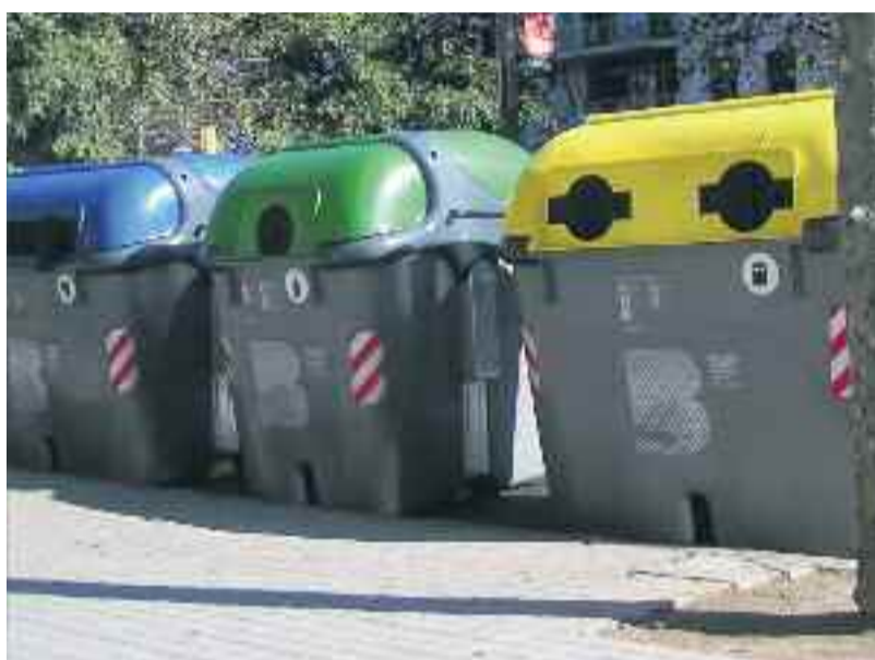
El Districte vol fomentar el civisme i la correcta convivència a Gràcia en tots els aspectes.