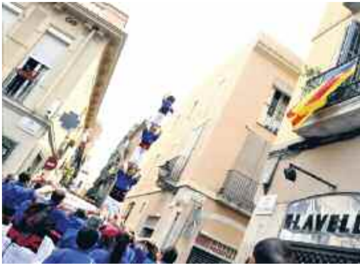
Els Castellers de la Vila de Gràcia durant la seva actuació.

La colla gracienc va aconseguir descarregar tres castells de la gamma alta de vuit i el pilar de sis. La ronda es va encetar amb un dos de vuit folrat, el mateix castell que els graciencs van descarregar per primera vegada en la mateixa actuació d'ara fa un any. A la segona ronda va arribar el torn del quatre de vuit amb l'agulla, que ja l'havien aconseguit carregar la setmana passada a Sant Cugat. Tot i les dificultats inicials per algun problema que va tenir l'estructura del quatre, a mesura que el castell va anar guanyant alçada es va poder redreçar. Després que l'enxaneta completés la càrrega, la descàrrega es va fer de forma molt neta i