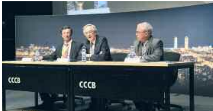
L'alcalde Trias va ser present a la clausura de les jornades.

Les Jornades de Comerç Urbà estan organitzades per la Federació d'Associacions de Comerciants Europees Vitrienes d'Europa, a través de la Fundació Barcelona Comerç, que és membre d'aquesta federació europea i representant del sector comercial barceloní. Durant dilluns i dimarts d'aquesta setmana, més de 300 representants del comerç