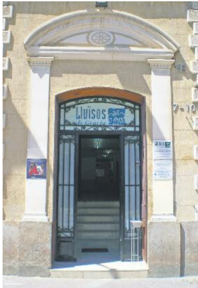
Els Lluïsos de Gràcia rebran una subvenció de 1.283 euros per remodelar el seu edifici.