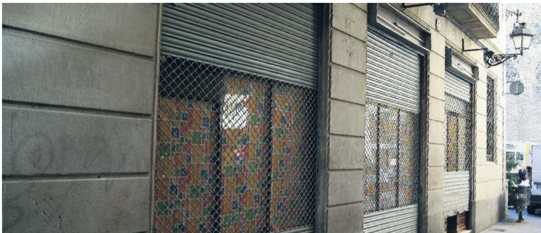
Molts comerços antics de la ciutat podrien patir el mateix destí que Juguines Monforte, que va tancar el passat gener.