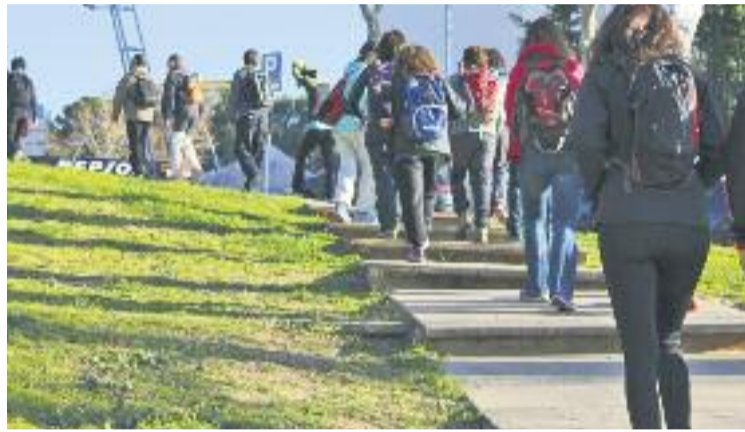
Els participants van ascendir a 7 turons de Barcelona.

D'aquí la competició va seguir fins al Tibidado, per baixar se-