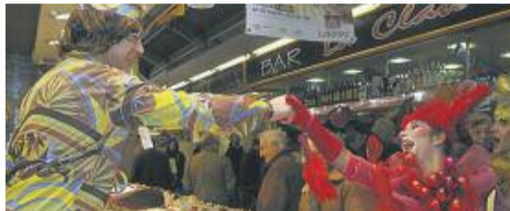
Els mercats graciencs han celebrat el Carnaval.

Per la seva banda, el Mercat de Lesseps va celebrar durant tot el cap de setmana un concurs de disfresses obert a tothom. La música tampoc no va faltar al Mercat de l'Estrella i al Mercat de l'Abaceria, on el passat dissabte va tenir lloc l'actuació del grup Bing Bang Valona i la passejada de la Rua Brasileira.