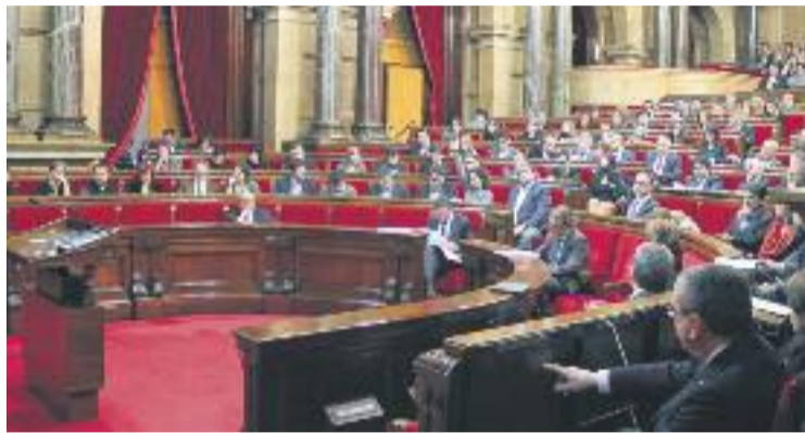
Aquesta llei va ser impulsada el març de l'any passat.

Des de la Confederació de Comerç de Catalunya s'ha valorat molt positivament aquesta nova llei, ja que "regula la situació creada pel recurs d'inconstitucionalitat del Govern espanyol", segons indica l'organització. Pel que fa a la Fundació Barcelona Comerç, l'aprovació d'aquesta nova normativa suposa "un punt i final al marc normatiu que ha de