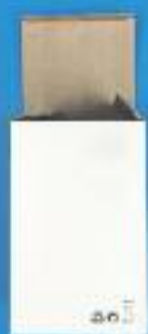
CAPSA DE CARTRÓ