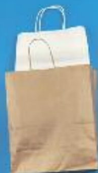
BOSSA DE PAPER