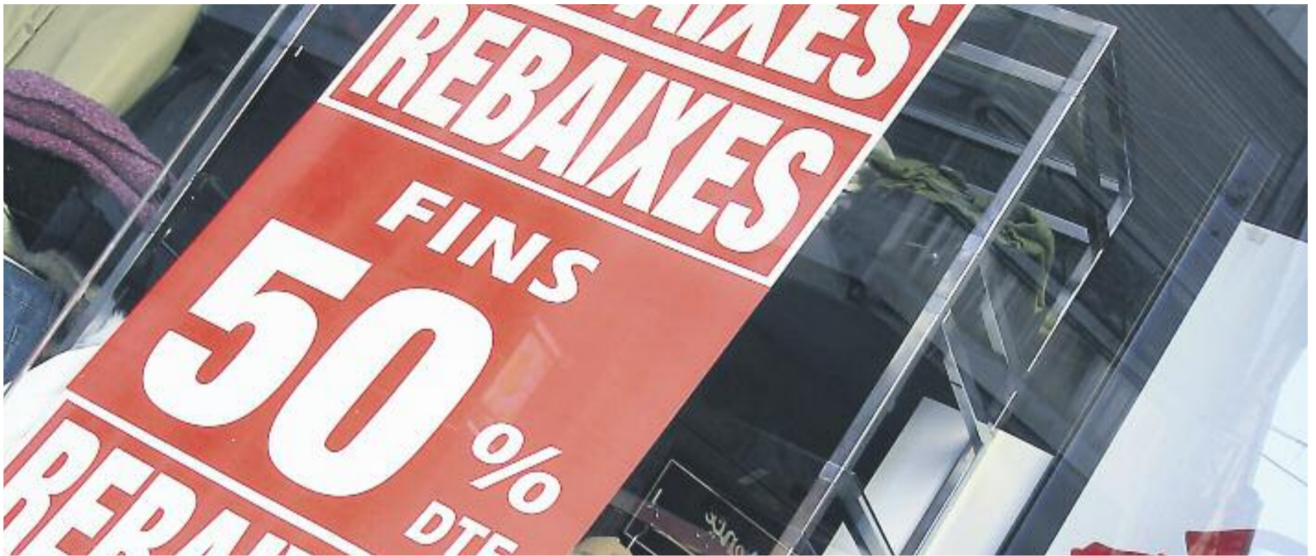
Les rebaixes d'enguany tindran descomptes de fins al 50 i el 70%.