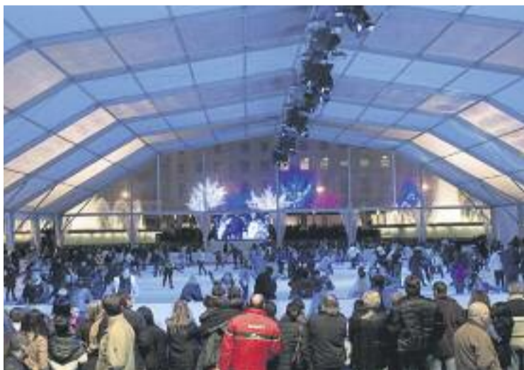
BarGelona registra 80.000 patinadors durant aquesta temporada.