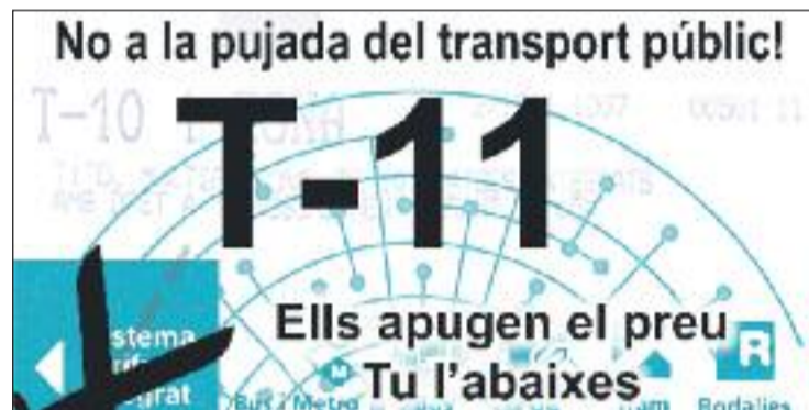
Imatge de la campanya T-11 de la FAVB.

Paral·lelament, la Federació d'Associacions de Veïns i Veïnes de Barcelona (FAVB) ha relançat la iniciativa de la T-11, que consisteix en cedir una T-10 esgotada a un altre viatger perquè aquest aprofiti el temps sobrant de l'últim trajecte. Segons els organitzadors, aquesta targeta fictícia podria generar més de 15.000 viatges gratuïts cada dia a l'àrea metropolitana.