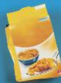
CAPSA DE CEREALS