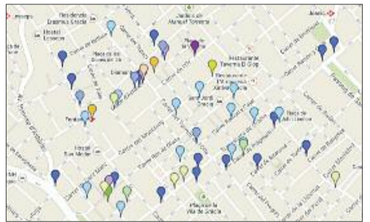
Mapa de comerços sostenibles de la Vila de Gràcia.

La guia de comerços està dirigida a consumidors i comerciants, i a més de contenir un registre sobre els comerços sostenibles del barri, dóna consells per fer un consum responsable amb el medi ambient.