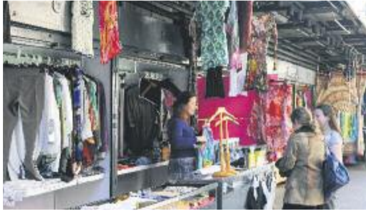
Els ajuntaments escolliran els dos nous festius d'obertura.

La tria d'aquests dos nous dies d'obertura quedaran en mans dels ajuntaments. "Està bé que hi hagi més festius oberts, però que es col·loquin en aque-