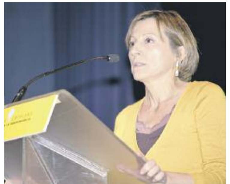
La presidenta de l'ANC, primera convidada a Lluïsos el 2014.

Forcadell és presidenta de l'ANC des del 2012 després d'una carrera dedicada al foment de la llengua des de diverses associacions com Òmnium Cultural i Plataforma per la Llengua i del seu pas per la política, ja que va ser regidora d'ERC a Sabadell entre 2003 i 2007.