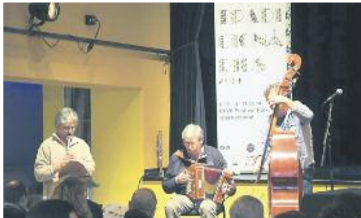
Els T.A.C. Trio, protagonistes del concert inaugural.

El primer tast va ser divendres amb el seguici inaugural que els