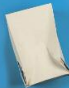
CAPSA DE SABATES

I TU, SI HAS DUBTAT, CONSULTA ENVASONVAS.CAT O DESCARREGA L'APLICACIÓ "RESIDUS"