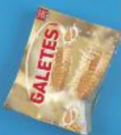
CAPSA DE GALETES