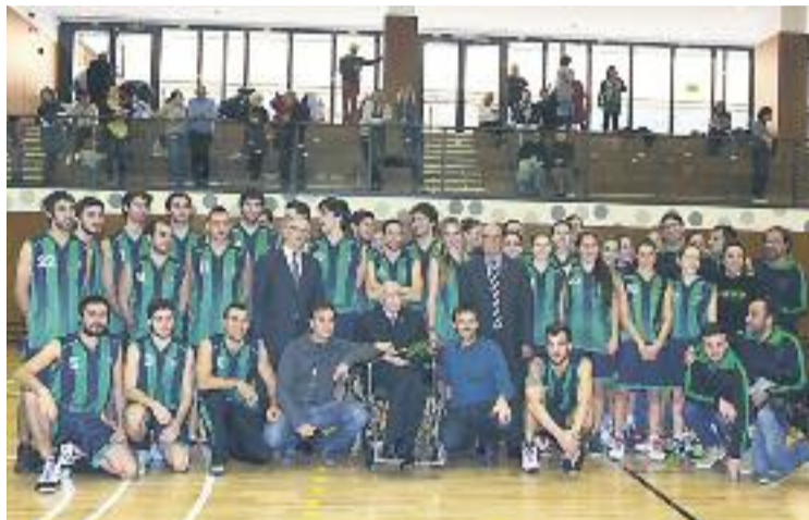
Acte de presentació de l'equipament.

Al centre esportiu es podran practicar bàsquet i voleibol, de manera reglada, i handbol i futbol sala, no reglats. També disposarà d'un programa de promoció de l'esport adreçat a la gent gran, a persones amb dis-