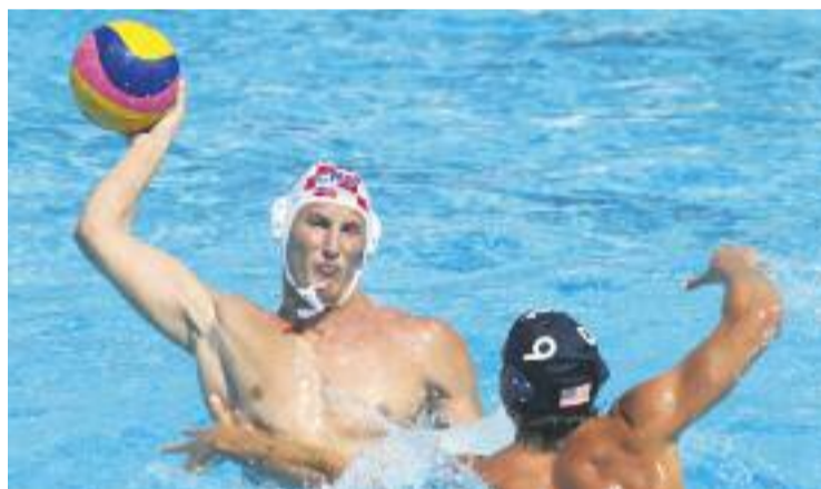
Moment d'un partit de waterpolo durant els Mundials.

WATERPOLO ▶ Barcelona es convertirà durant el 2014 i el 2015 en la seu de la Final Six LEN Champions League, la competició final de la Lliga europea de waterpolo masculí.