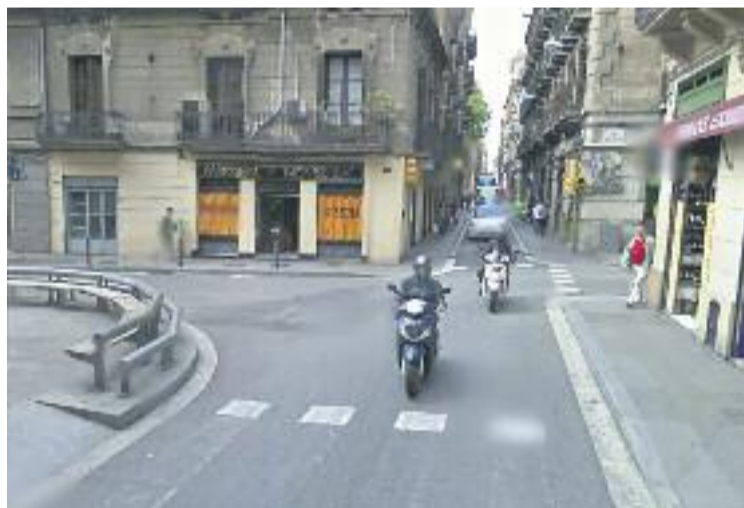
La cruïlla Travessera-Torrent de l'Olla.