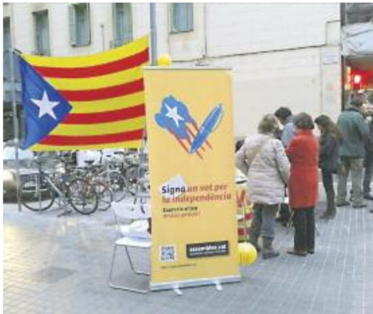
Parada a la Travessera amb Gran de Gràcia.

Al districte es van repartir pels diferents barris, tot i que la majoria es van concentrar a la Vila de Gràcia, entre les quals hi havia la de Plaça del Nord, una al costat de la parada de metro de Fontana, a la plaça Revolució i a la cruïlla de la Travessera amb Gran de Gràcia. També els veïns del Coll van poder votar per la independència al Parc de la Creueta, els de Camp d'en Gras-