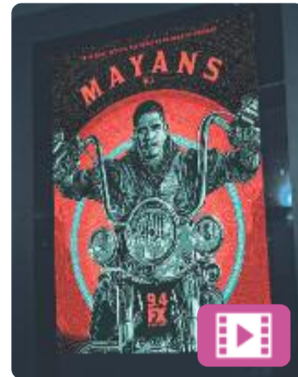
Mayans MC Kurt Sutter

Els bikers tornen a tenir una sèrie de referència. Aquest spin-off de la popular Sons of Anarchy situa el focus en un altre club de moters, els Mayans, que controlen bona part del narcotràfic d'heroïna a la zona fronterera entre els Estats Units i Mèxic. El seu protagonista és EZ, un jove prospecte que aspira a ser membre de ple dret del club.