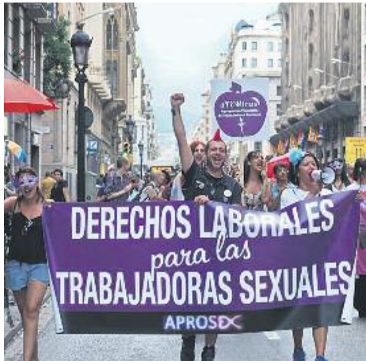
A l'esquerra, una manifestació a favor dels drets de les prostitutes. A la dreta, un cartell contra la prostitució a Gavà.