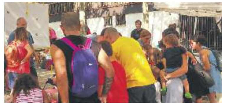
Taller de titelles a la Festa Major de la Salut.

CELEBRACIÓ ▶ Els barris de Vallcarca i la Salut es van acomiadar diumenge i dimarts, respectivament, de les seves Festes Majors després que totes dues es posessin en marxa dijous passat.