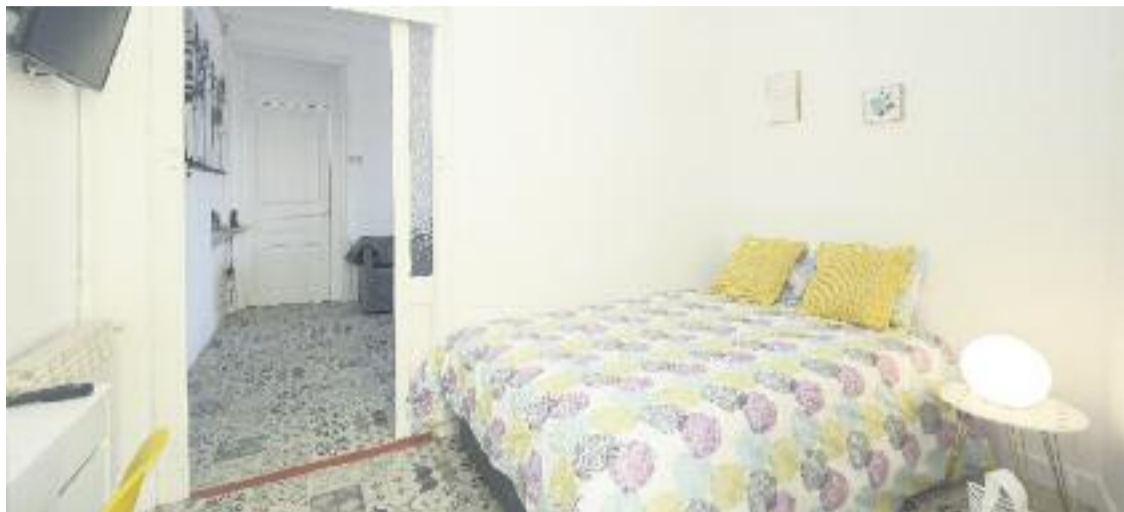
El preu de les habitacions de lloguer ha augmentat més d'un 13% durant l'últim any.

HABITATGE ▶ 577 euros. Aquest és el preu mitjà, segons un estudi acabat de publicar pel portal immobiliari Fotocasa, d'una habitació de lloguer a Gràcia. Això converteix Gràcia en el districte més car de Barcelona, i de qualsevol ciutat de l'Estat, pel que fa al mercat de lloguer d'habitacions.