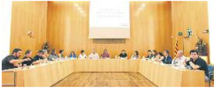
El Ple de dijous que ve debatrà les possibles retallades.

La sessió arriba després que al juliol es conegués un document intern de l'Ajuntament on es contempla una retallada de 107 milions a la ciutat, dels quals 8,1 serien a les Corts. Si es confirmés la retallada, significaria que el Districte patiria una reducció del 40% de la inversió, ja que la partida estipulada és de 20,4 milions.