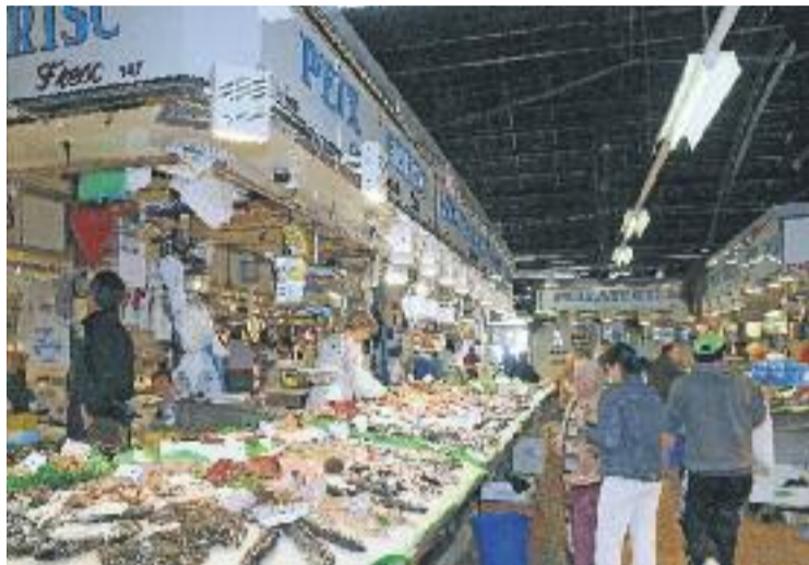
El mercat de l'Abaceria es remodelarà d'aquí a uns mesos.

"Des de l'Ajuntament ens van dir que ens donarien l'opció de triar i, tot i que volem esperar a la reunió d'avui per resoldre dubtes que tenim, creiem que pot ser millor opció que l'enderroc es faci després de Nadal", afirma a Línia