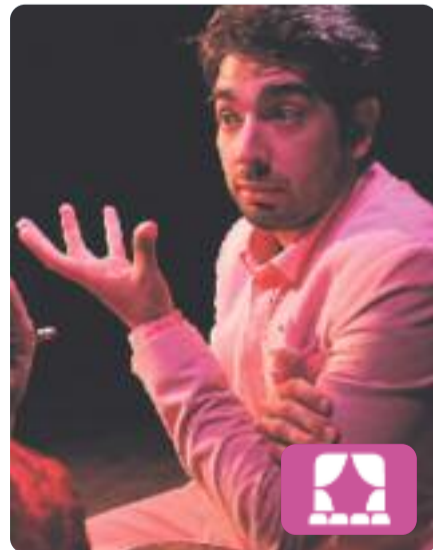
Les roses de la vida Sergi Belbel

Una de les comèdies revelació de la temporada. Quatre intèrprets i un gos juguen constantment amb el surrealisme i fan tota mena de piruetes lingüístiques per fer aquesta bretolada que vol celebrar la vida i fer un cant al sexe, a l'amor, als plaers i vol transmetre als espectadors el goig de viure.