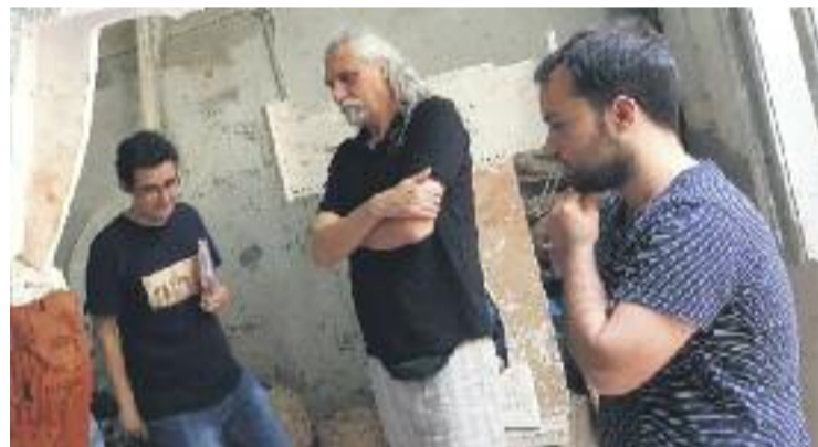
Una imatge del procés de creació de l'Àliga de Gràcia.

CULTURA POPULAR ▶ Una de les novetats més esperades de la Festa Major d'aquest any serà l'estrena d'una nova figura.