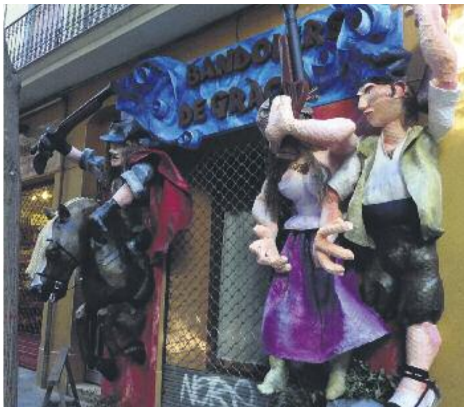
A l'esquerra, la presentació de l'edició d'enguany de la Festa Major. A la dreta, un guarnit del concurs de balcons, portalades i aparadors de l'any passat.