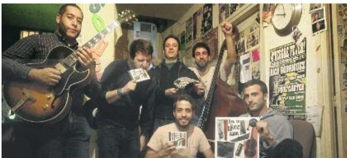
El grup Soweto actuarà dissabte 17 d'agost al carrer Sant Pere Màrtir.

El tercer escenari s'ubicarà a la plaça del Nord i comptarà