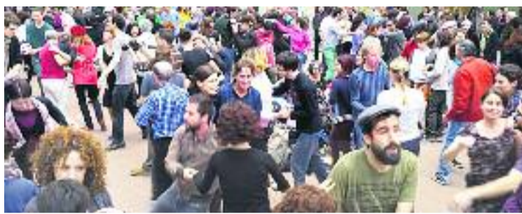
Diamant tonarà a ser la plaça del Swing.

Aquest any, la principal novetat serà la plaça de la Revolució, que es convertirà en "La Revolució de la Ciència". L'espai estarà dedicat a la divulgació científica per a tots els públics, on també es consoliden les activitats inclusives i de col·laboració amb els Ateneus de Fabricació. Un dels nous espectacles que es faran a la mateixa plaça seran les activitats d'humor. També es consolida la col·laboració amb els equipaments de Gràcia. Per exemple, les biblioteques del Districte tornaran a cedir els llibres descatalogats de les seves col·leccions.