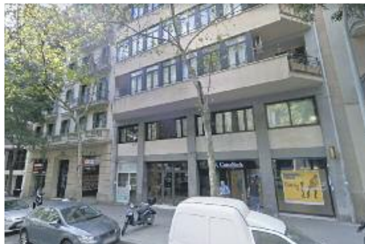
Exterior dels dos blocs que comparteixen el celobert.

La policia investiga ara com hauria mort la nena, però tot apunta que es tractaria d'un homicidi per la manera de desfer-se del cos. Els edificis dels números 229 i 231, especialment aquest últim, tenen molts habitatges. Tot i que no tots tenen accés al celobert, la hipòtesi dels Mossos és que algú hauria tirat el nadó des d'una finestra d'aquests dos blocs. Tot i això, també es pot accedir al celobert des del terrat dels dos blocs, que són a tocar d'altres terrats dels edificis de l'illa.