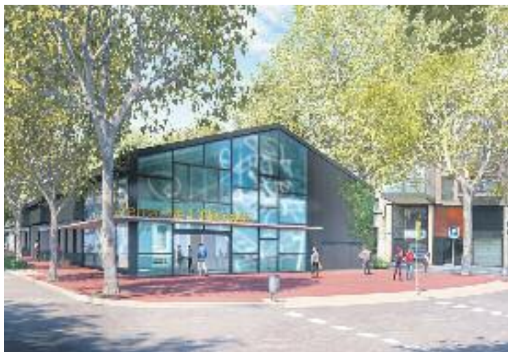
Imatge virtual de la carpa provisional.

"Som a mitjans de juny i la carpa està com està. Sincerament, crec que és impossible que d'aquí a un mes es pugui fer el trasllat", afirma un dels paradistes del mercat a aquesta publicació. Aquest mateix paradista creu que el trasllat pot acabar havent-se de fer a l'agost, un mes que descriu com a "complicat perquè la gent vol fer vacances". En la mateixa línia es mou una altra paradista, que afirma que "ens han posat tants terminis i ens han dit tantes coses que, sincerament, tam-