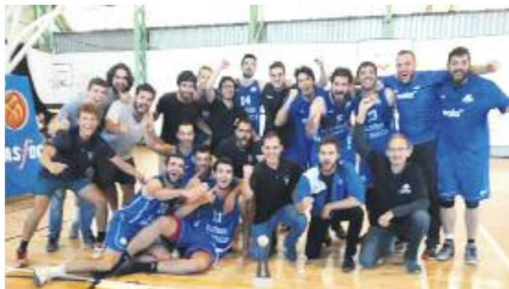
Els blaus, eufòrics després d'aconseguir l'ascens.