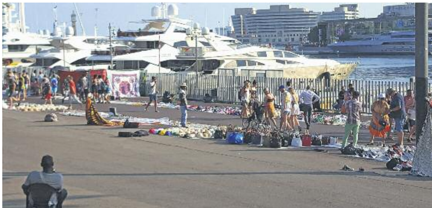
La venda ambulat il·legal, diuen els comerciants, ha augmentat en els últims anys.

Les entitats firmants del text també van voler deixar clar que les seves queixes es dirigeixen cap a l'Ajuntament, per la seva “in- suficient” resposta envers aquest fenomen, i no cap als venedors del Top Manta. La denúncia, va afirmar Villar, és contra l'activi-