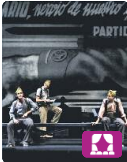
In memoriam Lluís Pasqual

La Kompanyia Lliure torna a representar un retrat fidel i realista de la Batalla de l'Ebre, quan milers de joves de 17 i 18 anys van ser cridats a files per protagonitzar una de les batalles més llargues i cruentes de la Guerra Civil. Un homenatge als nois de la generació de la Quinta del Biberó.