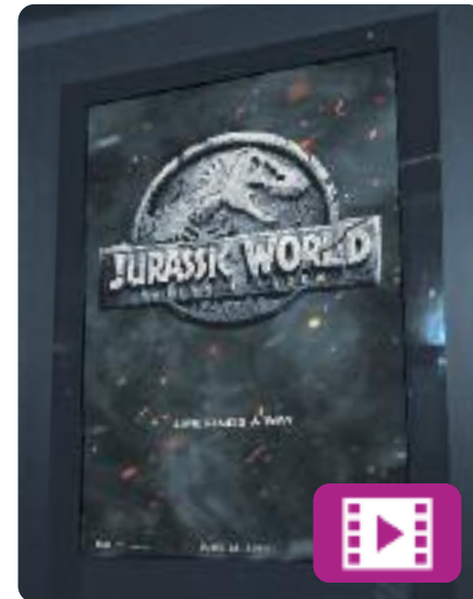
Jurassic World: el regne caigut Juan Antonio Bayona

El director barceloní Juan Antonio Bayona dirigeix l'última entrega de la popular saga de pel·lícules de dinosaures. En aquesta entrega, una erupció volcànica amenaça els dinosaures restants a l'illa Nublar, on les criatures han vagat lliurement durant anys després de la desaparició del parc temàtic Jurassic World .