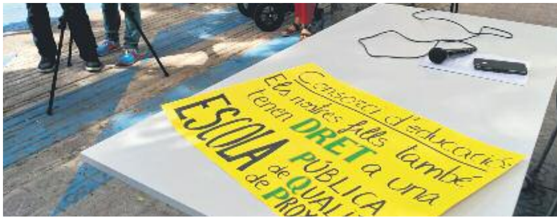
La comunitat educativa fa mesos que es mobilitza per demanar més places d'escola pública.

» La comunitat educativa parla de "planificació negligent" » 19 famílies de la Vila rebutgen les places que se'ls ha assignat