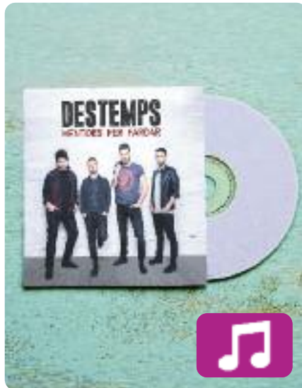
Mentides per fardar Destemps

Guitarres descarades, lletres de carrer i melodies addictives. En tres paraules, rock and roll. Això és Mentides per fardar (RGB Suports, 2018), el primer disc d'estudi de Destemps.