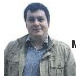
Miguel Raposo Conseller del PP al districte de Gràcia