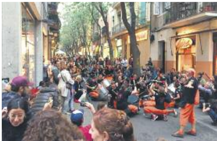
El comerç i la cultura van omplir els carrers.

D'aquesta manera, el passat dia 5 botiguers i veïns van desafiar la pluja per gaudir d'un dia intens de comerç a l'aire lliure. "La pluja va evitar que la jornada fos com ens hauria agradat, però malgrat això les sensacions són positives", explica la