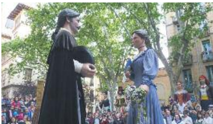
Els gegants Pau i Llibertat.

CULTURA POPULAR ▶ Els Gegants de Gràcia van celebrar dissabte passat la seva trobada anual. Aquest any, però, la jornada tenia un caràcter especial, ja que se celebrava el 25è aniversari dels gegants Pau i Llibertat.