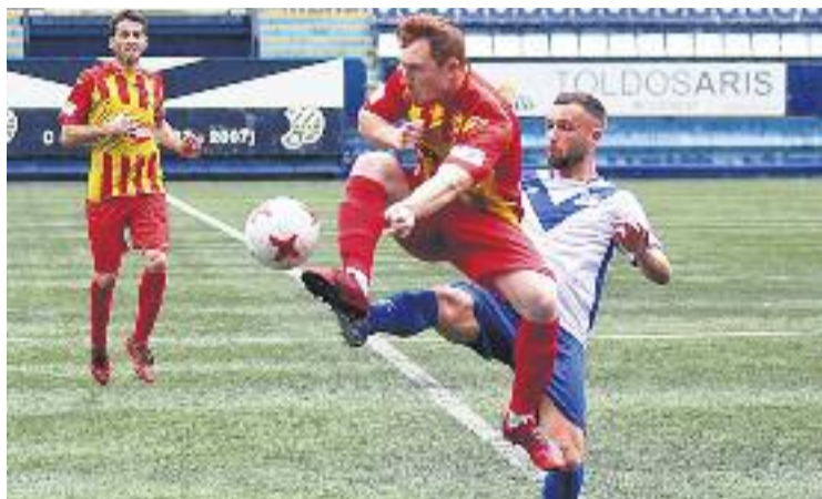
Un moment del darrer partit del curs a casa.

L'enfrontament contra els penedesencs va ser un xoc d'alt voltatge entre dos equips que durant tota la temporada han ocupat posicions de la meitat alta de la taula. El Vilafranca va ser el primer que va colpejar, amb