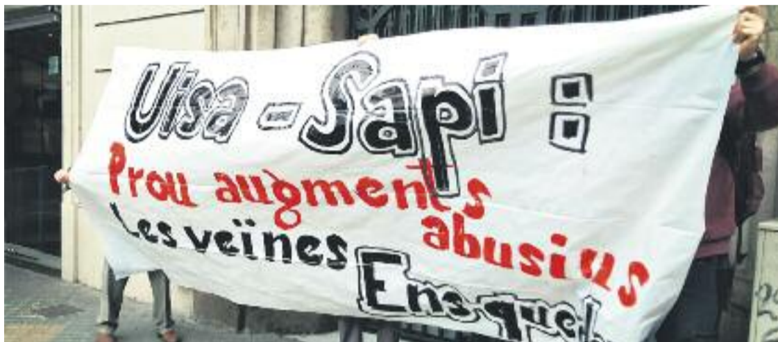
Una imatge de la protesta celebrada abans-d'ahir.

» L'Oficina de l'Habitatge de Gràcia participa en una protesta contra una immobiliària, acció prèvia a la manifestació de dissabte