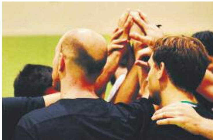
L'equip afronta el tram decisiu de la lliga en el seu millor moment.

I és que, en aquests últims enfrontaments, l'equip ha anotat 108, 104, 91 i 81 punts, respecti-