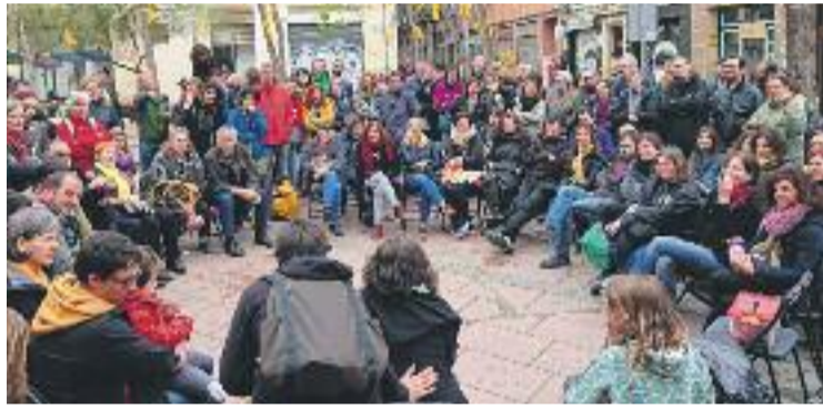
Un moment de la jornada commemorativa de dissabte.