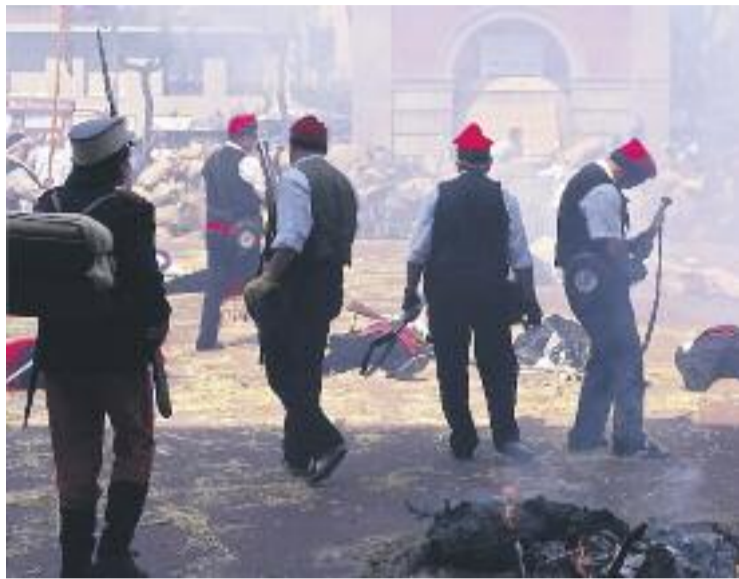
Una imatge de l'edició de l'any passat.

Concretament, a partir de la una del migdia es representarà a la plaça de la Vila un dels moments culminants d'aquell motí. Va ser el moment en què un grup de dones va assaltar l'Ajuntament per impedir el sorteig de la lleva. Van cremar-ne tots els papers al mig de la plaça i van fer sonar la campana tocant a sometent. D'aquesta manera