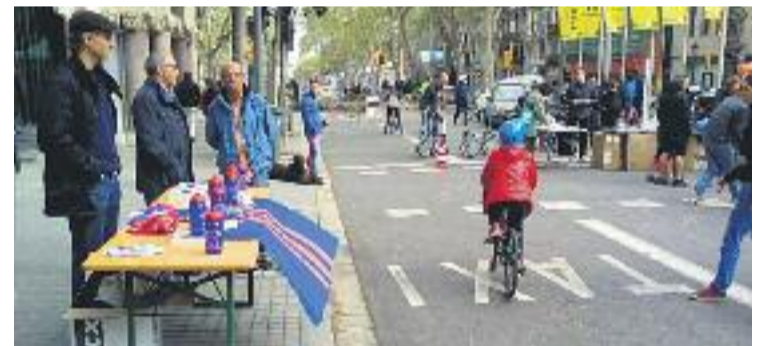
El Club Ciclista Gràcia va participar en la jornada de Gran de Gràcia.

MOBILITAT ▶ El carrer Gran de Gràcia va acollir dissabte passat una jornada dedicada al món de la bicicleta. Aprofitant el tall de carrer de cada primer dissabte de mes, es van celebrar tot un seguit d'activitats.