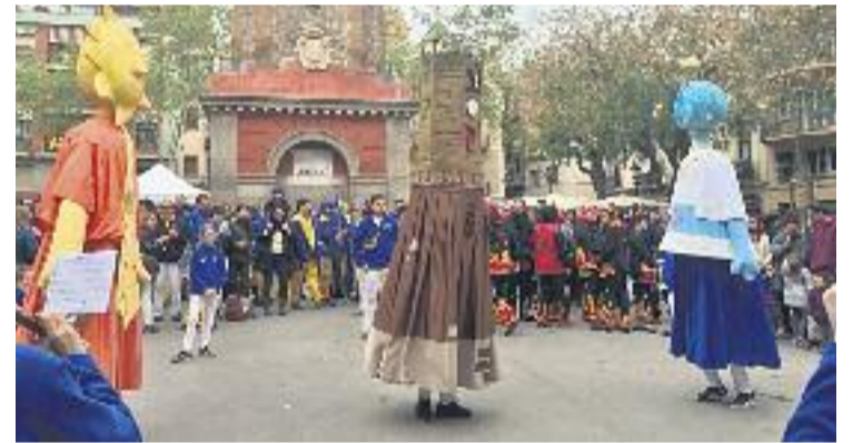
Els gegants de Gràcia no van fallar a la cita.

Per últim, l'endemà estava prevista la celebració de la diada castellera de la Independència però es va haver de suspendre a causa de la pluja.