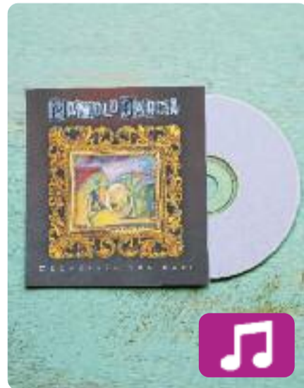
Geometría del rayo Manolo García

El 16 de març va ser la data escollida per Manolo García per al llançament del seu setè disc en solitari, Geometría del rayo (Sony Music, 2018).