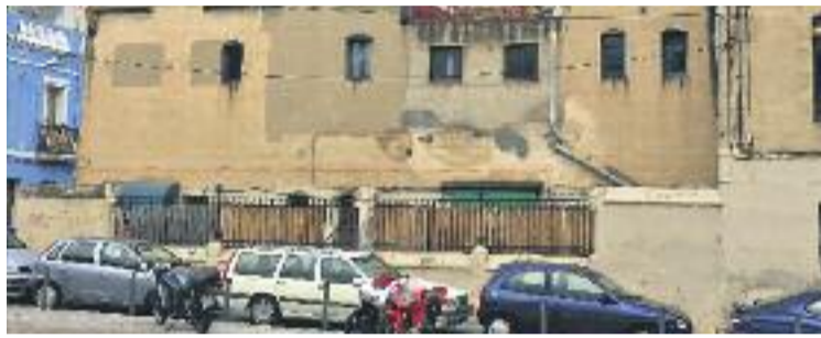
Vallcarca fa anys que espera la seva reforma urbanística.

El suport polític a aquest projecte, promogut pels veïns i per la proposta guanyadora del concurs d'idees convocat per la Mesa de Treball d'Urbanisme de Vallcarca, va ser, però, limitat durant la votació en comissió. Hi van votar a favor Barcelona En Comú, la CUP i el regidor no adscrit Gerard Ardanuy. La resta de formacions es van abstenir. Per superar aquest primer tràmit n'hi va haver prou amb aquests su-