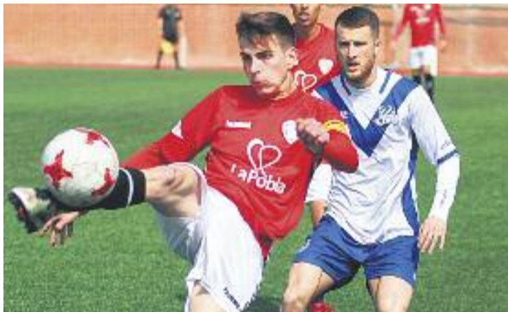
Una imatge del partit contra la Pobla.