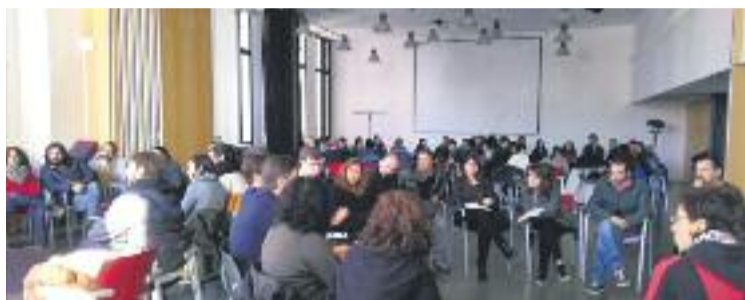
Imatge de l'assemblea feta a la Fontana.

Així doncs, el Sindicat de Llogaters busca promoure una mena d'insubmissió contra el que considera que són situacions injustes i proposa, per exemple, que els afectats no tornin de primeres les claus a l'administrador de la fin-