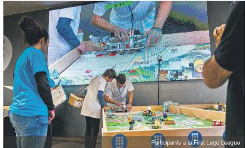
Participants a la First Lego League

Hi ha diferents premis i guardons per als concursants de les diferents fases. Aigües de Barcelona hi col·labora amb el guardó 1r premi al Projecte Científic com a agent coneixedor i impulsor de la gestió eficient del cicle integral de l'aigua. També