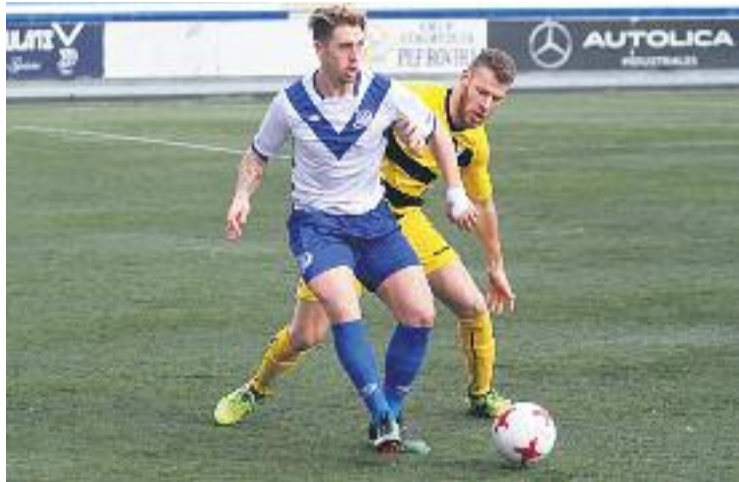
Raillo, en un partit recent.

Aquestes dues derrotes, però, no descarten, ni de bon tros, els escapulats en la lluita per optar a cloure el curs entre els quatre primers. De fet, ara mateix l'equip suma 41 punts (els mateixos que Pobla i Ascó), només quatre menys que el Sant Andreu, l'últim dels conjunts que optaria a l'ascens a Segona B, i només sis menys que el tercer, l'AE Prat. La segona plaça, que ocupa l'Hospi,