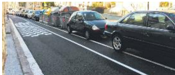
Els veïns diuen que el carril bici no es fa servir.

MOBILITAT ▶ El nou carril bici de l'avinguda de Vallcarca ha provocat polèmica abans d'entrar en funcionament de forma oficial. Un grup de veïns han posat en marxa una campanya de recollida de firmes per demanar a l'Ajuntament que l'elimini.