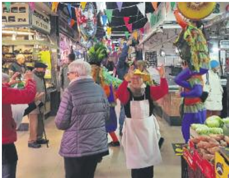
Una imatge de la celebració del Carnaval a l'Abaceria.

Dos dies més tard, el dissabte dia 10, el Carnaval va continuar. Els botiguers es van