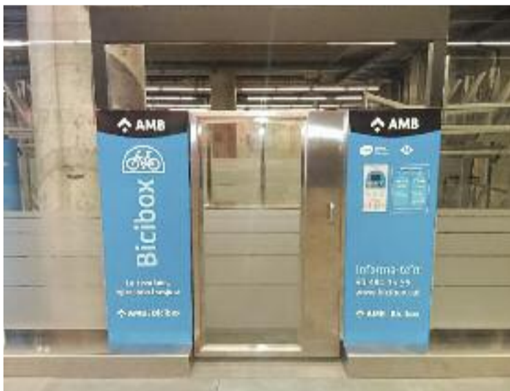
S'ha instal·lat a l'estació del Parc Logístic de la Zona Franca.