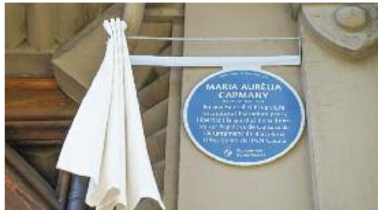
La placa està situada al 65 de la Rambla de Catalunya.