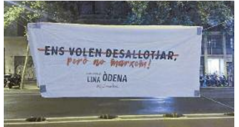
Pancarta en defensa de la continuïtat del casal.

En aquest sentit, el coordinador recorda que el Camí Amic és “una entitat d'entitats” i que, per tant, va de la mà d'altres organitzacions i dels centres educatius per arribar fins al model de ciutat que volen. I sembla que van pel bon camí.