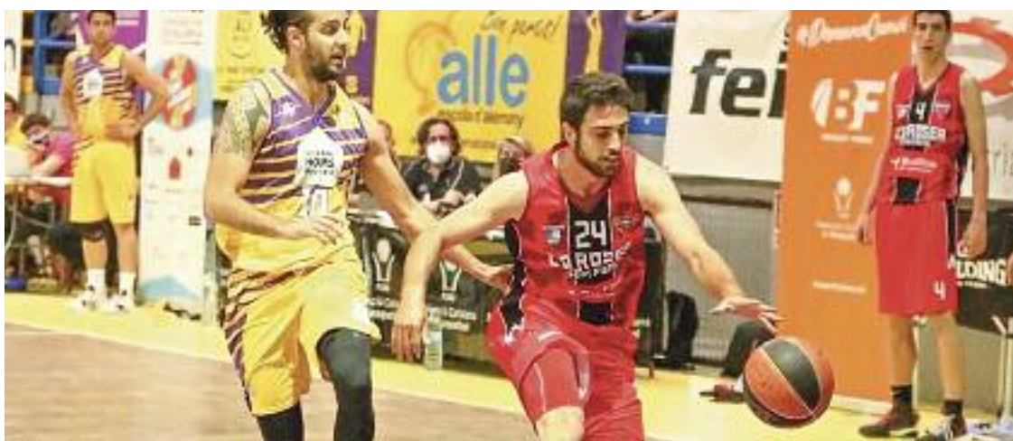
L'equip és el vigent campió de la Lliga Catalana EBA.

derbi contra la UE Horta, mentre que el final de la primera volta també serà l'últim partit d'aquest 2021, amb l'equip rebent l'Es Castell. La visita a aquesta loca-