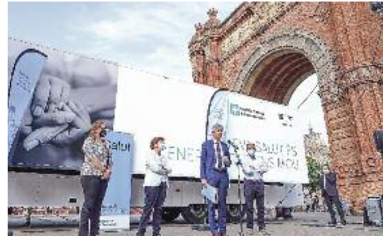
El conseller Argimon, al punt de vacunació.

El punt de vacunació va estar obert fins divendres. Durant els seus tres dies de funcionament hi van treballar dues infermeres, un tècnic i dos administratius i cada dia es van subministrar al voltant d'un miler de vacunes.