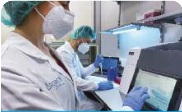
La PCR Variant es troba a disposició del pacient a les clíniques de Cetir Ascires i com a kit per a hospitals i centres de salut

Barcelona, 8 de juliol de 2021. - Un nou test genètic permet identificar fins a cinc possibles variants del SARS-CoV-2 inicial originat a la Xina. Són les variants del coronavirus de major impacte en la salut pública: alfa, beta, gamma, delta i delta plus (conegudes també com a britànica, sud-africana, brasilera i índies, respectivament). Es tracta de la nova PCR Variant d'Ascires Sistemas Genómicos, laboratori del grup biomèdic del qual forma part la catalana Cetir. Mitjançant aquesta PCR, es duu a terme un genotipatge de la mostra positiva per coronavirus per identificar alguna d'aquestes cinc variants com a agents causants de la infecció.