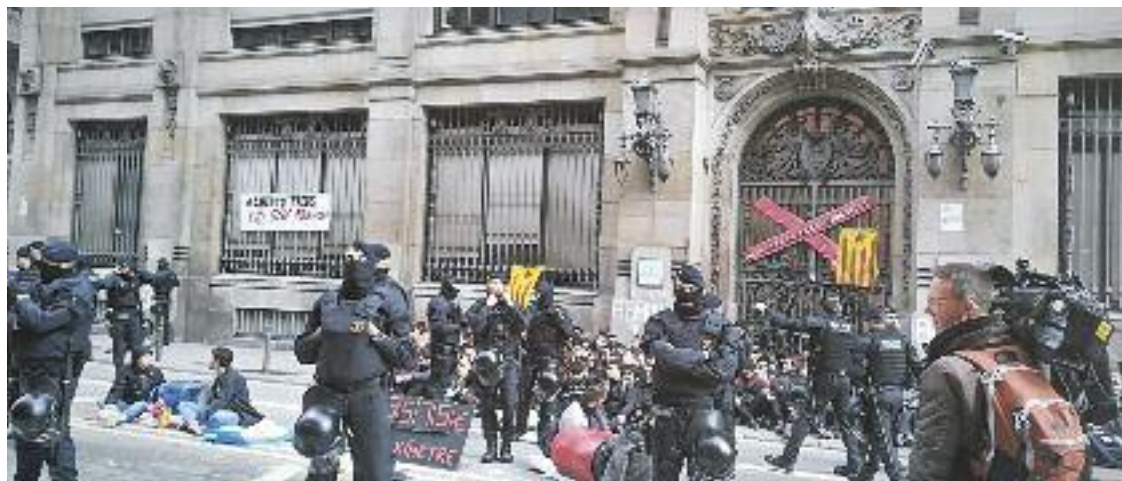
La protesta del 15 de març de 2018 a la Secretaria d'Universitats i Recerca.