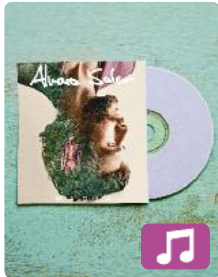
Magia Álvaro Soler

El cantant barceloní Álvaro Soler publica el seu tercer àlbum d'estudi: Magia (Universal Music). Es tracta d'un treball discogràfic en el qual s'ha "deixat la pell", tal com ha afirmat en una entrevista a la Cadena 100 . L'autor d'èxits estiuencs com Bajo el mismo sol o Sofía presenta ara tretze noves cançons, entre les quals hi ha una col·laboració amb Cali y El Dandee.