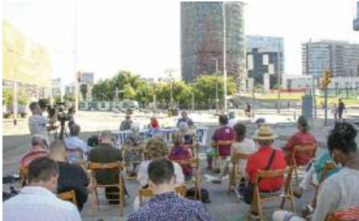
Les entitats volen reunir-se amb l'alcalde Colau.

Membres del moviment veïnal van recordar que aquestes reivindicacions venen de lluny, que sempre han reclamat "un gran parc públic de lloguer a les Glòries" i, a més, van recordar que fa anys que se'n parla des de l'Ajuntament. Tot i això,