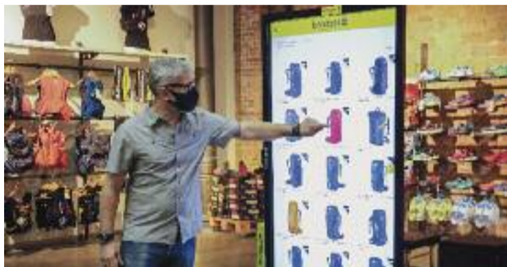
Una de les pantalles instal·lades en un dels comerços.

"Amb aquest sistema d'intel·ligència artificial s'analitza el