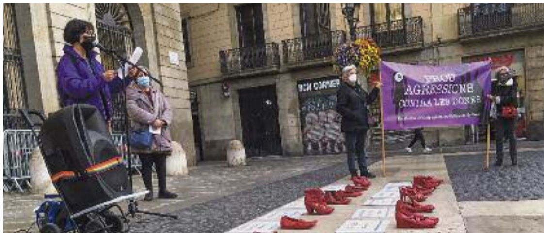
Una acció de la Plataforma Contra les Violències de Gènere a la plaça de Sant Jaume.

La violència masclista no s'atura. Vuit dones han estat assassinades a l'Estat des de principis d'any, dues d'elles a Catalunya. "Sortim cada tercer dilluns de mes contra