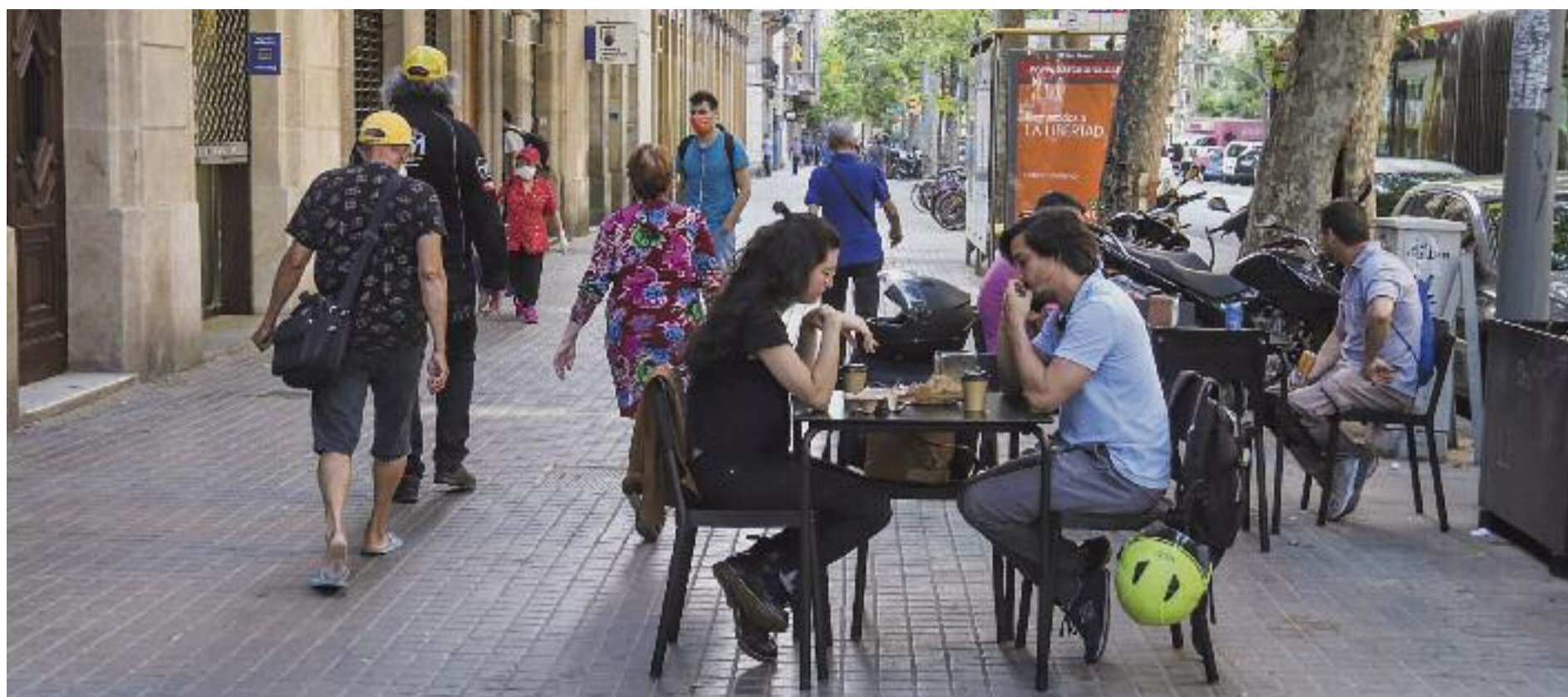
Una terrassa d'un bar de la ronda Sant Antoni.