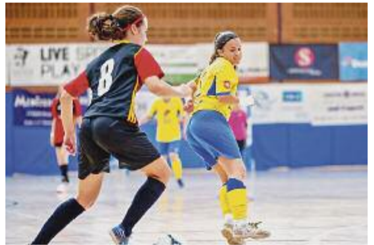
L'equip ha de guanyar i esperar que l'AE les Corts punxi.

L'alegria per al CFSE el cap de setmana passat arribaria per part del sènior masculí, guanyador del derbi a la pista del Bosco Rocafort (2-4). El triomf fa que els dos conjunts estiguin empatats a 11 punts, però amb el CFSE fora del descens i el Bosco en la posició de promoció. Els dos equips jugaran a domicili aquest cap de setmana; el CFSE a la pista del Montsant i el Bosco a Gràcia.