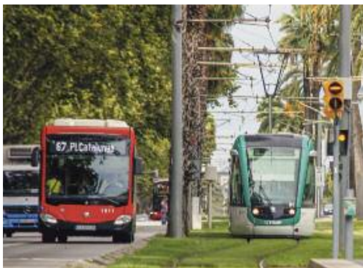
Un autobús i el Tramvia circulant junts.

Tot i la sorpresa, l'associació veïnal ho valora positivament. "Si no suposa la supressió de cap altra línia, i això dura fins que