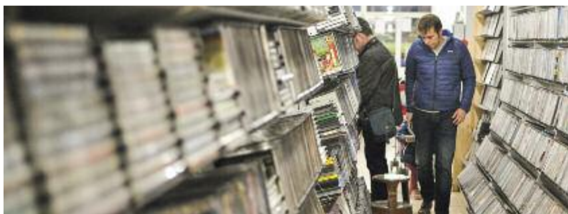
Video Instan està situat al número 239 del carrer Viladomat.

Però encara hi ha més: des del 2018, quan Depares es va traslladar del número 30 d'Enric Granados al 239 de Viladomat, l'establiment té també amb una sala de cinema privada i una cafeteria. En temps de coronavirus, llogar la sala s'ha convertit en la millor manera d'anar al cinema amb tota la seguretat, i així ho han fet moltes famílies, parelles i grups reduïts d'amics (el màxim és de catorze persones). D'altra banda, la botiga ha continuat acollint presentacions de pel·lícules i col·loquis.