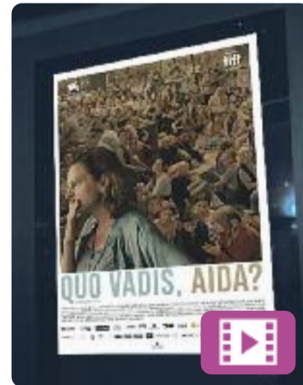
Quo Vadis, Aida? Jasmila Zbanic

Bòsnia, juliol de 1995. L'Aida treballa com a traductora per a l'ONU a una petita ciutat, Srebrenica. Quan l'exèrcit serbi l'ocupa, la seva família es troba entre els milers de persones que busquen refugi als camps de l'ONU. I, en aquest sentit, l'Aida té accés a informació important. Aquest film va estar nominat a millor pel·lícula internacional als Oscars del 2020.