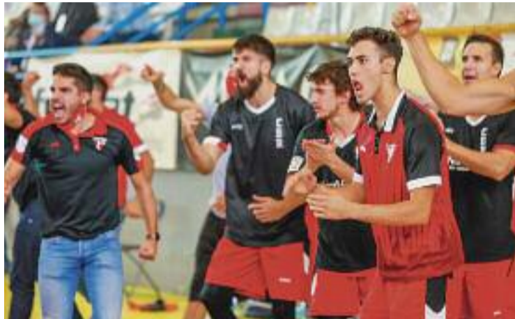
La temporada, ara sí, encara el seu últim partit.