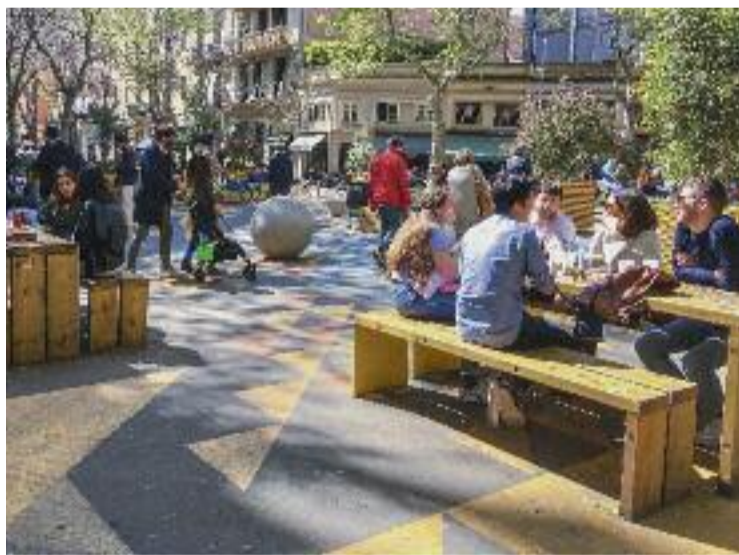
La superilla, en una imatge d'arxiu.

L'estudi també ha analitzat altres variables, com ara l'ús dels es-