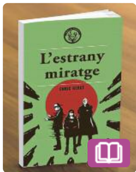
L'estrany miratge Enric Herce

Una recompensa anònima ofereix una quantitat obscena de diners a canvi dels assassins de l'hereu de la megacorp Holloway-Ikeda. La Duna i la Lorelei, autores del crim, podrien sospitar que qui ha posat preu als seus caps són els pares del difunt, si no fos perquè ells mateixos les van contractar per eliminar-lo. Una història d'intriga en un món ara real i virtual.