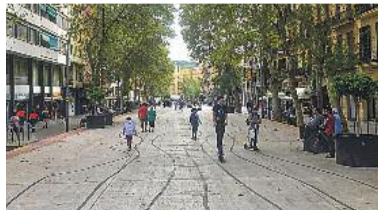
La Ronda de Sant Antoni espera la seva reforma.

manca d'espais pensats per aquest col·lectiu", i que és més utilitzat per la gent gran i famílies amb criatures, tot i que aquests últims perceben el pas de vehicles amb inseguretat. "Són espais que afavoreixen la socialització i donen una major tranquil·litat", apuntava l'experta.