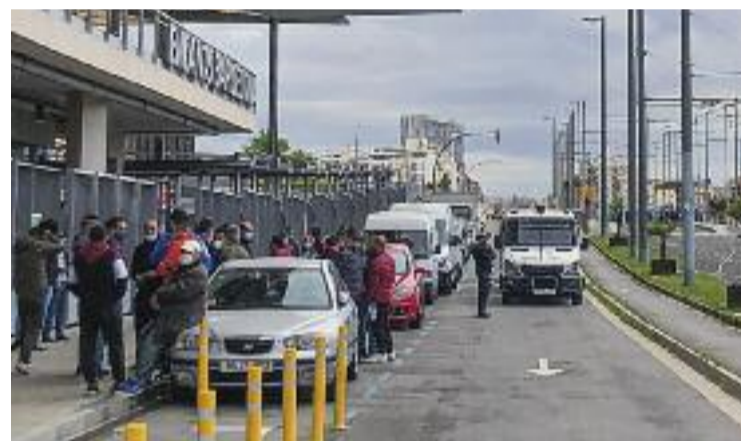
Els Encants, tancats per una inspecció de treball.

Fonts de la Generalitat van confirmar a Línia Eixample que la inspecció era de l'Estat, des del Ministeri de Treball. Posteriorment, des del mateix ministeri van explicar a aquesta publicació que l'actuació estava relacionada amb "l'economia irregular".