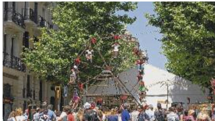
Imatge d'arxiu de la Festa Major de l'any 2019.

Ara per ara, l'objectiu és validar aquest model i ampliar-lo a 2.500 botigues de la ciutat en dos anys. "Volem que el comerç sigui competitiu davant les plataformes electròniques", defensava Jaume Collboni, primer tinent d'alcalde, en la presentació de la prova.