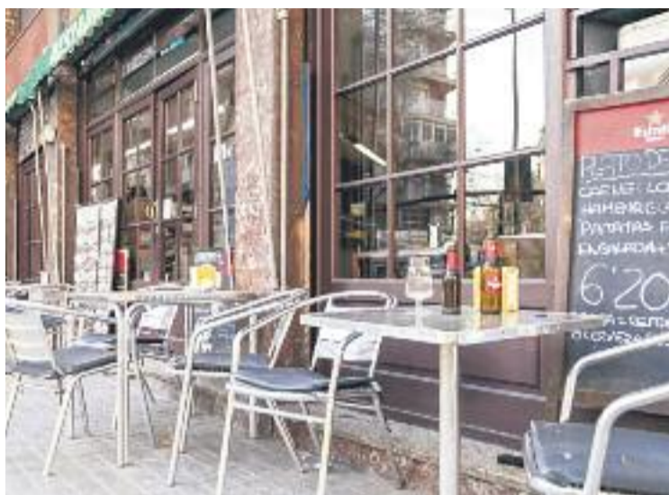
El Districte creu que a Sant Antoni hi ha massa bars i restaurants.

Així doncs, la nova regulació delimita una zona de protecció formada pel triangle que va des de la plaça Espanya, fins a les illes de cases que hi ha per sota de la Gran Via de les Corts Catalanes i fins al Paral·lel. La zona de protecció s'acaba a la ronda de Sant Antoni i Sant Pau, just on comença Ciutat Vella, on ja hi ha vigent un altre Pla d'Usos. També es fixaran límits de densitat i distància dels locals i de l'amplada del carrer. Per exemple, els nous locals de restauració no podran obrir si n'hi ha cinc més d'aquest tipus en un radi de 50 metres.