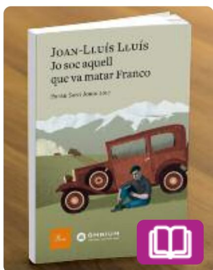
Jo sóc aquell que va matar Franco Joan-Lluís Lluís

La novel·la guanyadora del Premi Sant Jordi juga amb el passat per imaginar un present diferent.