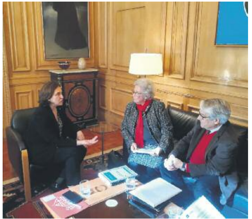
La situació del mercat immobiliari és una de les preocupacions que la Síndica ha exposat a l'alcalde Colau.