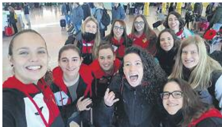
L'equip és una pinya i els resultats acompanyen.

I és que després de patir una derrota a casa contra el líder, el Palau (2-3, a finals de gener), l'Eixample ha tornat a recuperar la velocitat de creuer i l'únic partit que no va saldar-se amb una victòria va ser l'empat a Sant Vicent del Raspeig (2-2). El Sabadell (3-0) i el Xaloc Alacant (3-2) han estat les darreres víctimes de l'equip, que en la penúltima setmana del mes també afronta la tercera ronda de la Copa Catalunya al camp del Poble-sec (el di-