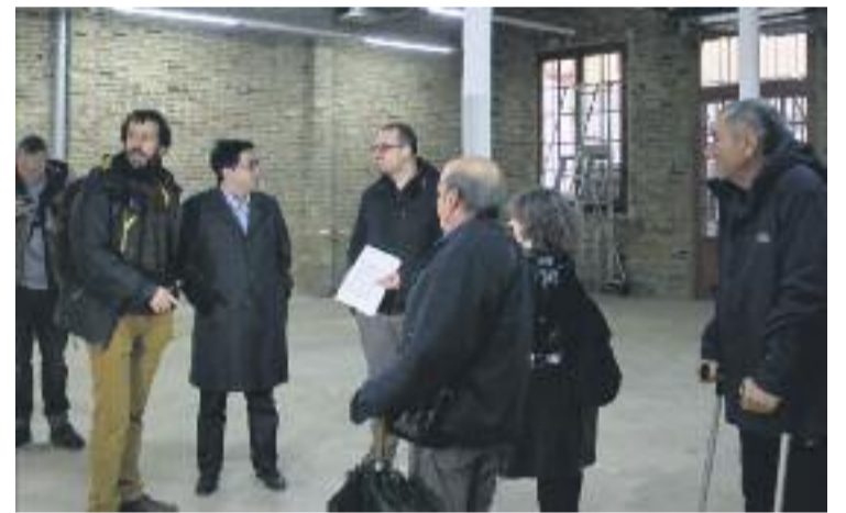
Les entitats van visitar fa poc el futur ateneu.

mesos- el nou ateneu tindrà tres espais diferenciats. A tocar de l'entrada hi haurà els espais d'exposicions, l'espai social, l'espai multimèdia, el d'administració i una àrea d'estada que els connectarà. En la franja central hi haurà els serveis i dos patis que donaran llum natural al local. I finalment, a la zona posterior, es construiran l'auditori, dues aules, tres bucs d'assaig, la zona de camerinos i un magatzem per a instruments musicals. També hi haurà un subterrani que funcionarà com magatzem.