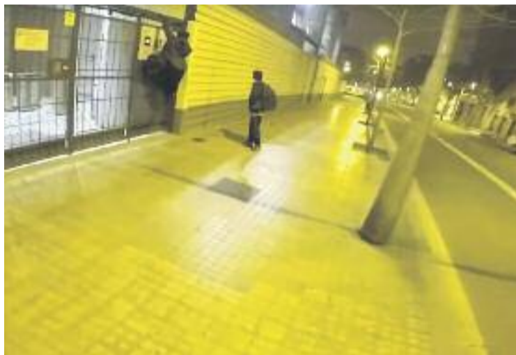
Dos dels nois en el moment de colar-se a la Sagrada Família.