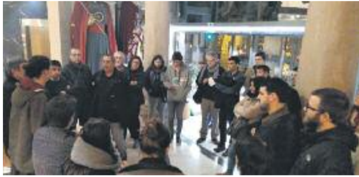
Imatge de l'ocupació de la seu del Districte.

Tot plegat es fa fer dos dies abans de la celebració, a la Casa Elizalde, d'una comissió d'habitatge on diferents veïns afectats per l'increment dels preus del lloguer, assetjament immobiliari