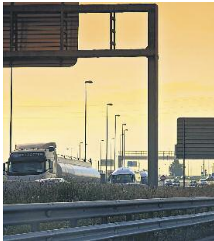
La contaminació de l'aire a l'àrea metropolitana és provocada principalment pel trànsit rodat.