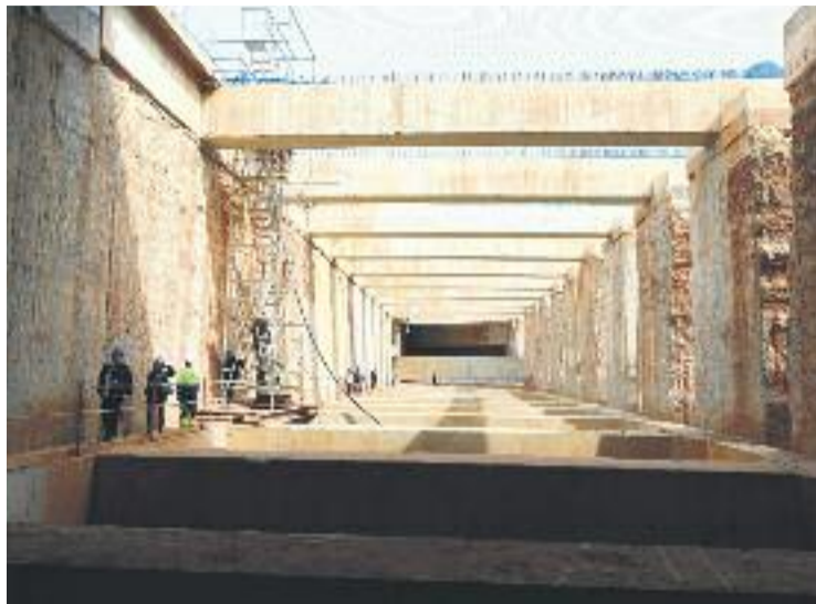
Interior d'un dels túnels a mig fer de les Glòries.

Segons el calendari amb el qual treballa ara l'Ajuntament les obres s'allargaran dos anys i vuit mesos, tot i que les del gran parc verd -la Canòpia Urbana-, el