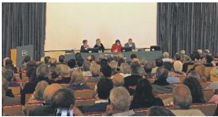
Una imatge de l'Audiència Pública del passat 3 de maig.

Posteriorment va arribar el torn dels veïns. La primera intervenció, d'una veïna, va ser pre-