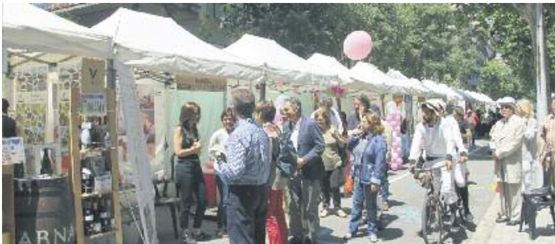
La Fira Modernista és una activitat consolidada de la Festa Major de la Dreta de l'Eixample.

» La tradicional mostra tindrà lloc del 26 al 28 al carrer Girona » Se celebrarà en el marc de la Festa Major de la Dreta de l'Eixample