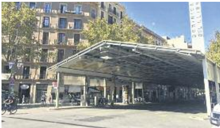
El Mercat Dominical del Llibre és un referent a la ciutat.