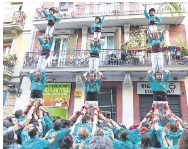
Una imatge d'arxiu d'una actuació de la colla.

Així doncs, els de la camisa verda es consoliden com una de les millors colles emergents de la ciutat i de Catalunya i encaren el calendari de la temporada amb optimisme i amb possibilitats de millorar les seves últimes grans actuacions.