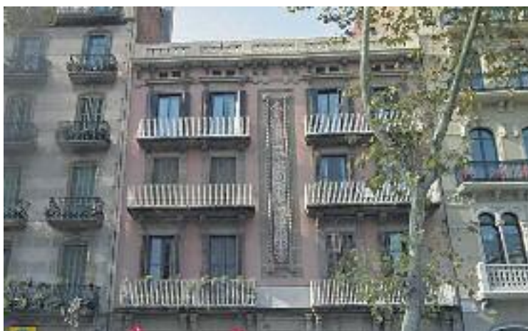
L'Eixample, el segon districte on hi ha més pisos turístics il·legals.

TURISME ▶ L'Ajuntament ha ordenat durant aquest 2017 tancar 136 pisos turístics il·legals al districte. L'Eixample és el segon districte, només superat per Ciutat Vella -allà s'ha ordenat tancar 220 pisos-, on el consistori ha obert més ordres de cessament d'activitat a pisos turístics de la ciutat.