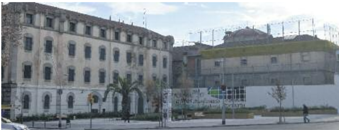
La Model tancarà les seves portes molt aviat.

EQUIPAMENTS ▶ El conseller de Justícia, Carles Mundó, va anunciar a principis de mes a la comissió de Justícia del Parlament que la presó Model tancarà les seves portes de forma definitiva el pròxim 8 de juny.