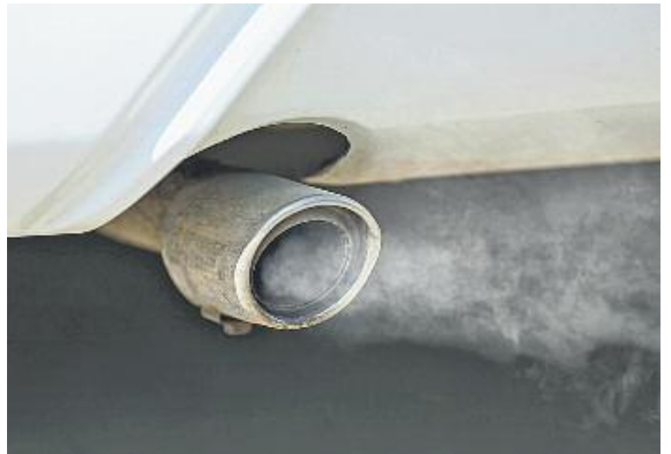
Els cotxes són la principal causa de contaminació al districte.