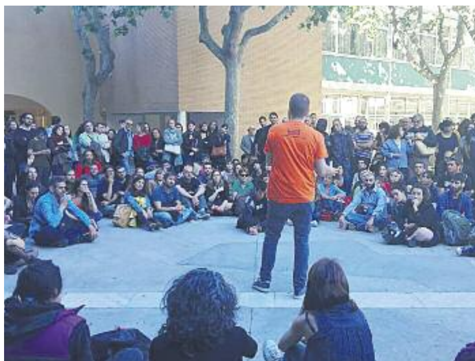
El Casinet d'Hostafrancs es va omplir per la presentació del sindicat i un centenar de persones van haver de seguir l'acte des del carrer.