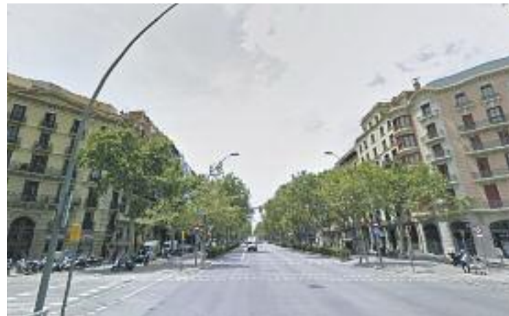
Un dels accidents va tenir lloc a la Gran Via amb Girona.

D'altra banda, dos dies més tard un altre ciclista va quedar en estat molt greu després de ser atropellat per un autocar, que no va poder esquivar-lo, a la Gran Via a l'altura del carrer de Girona. Segons va informar Betevé, un testimoni de l'accident va explicar que el ciclista, que va ser traslladat a l'Hospital Clínic, s'hauria saltat un semàfor en vermell.