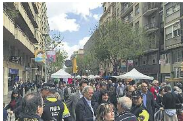
El Mercat Tradicional sempre aplega molta gent.

Per altra banda, també hi haurà tallers d'artesanía, una mostra de productes artesans i, per tal que els més petits de la casa no s'avorreixin, s'instal·laran jocs infantils i se celebraran espectacles per amenitzar dos dies que prometen omplir, com sempre, el barri de visitants.