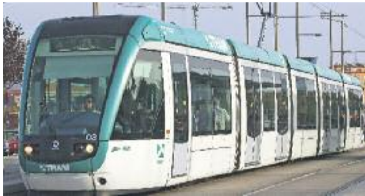
La unió del tramvia per la Diagonal genera controvèrsia.

La disposició va sorgir d'una esmena de Catalunya Sí que es Pot i va tirar endavant malgrat els vots en contra del PDeCAT i ERC per-