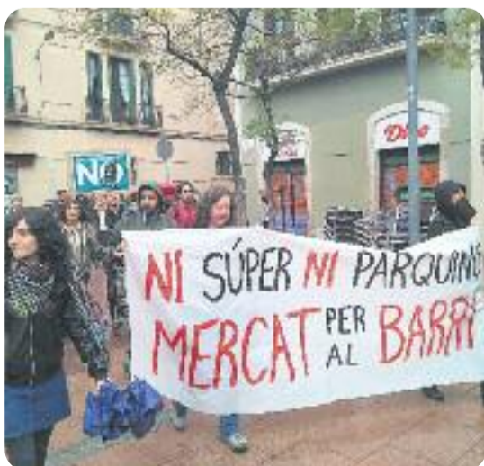
Imatge de la manifestació del dia 1.

COMERÇ/ La manca de transparència que segons Gràcia on vas? i l’Assemblea de Barris per un Turisme Sostenible (ABTS) hi ha en la reforma del mercat de l’Abaceria ha fet que aquestes dues entitats hagin portat el projecte a la Síndica de Greuges de la ciutat i al Síndic de Greuges de Catalunya.