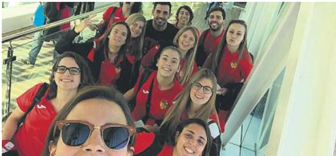
El bon ambient és una de les claus dels bons resultats de l'equip.