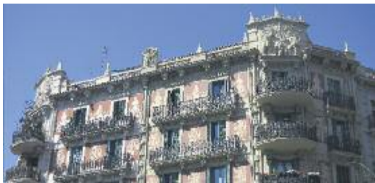
Una imatge d'arxiu de la Casa dels Cargols.

Segons aquests anuncis, l'immoble compta amb dos locals i onze habitatges. "Excepcional possibilitat d'adquirir un edifici al cor de Barcelona", explica l'agència immobiliària. Ara bé, per a Fem Sant Antoni, la ven-