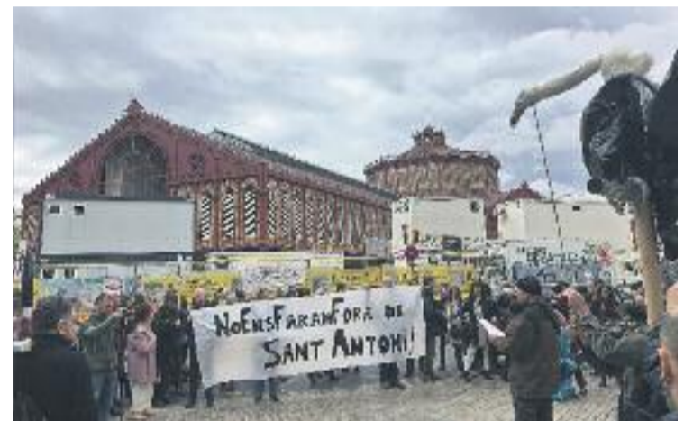
Un moment de la manifestació del 1 d'abril.

Durant la lectura del manifest, la plataforma va lamentar el tancament de botigues i l'obertura de bars i restaurants amb preus que, segons diuen, no poden assumir. A més, van reclamar a polítics i governants "polítiques valentes" per fer front als lobbies immobiliaris.