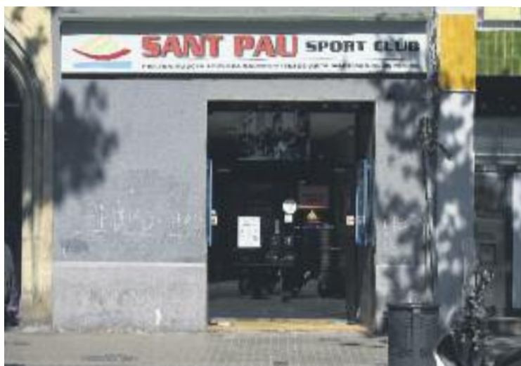
El gimnàs és un referent social del Raval.

L'acord també estableix que el Gimnàs Sant Pau haurà de pagar els costos del procediment judicial que es va iniciar per l'impagament de les rendes. Per la seva banda, la propietat es retirarà del procés judicial per fer efectiu el desnonament de l'espai. Diumenge,