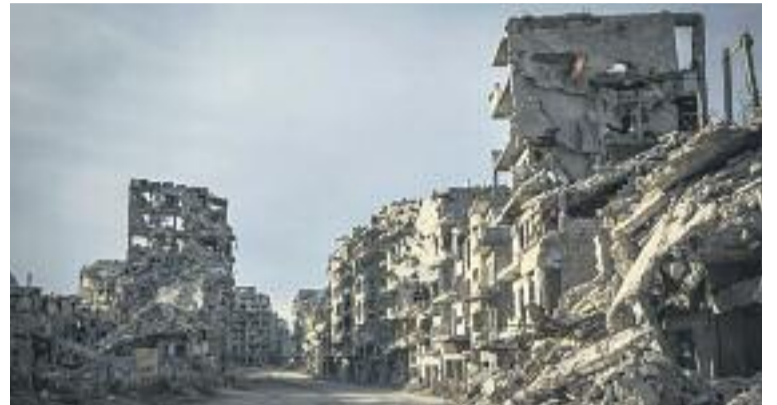
Manifestació multitudinària a Barcelona el 18-F (esquerra), refugiats a Àustria (a dalt) i Homs, a Síria, destrossada per la guerra (a baix).