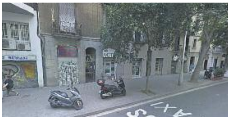
Tres socis no poden obrir una cafeteria a Floridablanca, 134.

NORMATIVA ▶ La moratòria de restaurants a Sant Antoni que va impulsar l'Ajuntament a finals de febrer, la qual prohibeix l'obertura de nous establiments durant un any, està portant cua.