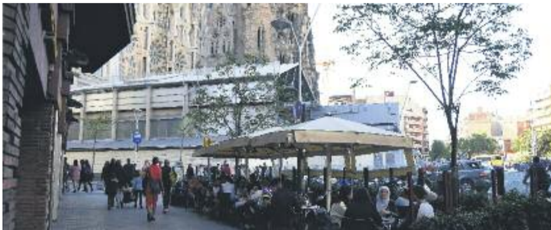
Les terrasses dels voltants de la Sagrada Família seran aviat història.

» És la principal novetat de l'ordenació singular de l'entorn del temple » S'instal·laran sis plataformes per a terrasses a prop, al carrer Sardunya