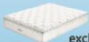
desde 689€ exclusive ROYAL