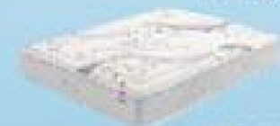
desde 420€ VISCO BIOCERAMIC WBX400