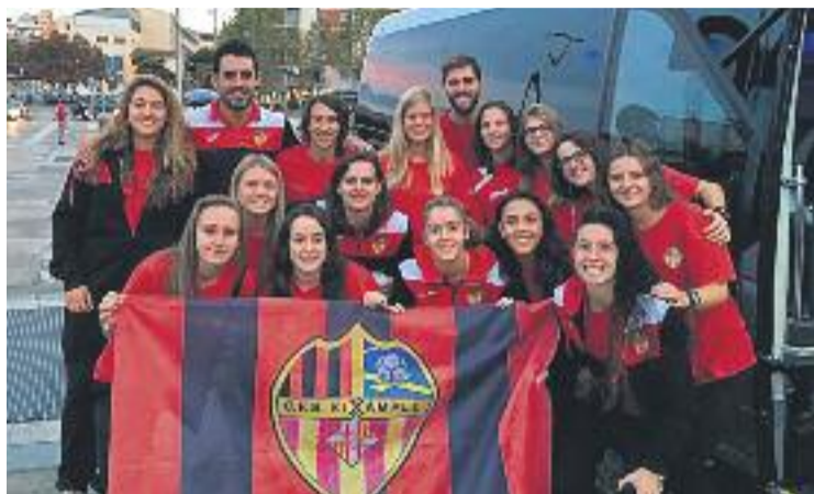
El sènior femení ha aconseguit l'ascens aquest any.

L'objectiu més immediat per als dos sèniors, com ja va explicar el president Adrià Muixí a aquesta publicació, és consolidar el projecte mantenint les categories al mateix temps que es treballen les categories de base per tal de reforçar els equips del futur amb jugadors i jugadores sortits del planter. Actualment, l'equip té