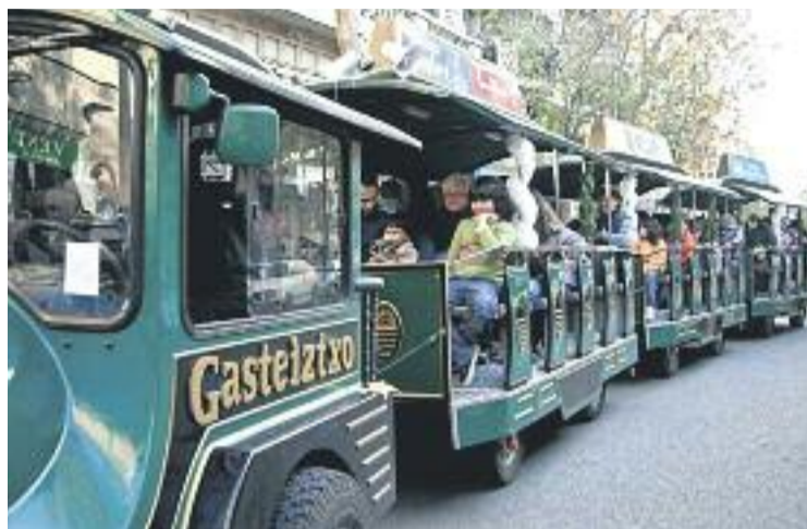
El trenet, un clàssic del Nadal barceloní.

Sant Antoni Comerç (SAC) també posarà a disposició dels seus clients el trenet, que recorrerà el barri a partir del 18 de desembre i fins al 4 de gener. Per pujar tant a aquest tren com al de l'Eix Sagrada Família, cal fer servir els bitllets que repartiran els comerciants a les botigues.