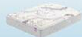
desde 475€ VISCO BIOCERAMIC WBX300