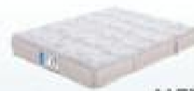
desde 305€ NEXUS