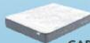
desde 420€ GARBI