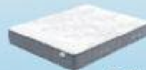
desde 565€ GALAXY