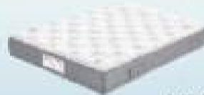
desde 345€ NUBE