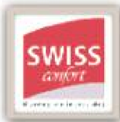
Swiss Confort Colchones y Somieres