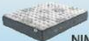
desde 475€ NIMBUS