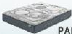
desde 475€ PALACE