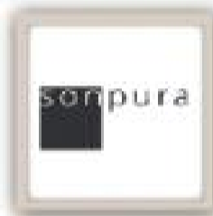
Sonpura Colchones y Cojines