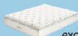
desde 575€ exclusive ALHAMBRA