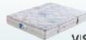
desde 315€ VISCO MULTIELASTIC