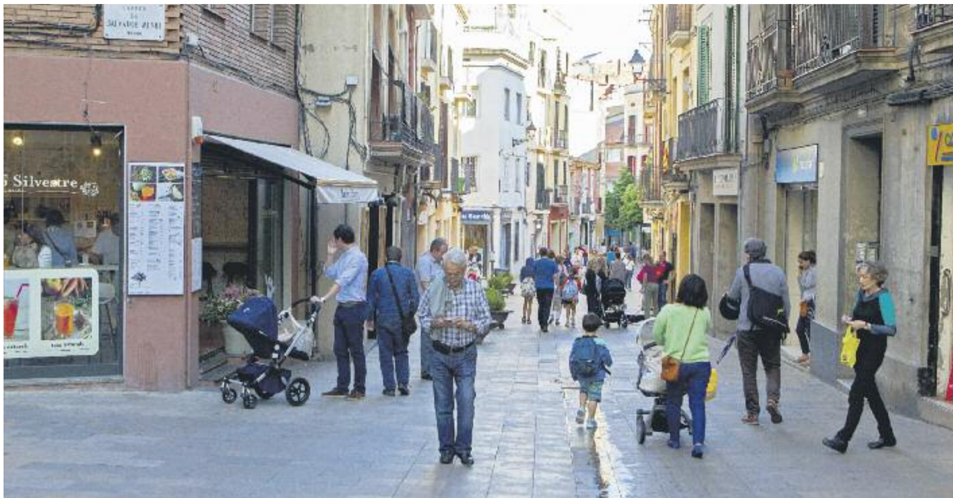
El comerç de proximitat està fent passos endavant per posicionar-se en el món digital.