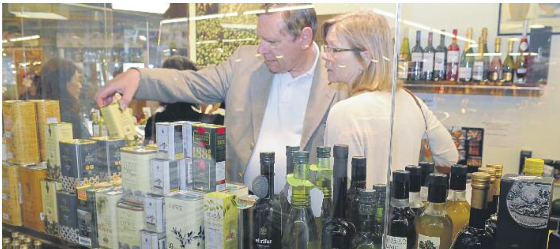
Els botiguers esperen que les vendes creixin aquest Nadal.