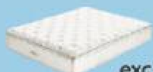
desde 689€ exclusive QUEEN