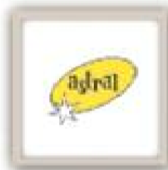
Astral Colchones y Cojines