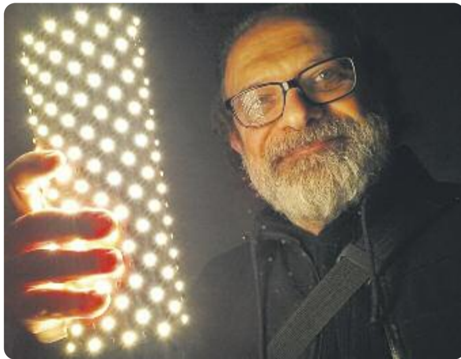
Riedweg és l'alma mater del certamen.

A part d'aquest, hi haurà Premi a la millor pel·lícula, el guanyador del qual rebrà 2.000 euros i l'Hermes del Comerç; Premi al millor director, pel qual es donaran 1.000 euros i també l'Hermes del Comerç i després es premiaran altres categories com la Banda Sonora, la fotografia, a la botiga més col·laborativa, etcètera, els quals obtindran altres premis. Els guardons s'entregaran el dia 20 de gener en una gala que se celebrarà al Caixaforum de Montjuïc.