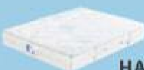
desde 245€ HABANA

Precios válidos hasta el 29 de diciembre. Consulte condiciones en tiendas