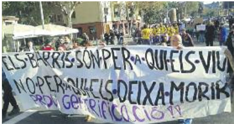
Un moment de la manifestació transversal.

Per exemplificar com es porta a terme la gentrificació, la cercavila reivindicativa va recórrer els principals punts calents de les tres zones, entre els quals la Rimaia, el Teatre Arnau, Can 60, Talia, el gimnàs Sant Pau o el solar del Portal de la Santa Madrona, on està projectada la