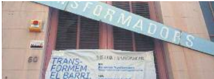
L'espai va ser desallotjar ahir al matí.

Durant l'anterior govern de Trias ja es va acordar el seu enderrocament i la construcció d'un nou edifici de cinc plantes amb diferents equipaments. En un comunicat, l'Ajuntament va informar ahir que el procés participatiu per elaborar un projecte basat en el consens veïnal va acabar el 9 de març. Aquest procés, explica l'Ajuntament, ha servit per acordar convertir l'edifici en un "equipament de proximitat gestionat