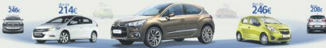
Citroën DS4-1.6 VTi 120 Design SP 120CV Preu anual orientatiu amb bonificació.