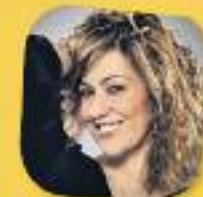
Les mil i una nits de Maria de la Pau Janer Amb Maria de la Pau Janer De dilluns a divendres, de 22 a 23 h