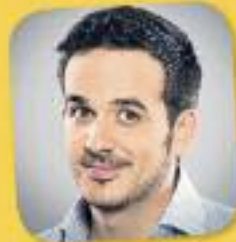
El club de la mitjanit Amb Francesc Garriga Cada dia, de 23 a 1 h