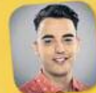
La tribu de Catalunya Ràdio Amb Xavi Rosiñol De dilluns a divendres, de 16 a 19 h