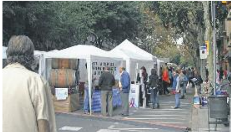
L'Eix Sagrada Família completa el seu calendari d'actes amb la fira.

Pel que fa al programa de dissabte, els assistents a la fira comercial viatjaran per uns instants a l'Índia de la mà d'una demostració de dansa estil Bollywood, que després d'arrasar al país asiàtic ha aterrat amb força a casa nostra. Una hora més tard, el ball donarà pas a la música amb Los últimos del Titanic, que amenitzaran la tarda de compres.