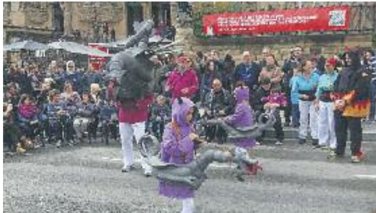
La cultura popular va substituir els cotxes el passat dia 20.

Per estrenar aquesta nova mesura, el passat 20 de març es va celebrar una jornada amb la cultura popular com a protagonista que va servir com a prova