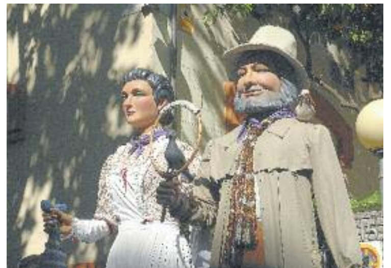
Una imatge d'arxiu de la tradicional trobada gegantera.

Per altra banda, el pregó d'enguany el faran conjuntament les diferents entitats que formen la Coordinadora d'Entitats.