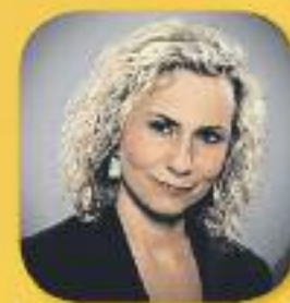
El matí de Catalunya Ràdio Amb Mònica Terribas De dilluns a divendres, de 6 a 12 h