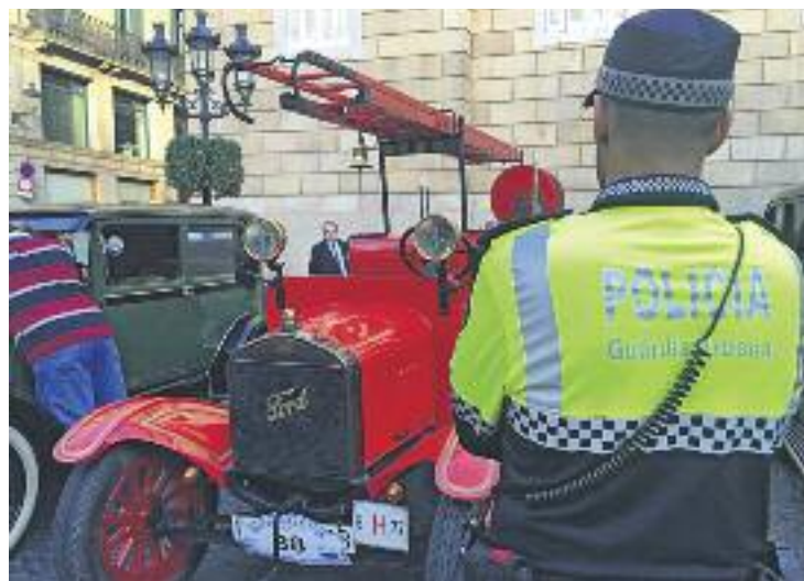
Alguns vehicles a Sant Jaume abans de la sortida.

Els vehicles, que van arrencar des de la plaça Sant Jaume, van recórrer plaça Catalunya, les Rambles, el Paral·lel, plaça Espanya i la Gran Via, per després endinsar-se a l'Hospitalet, Cornellà, Sant Boi, Viladecans, Gavà, Castelldefels i, per últim, Sitges, on es va celebrar una desfilada per tot el municipi fins a arribar al seu port. Allà es van lliurar els premis als cotxes més destacats.