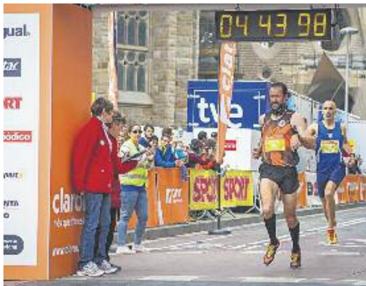
Una imatge de l'edició passada de la Milla.