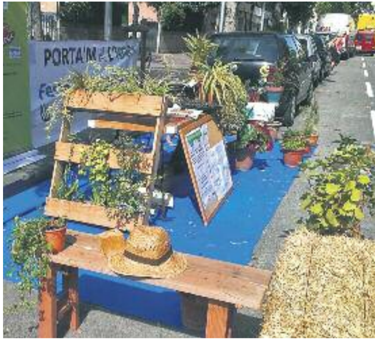
Un dels espais habilitats durant la passada edició.

La iniciativa, sorgida a San Francisco l'any 2005 de la mà del col·lectiu d'arquitectes Rebar, es va celebrar a Barcelona per pri-