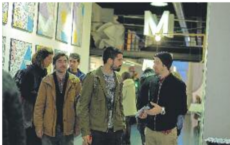
Imatge d'una de les exposicions organitzades per la galeria.

El passat dia tres de setembre es va celebrar una festa de comiat oberta a tothom.