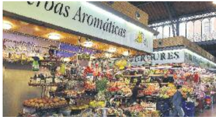
El premi celebra enguany la sisena edició.

Els organitzadors volen subratllar que poden ser candidates al premi tant les propostes que presentin els comerciants i associacions com aquelles que, tot complint els requisits descrits a les bases, s'hagin desenvolupat fins a la data de convocatòria de la present edició del premi.