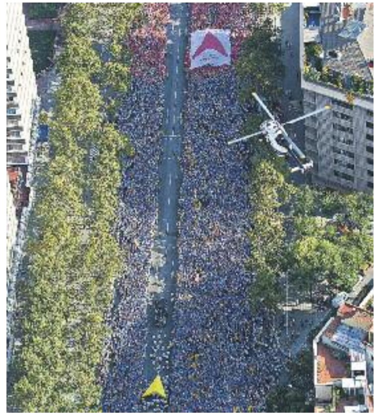
L'avinguda Meridiana va presentar un aspecte immillorable al llarg de tota la Via Lliure.