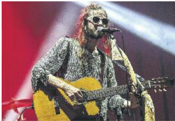
Sebastian Pringle durant un concert de Crystal Fighters.