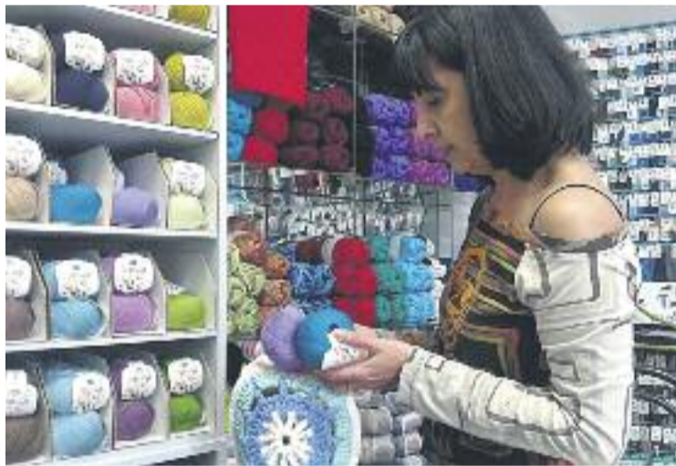
L'Obert al Futur és un programa gratuït.