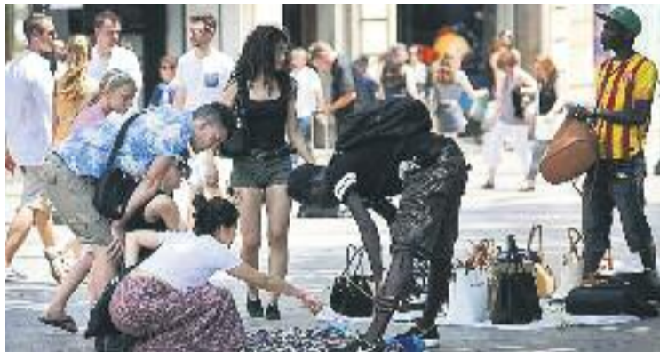
S'han realitzat unes 400 enquestes per a l'estudi.

L'estudi de la UCC també destaca que el 76% dels clients del top manta no saben on van a parar els diners que paguen, i el 81% desconeixen de quin país