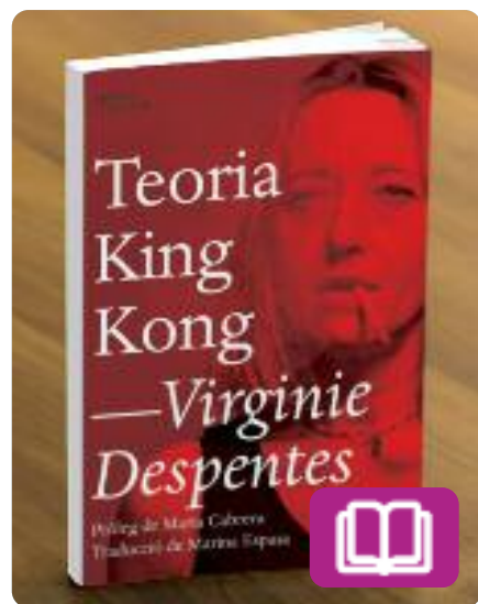
Teoria King Kong Virginie Despentes

El llibre funciona com un manifest feminista que reflexiona al voltant de l'experiència de les dones, el matrimoni i la maternitat, i aborda polèmiques sobre temes relacionats amb el gènere.