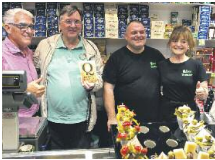
Presentació de la Q de Qualitat a la Boqueria.

Per aconseguir aquest segell de qualitat fa falta que les parades compleixin una sèrie de re-