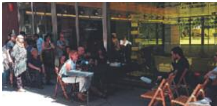
Roda de premsa per denunciar el cas del carrer Espalter.

Els successos relacionats amb el tràfic de drogues fa temps que han arribat al Gòtic. El 5 de juny un home va morir després d'una baralla amb armes blanques per un conflicte relacionat amb les