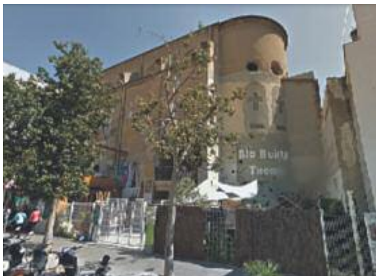
Una imatge de l'antiga capella de la Misericòrdia.