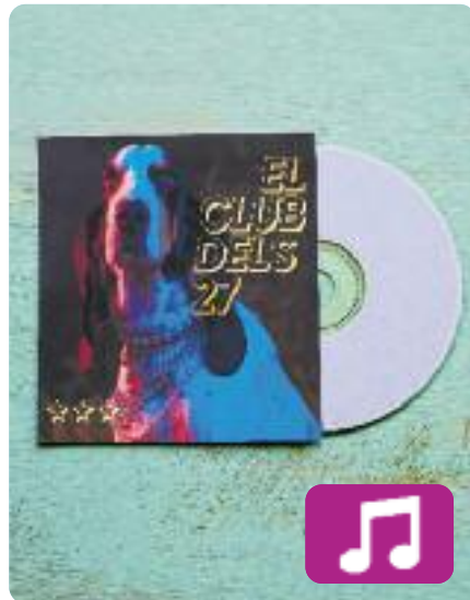
El club dels 27 Nyandú

Nyandú ha publicat el primer senzill del que serà el seu tercer disc, que sortirà al setembre. El club dels 27 és el primer single del nou àlbum, amb el qual la formació de la Torre d'Oristà (el Lluçanès) manté intacta l'actitud rockera i les melodies pop que els van dur a coronar-se amb el Sona9 l'any 2011. El títol del disc encara s'ha de revelar.