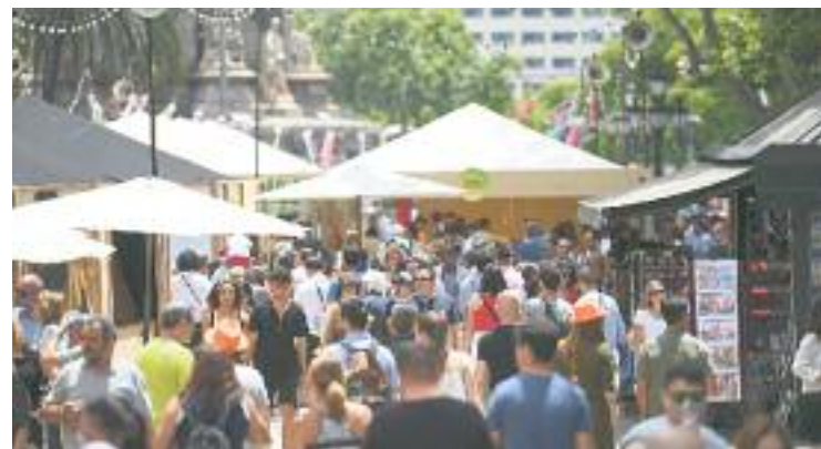
Una imatge de l'edició d'aquest any.

Enguany l'esdeveniment també va tenir un toc asiàtic, ja que el restaurant Dos Palillos, que celebra el seu desè aniversari, va organitzar diferents activitats relacionades amb la gastronomia i la cultura asiàtica.