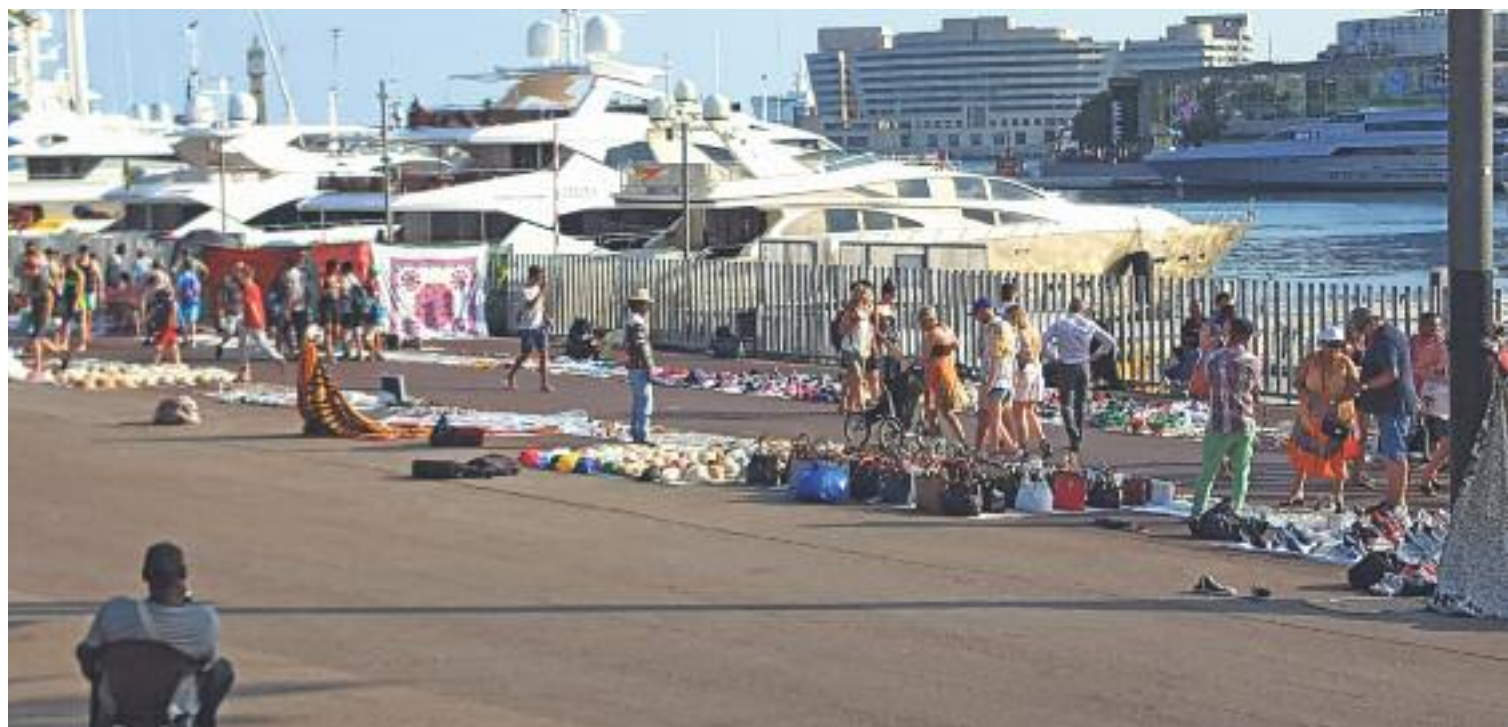
La venda ambulat il·legal, diuen els comerciants, ha augmentat en els últims anys.

Les entitats firmants del text també van voler deixar clar que les seves queixes es dirigeixen cap a l'Ajuntament, per la seva “in- suficient” resposta envers aquest fenomen, i no cap als venedors del Top Manta. La denúncia, va afirmar Villar, és contra l'activi-