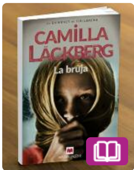
La bruja Camilla Läckberg

L'1 de març ja es podrà llegir en castellà una novel·la que ja ha venut 200.000 exemplars a Suècia.