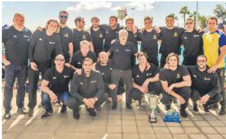
La foto de família dels campions amb la Copa.

però que va caure gràcies a una ratxa de cinc gols consecutius que van fer que el resultat passés del 2-2 al 7-2. Els de la Barceloneta van certificar el passatge a la final guanyant per 14-5.