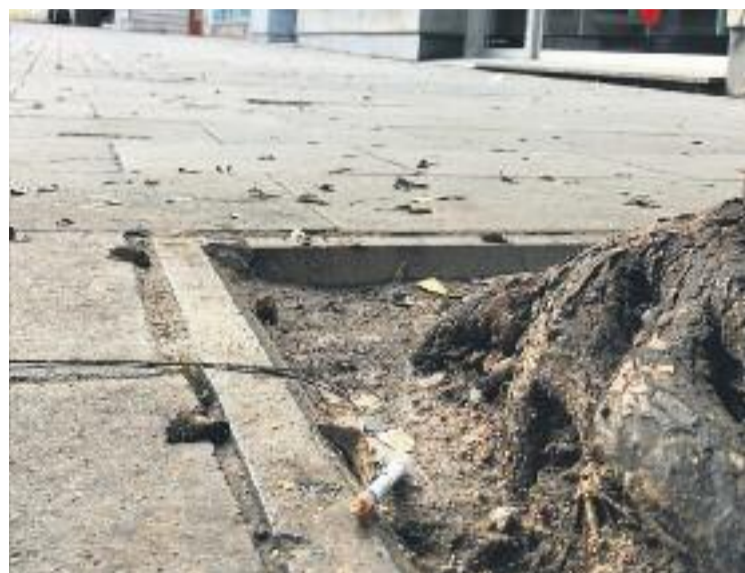
A l'esquerra, un narcopiso tapiat. A la dreta, una escena habitual al barri: una xeringa a terra.

'narcotour' -el llenguatge actual per parlar del Raval recorda més aviat països com ara Mèxic- el van encapçalar els membres d'una entitat constituïda fa poc, l'Associació de Veïns de l'Illa Robadors-Picalquers-Roig. Són tres dels carrers més problemàtics. Els seus integrants i altres particulars que viuen en aquests o en altres carrers afectats -Reina Amàlia és un dels nous punts de venda de droga- denuncien que el seu dia a dia és un infern. Els toca conviure amb baralles, xeringues, crits... Tot plegat fa que fer vida normal sigui impossible.