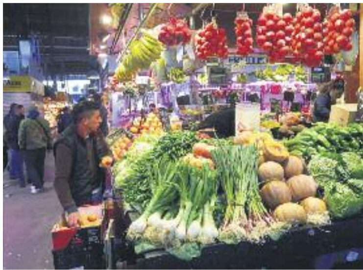
La Boqueria és el mercat més famós de la ciutat.