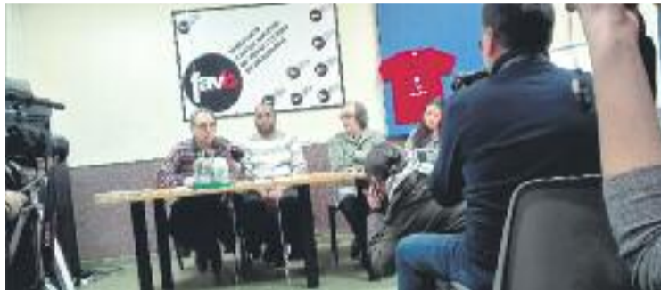
Els fets es van fer públics el 6 de febrer.

El passat 6 de febrer un matrimoni, amb el suport d'una desena d'entitats entre les quals hi havia l'Observatori DESC i la Federació d'Associacions de Veïns de Barcelona (FAVB), van fer públic el seu cas. Van explicar que un home, que després van descobrir que no era el propietari del pis, els va començar a llogar l'immoble del carrer Riereta. De seguida, van explicar, van començar a rebre "la visita dels senyors de Desokupa", ja que el veritable amo del pis havia contractat els seus serveis. Una d'aquestes visites, segons el relat de la família, va acabar amb un membre de Desokupa empenyent la dona, que estava embarassada, i provocant-li l'avortament.