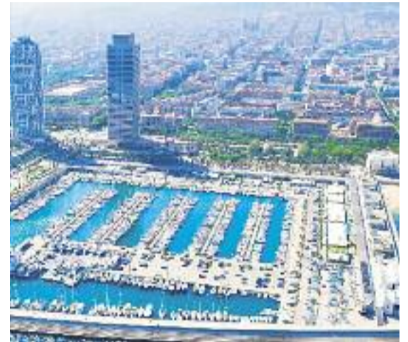
Una reproducció virtual de la zona un cop es faci el projecte (esquerra) i una imatge aèria actual (dreta).

cat als ciutadans sigui de 48.000 metres quadrats, més del doble que l'actual. "Volem que els veïns i les veïnes de la Vila Olímpica i el conjunt de la ciutat tornin al Port Olímpic i se'ls sentin seu", va afirmar Colau.