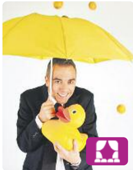
Gala Internacional de Màgia Alberto de Figueiredo

El Teatre Zorrilla de Badalona celebra aquest febrer la 18a Gala Internacional de Màgia. El plat fort serà del 23 al 25, amb el mag Alberto de Figueiredo com a mestre de cerimònies.