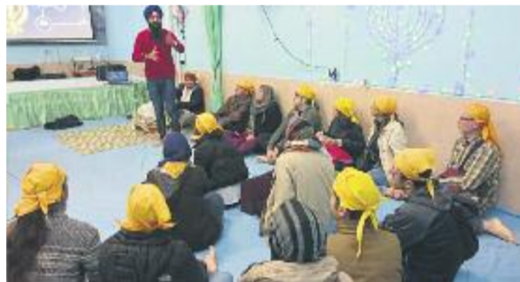
Una imatge d'una de les trobades del festival.

D'altra banda, el Raval també ha estat recentment protagonista per la presentació de l'homenatge a la rumba catalana al carrer de la Cera. Es tracta de dues parets mitgeres dels números 6 i 57 d'aquest carrer que acullen una escultura de l'artista Luís Zafrilla. En una de les parets s'homenatja el naixement d'aquest gènere musical i en l'altra es recorda l'empremta i el llegat de la rumba catalana.