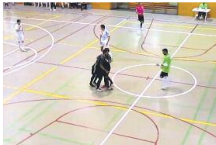
Un moment del partit contra el filial del Catgas.

Contràriament al que passarà en moltes lligues d'esports diferents, el calendari del futbol sala s'allargarà fins al cap de setmana anterior a Nadal i, per això, els de Ballester afrontaran ara un tram de competició que els farà viatjar fins a Canet de Mar i Cerdanyola (el 25 d'aquest mes i el 2 de desembre, respectivament) i rebre la visita de la Unió de Santa Coloma.