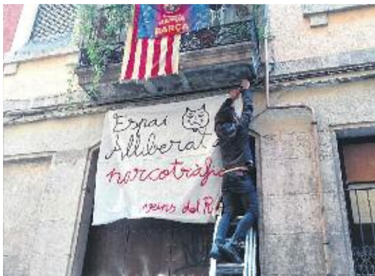
Imatge del moment de la recuperació a Riereta, 3.

El primer cas va ser el del número 5 del carrer de la Riereta, on gràcies a una operació de la Guàrdia Urbana es va poder tancar un punt de venda de droga. El segon cas va ser el del número 9 del carrer Vistalegre. De fet, aquest punt de venda de droga també va ser desmantellat primer durant una operació policial de la Guàrdia Urbana, que va acabar amb la detenció de dues persones com a presumptes autors d'un delictes contra la salut pública per tràfic de substàncies estupefaents. L'ocupació va arribar després de l'operació policial. Una veïna, amb el suport de la plataforma Acció Raval, va decidir entrar-hi per evitar que fos reocupat amb la voluntat de donar-li un ús social. Una intenció, però, que no comparteixen els veïns del carrer d'en Roig, Picalquers i Roba-