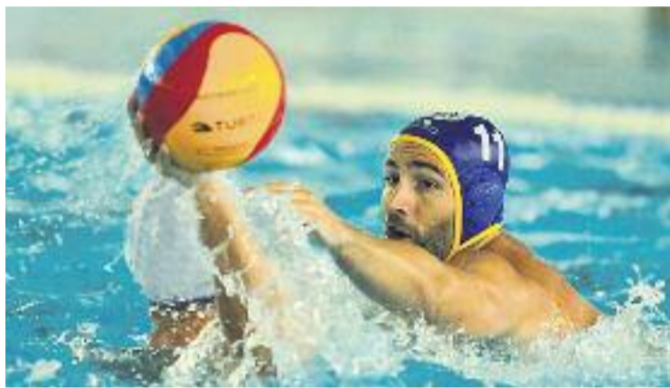
L'equip vol millorar a la Champions.

L'actualitat del club, però, també ha passat pels partits internacionals, amb el primer matx de la selecció espanyola de David Martín a la Lliga Mundial, que es va saldar amb un triomf contra els Països Baixos (9-5) el passat dia 14 a Màlaga. Vuit jugadors de l'Atlètic van jugar el matx (Dani López Pinedo sota pals i els golejadors Alberto Munárriz, Álvaro Granados, Albert Español, Blai Mallarach i Roger Tahull,