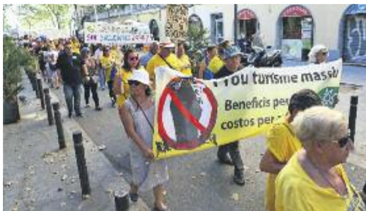
Veïns de la Barceloneta, en una protesta contra la massificació turística.

Deixant de banda el turisme, la segona preocupació dels veïns, amb gairebé un 20%, és la inseguretat. Ho és especialment per als veïns del Raval i del Casc An-