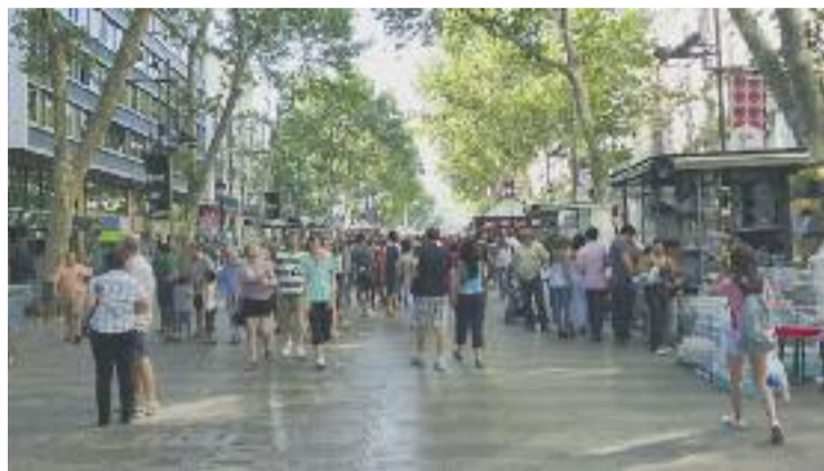
L'encesa es farà el 23 de novembre a les Rambles.

Aquest mateix dia la Fundació Barcelona Comerç i els seus 21 eixos comercials adherits posaran en marxa la seva campanya de Nadal, que té com a principal objectiu "dinamitzar les vendes en aquest període i premiar la fidelitat dels clients de les botigues de proximitat", tal com expliquen des de la mateixa Fundació. Per portar a terme aquest objectiu sortejaran 21.000 euros en vals de compra per tal que 21 persones -1.000 euros cadascuna- se'ls puguin gastar el dissabte 13 de gener a les botigues de l'eix comercial on hagin rebut el cupó premiat. En total es repartiran 80.000 números a cada un dels 21 eixos que participen en la promoció i es premiarà un client per eix. El nú-