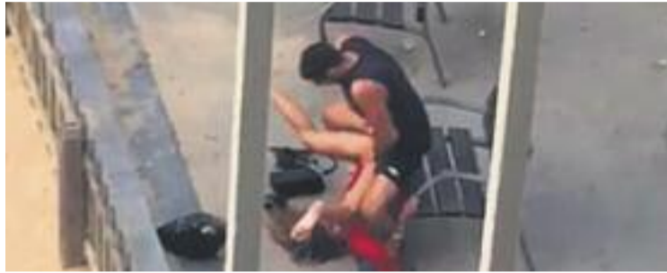
Imatge del polèmic vídeo d'una parella mantenint relacions sexuals al carrer