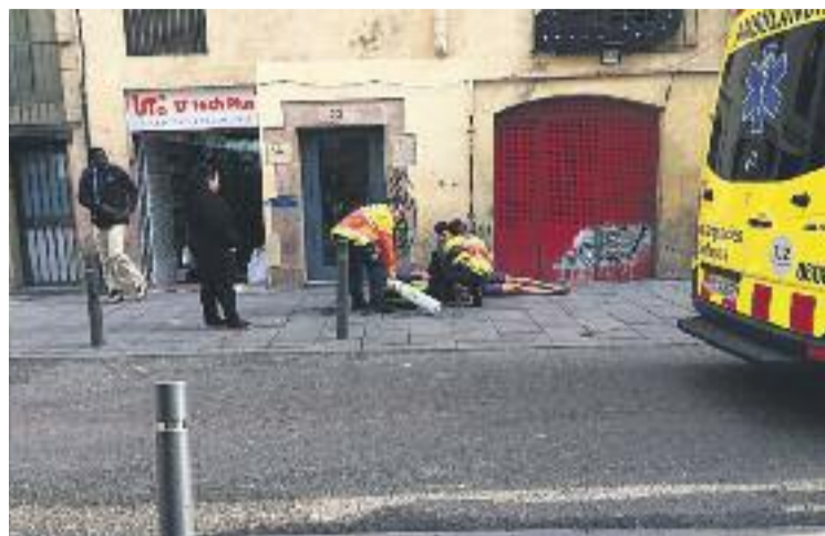
Els serveis sanitaris intervenen sovint al barri.