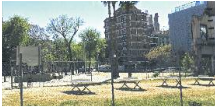
Una imatge del solar on està previst fer l'hotel.