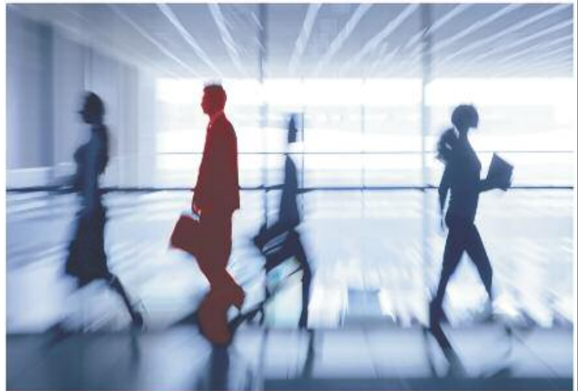
10 MILLONES DE ESPAÑOLES SUFREN DE COLON IRRITABLE

Buscando una terapia eficaz contra el colon irritable, los científicos descubrieron que la cepa de bifidobacterias ( B. bifidum MIMBb75), exclusiva en el mundo y contenida en Kijimea Colon Irritable, se deposita directamente en la pared intestinal. Metafóricamente, Kijimea Colon Irritable se pega en la pared intestinal como una tirita. Nuestros expertos lo llaman el "efecto tirita". En un estudio clínico se demostró que el malestar intestinal de los afectados disminuyó de forma significativa. Durante el estudio, algunos pacientes incluso notificaron que los síntomas del colon irritable desaparecieron. Aún hay más: los científicos descubrieron que la calidad de vida de los afectados mejoró significativamente.