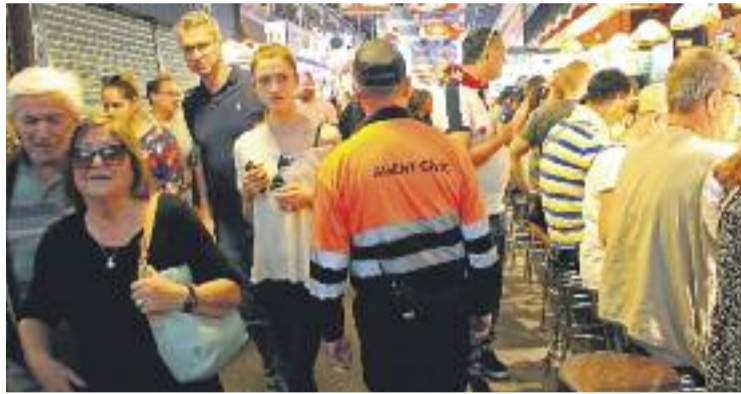
L'equip d'agents cívics està format per tres persones.

Per facilitar la recollida de dades, els agents treballaran