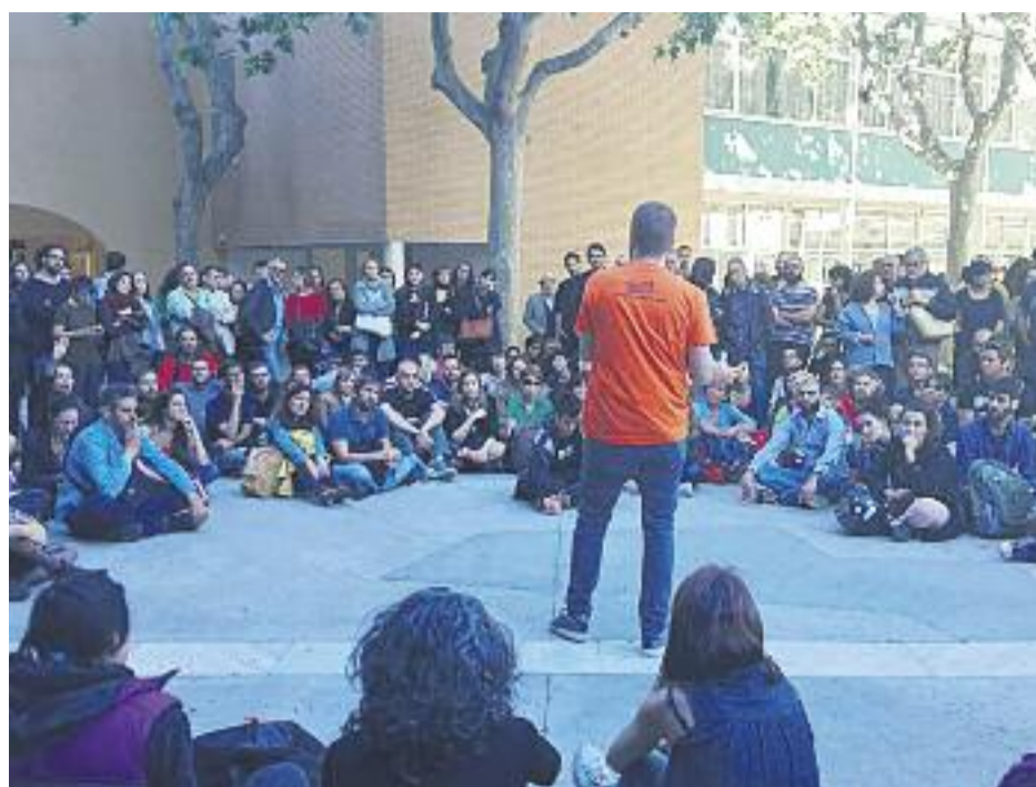
El Casinet d'Hostafrancs es va omplir per la presentació del sindicat i un centenar de persones van haver de seguir l'acte des del carrer.