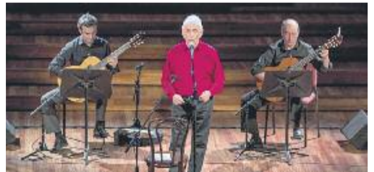
Raimon, en un dels concerts al Palau de la Música.

MÚSICA ▶ El Palau de la Música està acollint durant aquest mes de maig els 12 concerts de comiat del cantautor valencià Raimon.