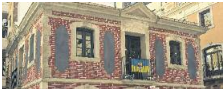
La Casa de la Barceloneta, envoltada per la polèmica.

Una integrant de l'última junta, els membres de la qual formen part de l'Associació de Veïns de l'Òstia, explica a Línia Ciutat Vella que a finals d'any ja van comunicar al Districte la seva voluntat de no seguir perquè al setembre es van quedar sense tresorer. Al mateix temps, es defensa de les acusacions de nepotisme i mala gestió rebudes i assegura que "s'han dit moltes falsedats" sobre la seva gestió i reivindica que fa temps que han tre-