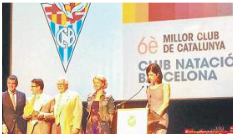
El CNB va ser premiat amb la sisena posició general.