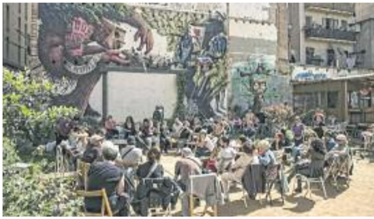
Imatge de la trobada de Raval Resistim.