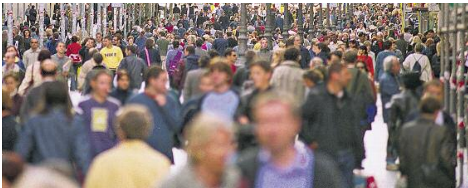
El turisme és un dels motors econòmics de la ciutat.