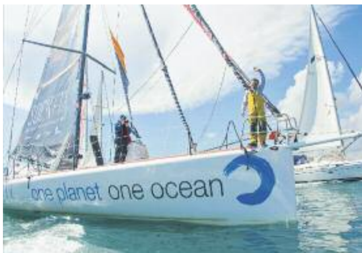
Un moment de l'arribada del One Planet, One Ocean.

"És un somni haver pogut participar i haver completat la Vendée Globe", va explicar el navegant un cop va plantar els peus a terra ferma. "És una cursa molt dura, vas acumulant cansament i cada cop costa més fer les coses", va afegir Costa, que també va destacar que "he aconseguit acabar-la amb el cor, per-