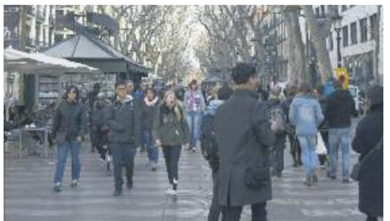
La Rambla és un dels grans punts turístics de la ciutat.

TRANSFORMACIÓ ▶ L'Ajuntament va anunciar a principis de mes la convocatòria d'un concurs internacional per dur a terme la transformació d'aquest emblemàtic passeig de la ciutat.