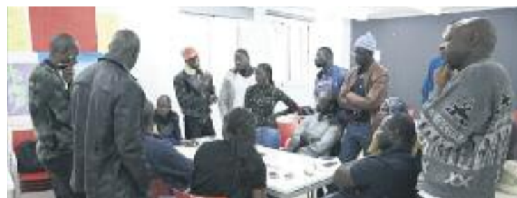
Els exmanterers han rebut formació durant sis mesos.

TOP MANTA ▶ Una quinzena d'exmanterers han posat en marxa, amb el suport de l'Ajuntament, una cooperativa amb la qual podran vendre articles de manera legal a diverses fires.