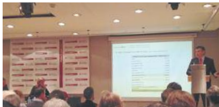
L'estudi ha estat impulsat per Barcelona Oberta.

quatre àrees segons la intensitat de les compres que fan els visitants. La primera zona comprèn el tronc central de Ciutat Vella –al voltant de la Rambla i el Passeig de l'Àngel– i una part de l'Eixample –sobretot Passeig de Gràcia i el seu àmbit–, en la qual les compres que fan els turistes a les botigues representen el 61% de la facturació.