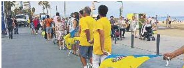
Imatge d'arxiu d'una manifestació a la Barceloneta.

Només arribar a la trobada celebrada a l'Institut Narcís Monturiol-, acompanyada de la regidora Gala Pin, es va poder veure que aquella reunió no seria fàcil per a l'alcaldesa. Un grup de veïns van rebre Colau i Pin amb pancartes que exigien solucions i on també se'ls recordava el seu passat com a activistes. "Ada, Gala, per què de-