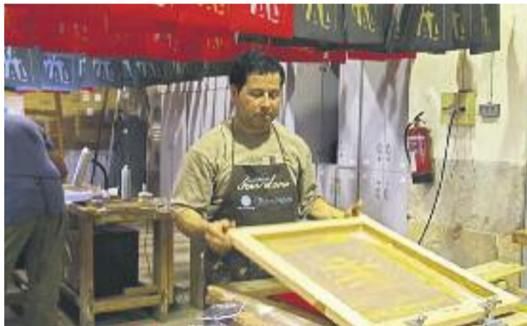
Els participants en el projecte s'han format en serigrafia i electricitat.

El projecte, que ha donat feina a 14 persones d'aquesta franja d'edat, ha consistit en l'elaboració de bosses de plàstic serigrafiades i de llums de Nadal en forma de pètal, els quals, al seu torn, defineixen el contorn del barri del Raval. Aquests llums, fets amb leds de baix consum, es financen amb aportacions en forma de donació –de 50 i 180