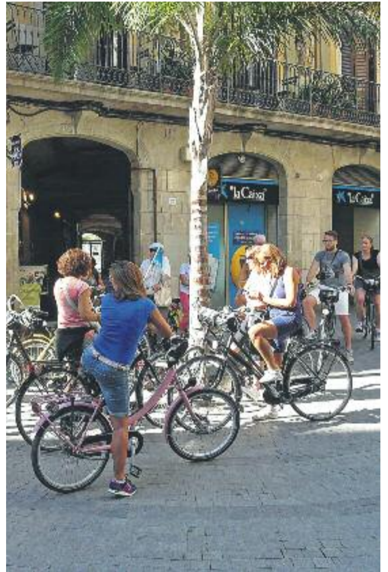
L'Ajuntament vol que d'aquí a tres anys la ciutat sigui molt més accessible per als ciclistes.