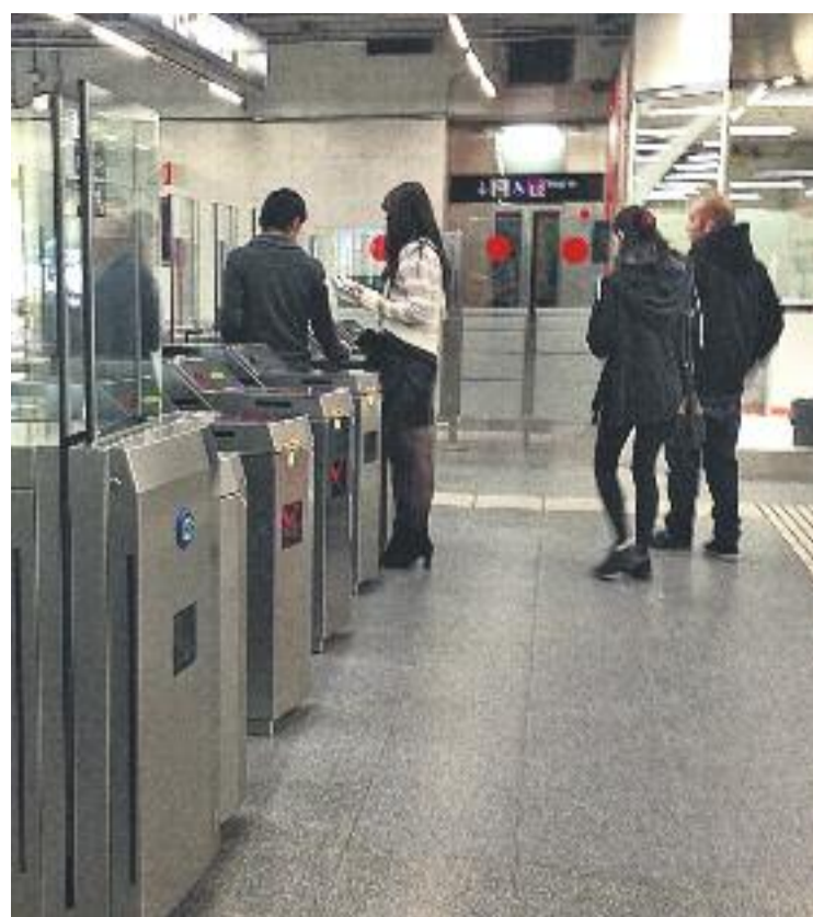
El frau al metro ha anat creixent en els darrers anys, tot i que el rècord es va registrar el 2009.