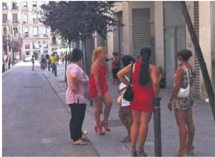
Imatge d'un grup de prostitutes al carrer d'en Robador.