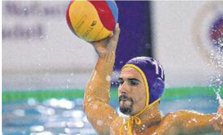
L'Atlètic-Barceloneta està vivint un moment dolç.

Aquesta victòria, unida a l'aconseguida dissabte passat contra el gran rival, el CN Barcelona, per 18 gols a 6, dona moral als de Chus Martín per afrontar el tercer partit de Champions, que disputaran aquest dissabte a terres hongareses contra l'Eger. Ara per ara, els barcelonins ocupen la primera posició del seu grup a la màxima competició del waterpolo europeu, amb sis punts fruit de dues victòries, contra l'Spandau berlinès (9-