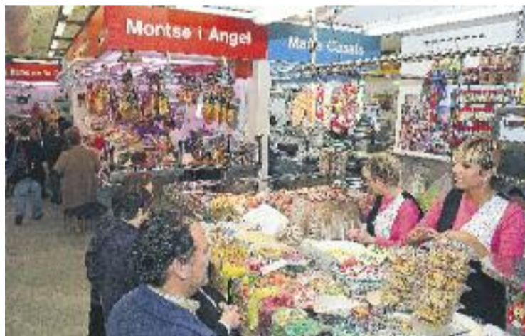
Les vendes nadalenques suposen un terç de la facturació anual.

PREVISIONS ▶ La campanya de Nadal d'enguany podria posar la cirereta del pastís a un 2015 que sembla haver trencat amb la mala ratxa dels últims anys en el sector del comerç –almenys segons les dades a gran escala–. I és que la Confederació de Comerç de Catalunya (CCC) confia que aquesta pròxima campanya de Nadal serà "positiva" per al sector, en la línia de la que es va viure l'any passat. Concretament, la CCC espera que les vendes s'incrementin un 4%, especialment