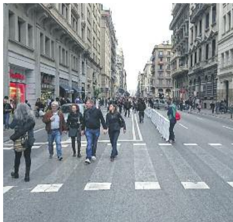
La Diagonal i la Via Laietana, dues de les principals avingudes que van quedar tallades durant el Dia Sense Cotxes.