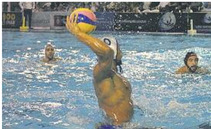
El Barceloneta va fer un gran partit en atac.

A la represa l'Spandau va retallar distàncies. I és que el tercer quart va ser molt fluix per als