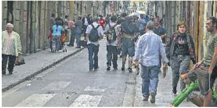
El Raval, el barri del districte amb una esperança de vida menor.

L'informe, que conclou que en 18 dels 73 barris de la ciutat les dificultats socioeconòmiques es tradueixen en problemes de salut, també mostra com l'esperança de vida als quatre barris del districte (81,1 anys) és inferior a la mitjana de tots els barris la ciutat (82,23 anys) i fa que Ciutat