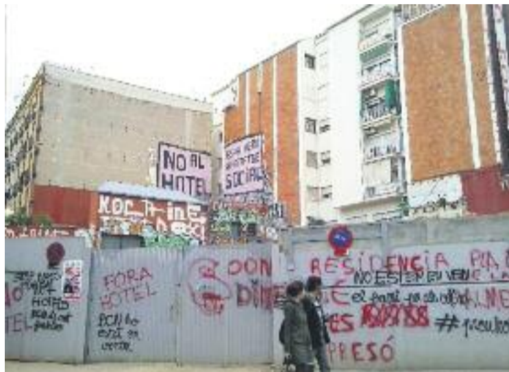
L'AVV del Casc Antic vol aturar la construcció de l'hotel. Hotel: AVV Casc Antic

La investigació arriba després d'una denúncia de l'Associació de Veïns del Casc Antic, de l'Associació de Veïns de la Barcelona Vella i de la plataforma Aturem l'Hotel al Rec Comtal. Les tres entitats sempre han defensat que l'operació no s'ha basat en l'interès públic, sinó que s'ha fet "a mida dels interessos particulars". Totes tres demanen ara que s'investigui com es van aconseguir els tràmits per a la construcció de l'hotel i si hi podria haver presumptes delictes de tràfic d'influències, suborn o prevaricació.