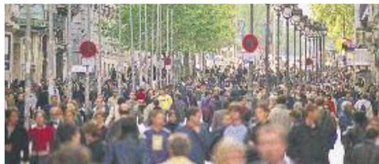
L'IcoB destaca que l'actitud dels clients és més "animada".

ESTUDI ▶ Més bones notícies per al comerç de proximitat. L'Indicador Comerç Barcelona (l'IcoB) del tercer trimestre indica que les rebaxes d'estiu d'enguany van ser les millors des del 2013, una dinàmica que per al president de la Fundació Barcelona Comerç, Vicenç Gasca, "és una demostració del canvi cap a la tendència positiva", alhora que "referma el convenciment del món del comerç que s'espera una bona campanya per a aquesta tardor i hivern".