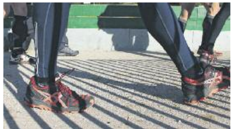
Enguany se celebra la segona edició d'aquesta prova.

CURSA ▶ Ja està tot a punt per a la segona edició de la Barcelona Magic Line, la cursa solidària de muntanya no competitiva que recorrerà 9 turons de la ciutat –cadascun dels quals dedicat a una causa social poc visible– i que acabarà a la plaça de la Catedral, després d'haver pujat a l'antic Mont Tàber de Ciutat Vella. La carrera tindrà lloc el diumenge 1 de març durant el matí.