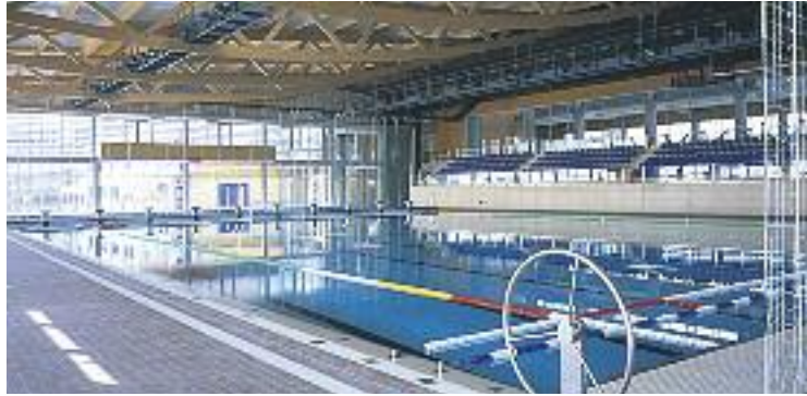
La Nova Escullera serà l'epicentre de la competició.

El sorteig, que va tenir lloc el passat dijous 19 de febrer a l'Antiga Fàbrica Damm, va encreuar el CN Barcelona –l'amfitrió– amb el Real Canoe madrileny i l'Atlètic-Barceloneta amb el CE Mediterrani. Tots dos partits es disputaran el divendres 27 a un quart de quatre de la tarda i a dos quarts de nou del vespre, respectivament, a la piscina de l'Escullera. Les semifinals i la final