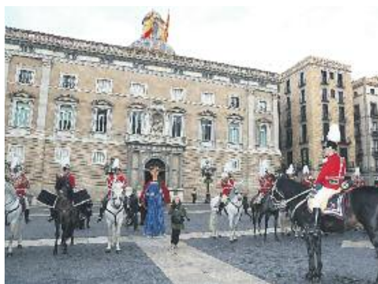
Imatge del Penó de Santa Eulàlia.

gran protagonista de la celebració va ser el Festival Llum BCN, que enguany celebrava la seva quarta edició i que coincidia amb la declaració del 2015 com a any Internacional de la Llum per part de Nacions Unides. El festival va comptar amb un acte organitzat per l'Ajuntament i l'Institut de Ciències Fotòniques que va marcar el punt de partida d'un any ple d'activitats relacionades amb la llum i durant els dies posteriors el protagonisme se'l van endur una actuació castellera lluminosa a la plaça Sant Jaume i una vintena d'instal·lacions lumíniques instal·lades al cor del districte.