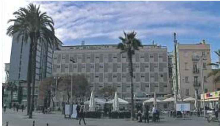
La Clínica Barceloneta, al centre de la imatge.