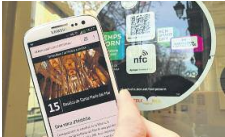
Els aparadors de les botigues ofereixen codis QR.

Amb aquesta iniciativa, els vianants poden descobrir el passat d'indrets molt diversos, com ara el carrer del Rec, de la Pes-