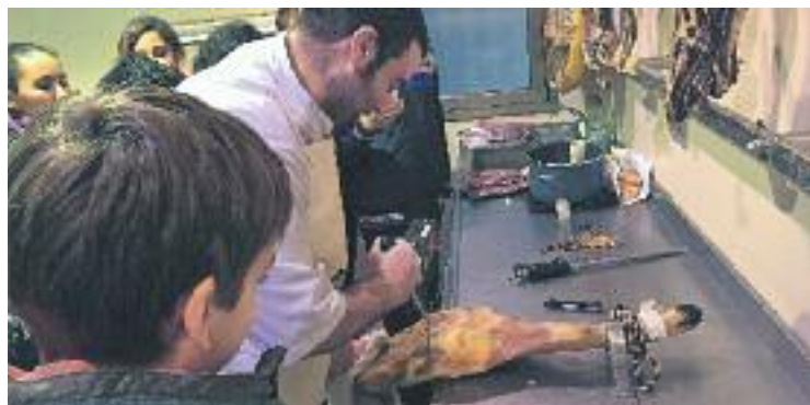
Enguany s'han realitzat 233 visites a botigues de la ciutat.

INICIATIVA ▶ El programa El Comerç i les escoles finalitzarà el curs amb la participació de 5.042 alumnes de 65 centres de la ciutat. Aquestes són dades que ha fet públiques darrerament l'Ajuntament en referència al curs 2014-2015 d'aquesta iniciativa, que es fa des de l'any 2011. Les visites, però, es desenvoluparan encara fins al pròxim mes d'abril. En total, hi haurà 233 visites d'escolars a diferents comerços de la ciutat.