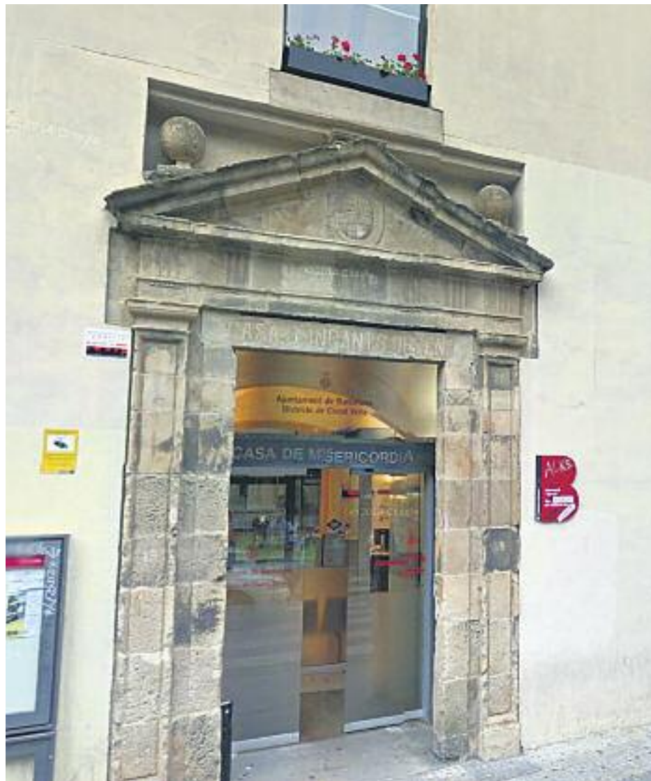
Les oficines d'atenció ciutadana seran a partir del març un nou punt d'assessorament per buscar feina.