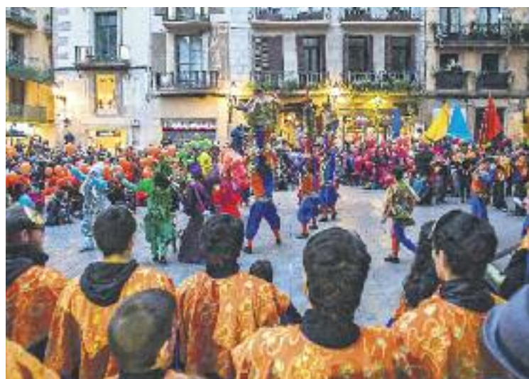
El Carnestoltes va omplir Ciutat Vella de color.

L'endemà va arribar el torn del Ball del Rodolí, una de les grans novetats d'enguany gràcies a l'aposta per recuperar les festes històriques de Carnestoltes. La Sala Moragas, del Born Centre Cultural, va ser l'espai escollit per aquest sarau ple de dis-