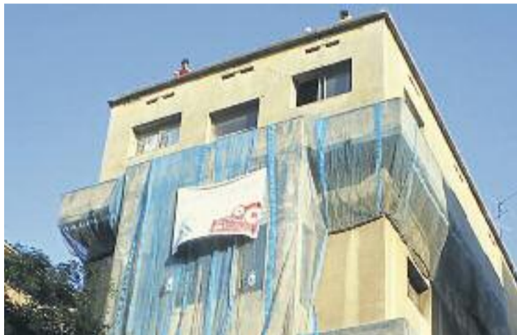
Una acció reivindicativa del 2010.

Tot i que actualment la propietat de l'edifici es troba en litigi des del 2012, el consistori vol rehabilitar l'edifici i donar-li un ús públic per al barri, tal com demanen els veïns des de fa molts anys. El pla especial aprovat inicialment estarà ara un mes en exposició pública i, un cop s'hagin resolt les possibles al·legacions, s'haurà d'aprovar definitivament al Ple de l'Ajuntament. És llavors que l'expedient d'expropiació de l'edifici ja tindrà llum verda.