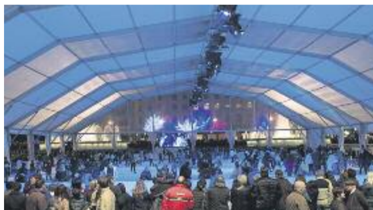
Enguany la pista compta amb finançament de l'Ajuntament.