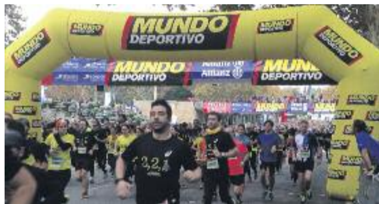
La cursa va transcórrer majoritàriament per Ciutat Vella.

Enguany, la Jean Bouin també va celebrar la 65a edició del Trofeu Internacional Ciutat de Barcelona, la 32a edició dels Trofeus Escolars de la Generalitat de Catalunya i la 29a dels Premis Promesa de la Diputació de Barcelona. Una cursa antiga que cada any va a més.