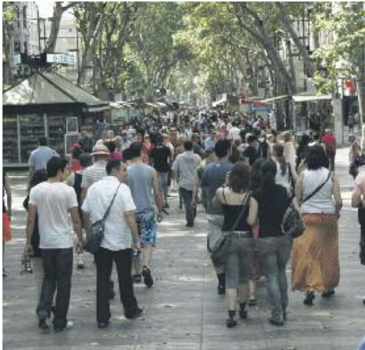
Ciutat Vella és el districte on es parlen més llengües estrangeres.