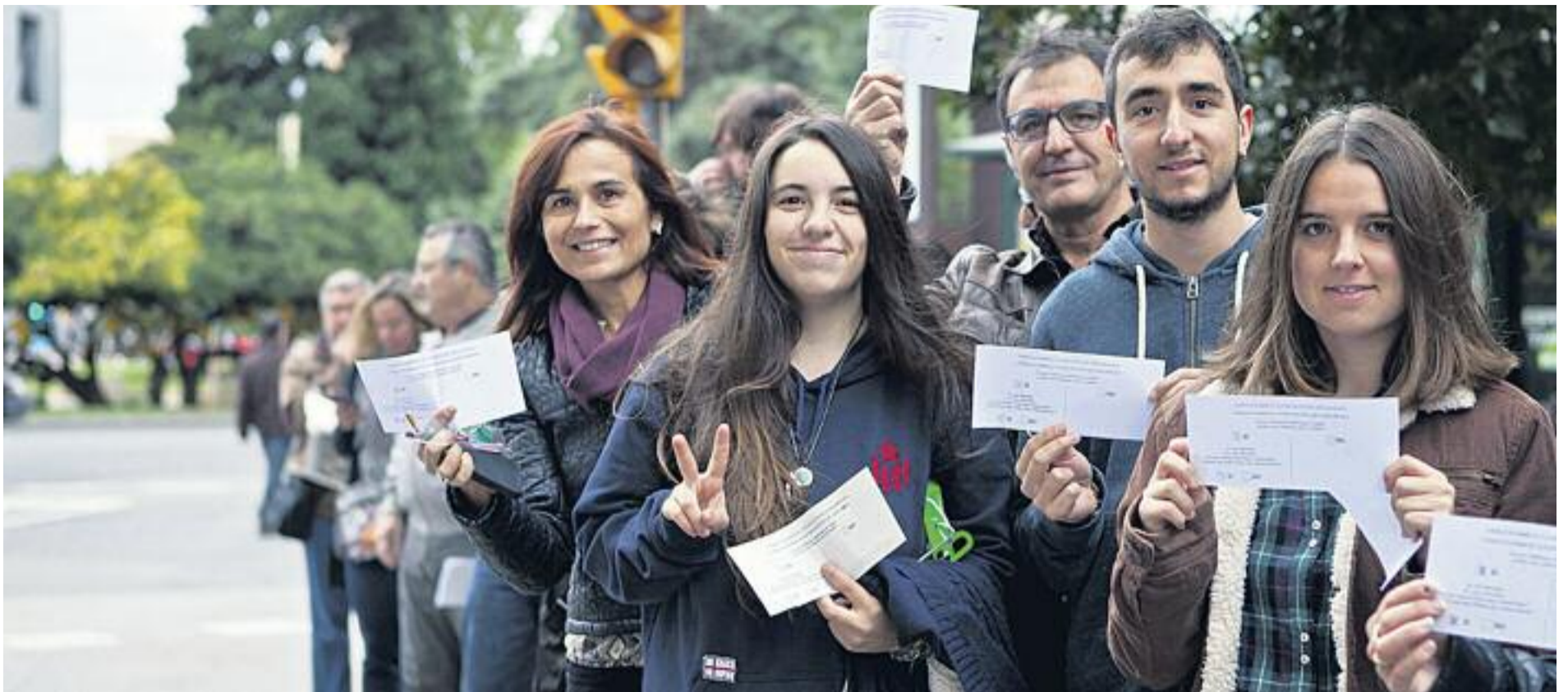
Més de 2,3 milions de catalans van participar en el 9N.