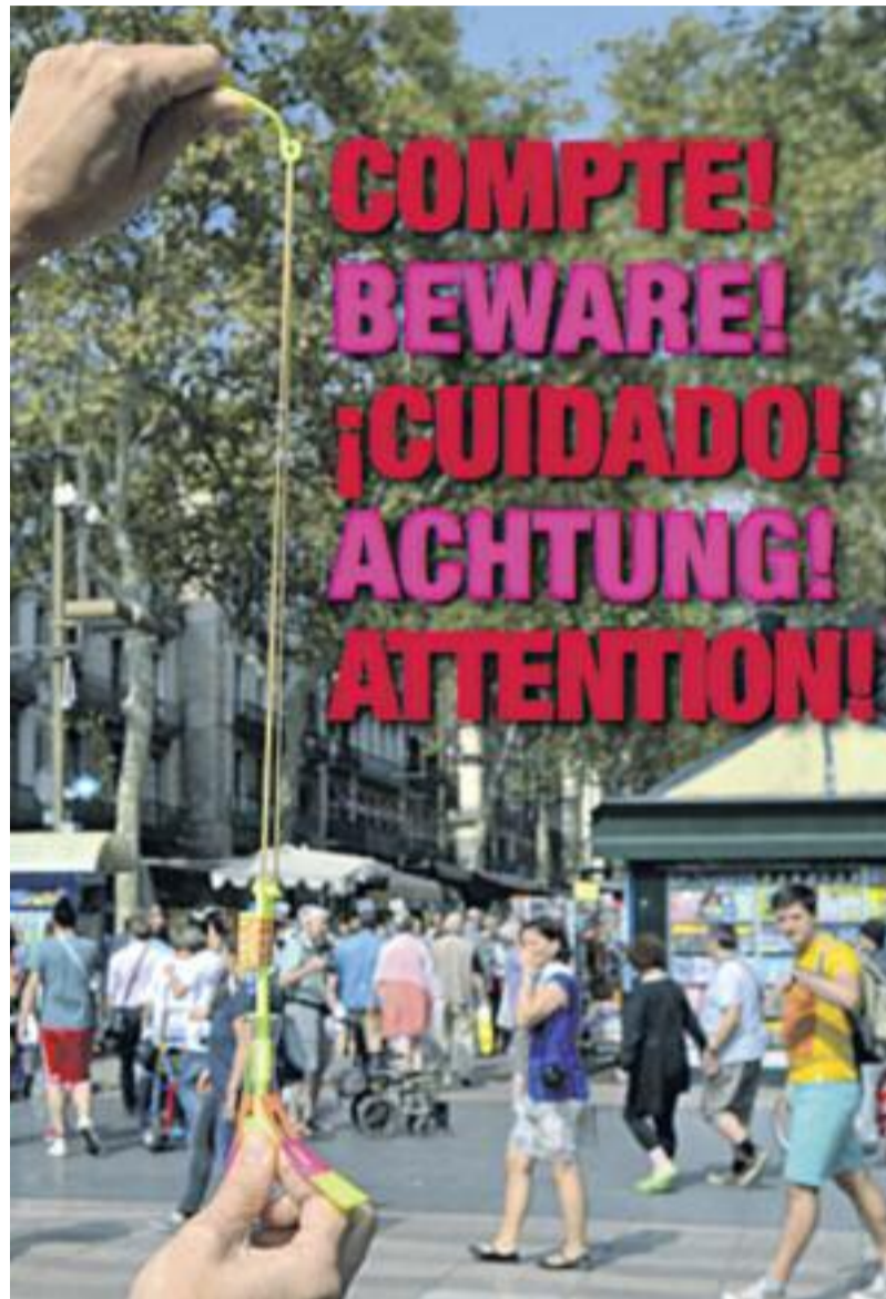
Cartell de la campanya (dreta) que s'implementarà a les zones on es detecta major activitat de venda d'helicòpters lluminosos i xiulets.