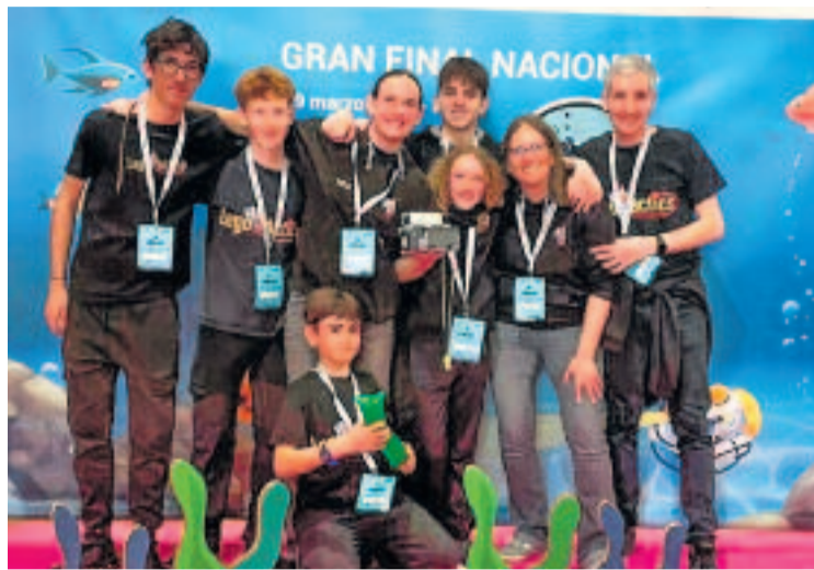
Legolàctics en la Gran Final espanyola a Ferrol.

Es tracta d'un premi que obre la porta a l'equip a participar en l'Open Internacional First Lego League Florida Sunshine Invitational, del 24 al 28 de juny. "Moltes gràcies a tots els equips per les experiències compartides i a l'equip de jutges i àrbitres pel reconeixement del nostre esforç