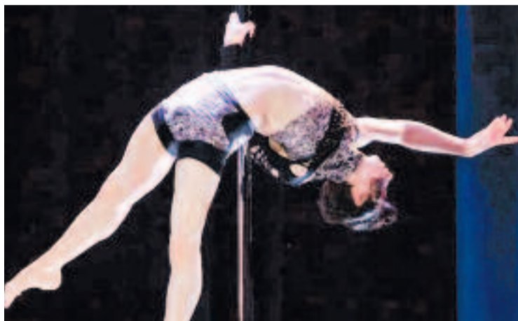
Una exhibició de l'escola en una imatge d'arxiu.

Isabel Farrés defineix la seva escola com “un referent i una pedrera d'artistes i d'acrobates destacats, alguns dels quals acaben triomfant i treballant en circs tan importants com el Cirque