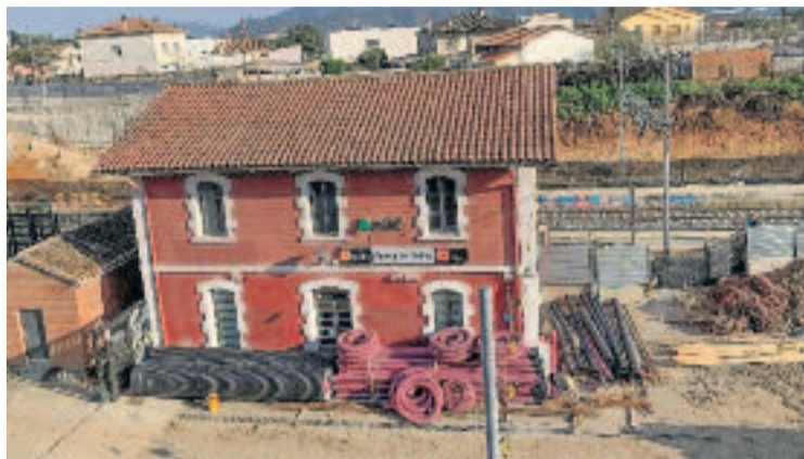
Estat actual de l'estació.