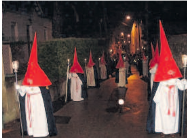
Moment de la processó del silenci.

Més enllà de la processó, també es va fer un canvi d'a-