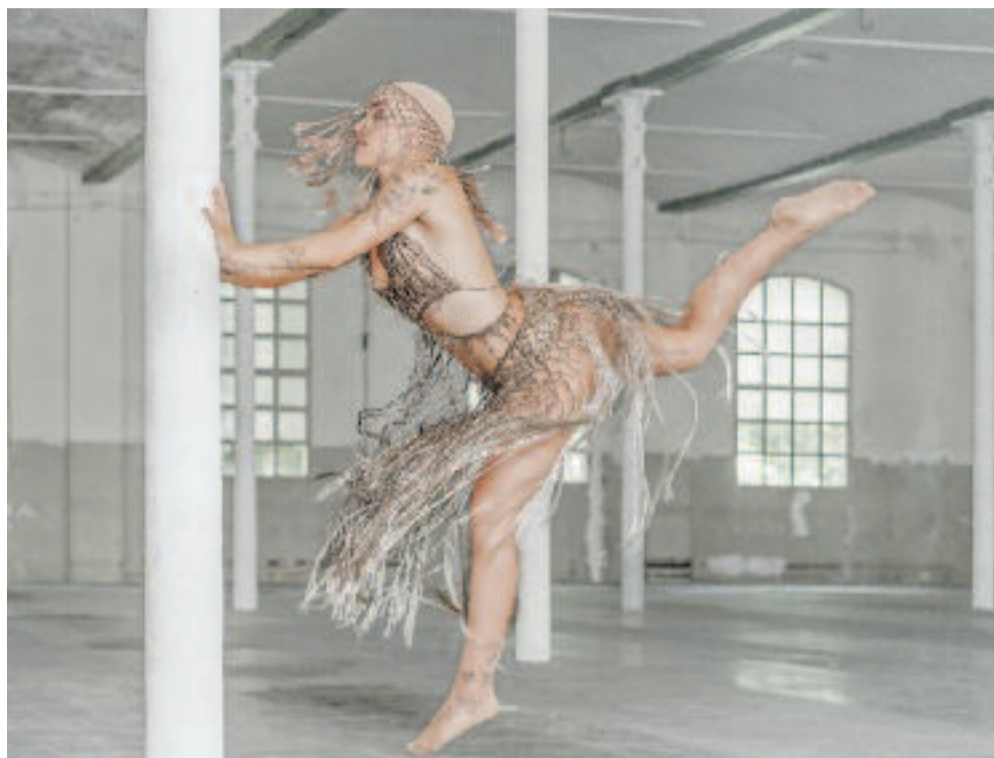
El vestit Cigne Blanc (esquerra) i el Cabaret (dreta).

zills, vam explorar formes fàcils per desenvolupar el que volíem fer, perquè nosaltres som perruquers i no modistes, i d'aquella primera idea vam acabar creant sis vestits", explica Carol a Línia Vallès .