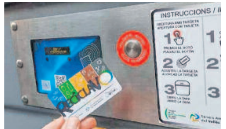
Targeta que s'ha de fer servir per obrir els contenidors.

Aquesta mesura respon a l'aplicació de la legislació que marca com a objectiu que la taxa de recollida selectiva arribi al 55% en aquest any. Per arribar-hi, prèviament, a principis de l'any passat, l'Ajuntament va canviar els contenidors de càrrega superior per nous de càrrega lateral, per fer més eficient el sistema de recollida i facilitar la separació de residus.