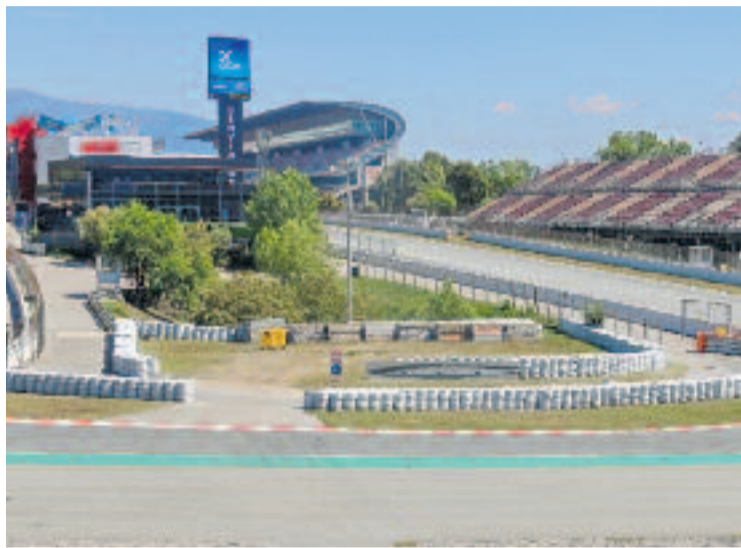
Per millorar un revolt del circuit es van talar arbres.

Ara, els nous arbres es plantaran tant dins del mateix Circuit