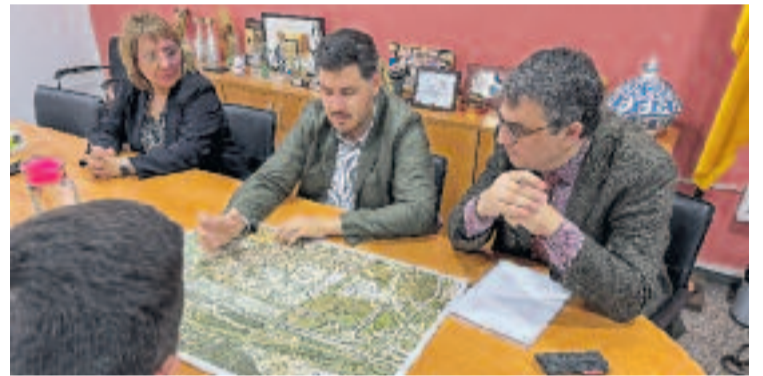
Moment de la trobada amb el Comissionat Carles Martí.

A finals d'abril, diversos representants del consistori es reunien amb el Comissionat per a l'impuls del millorament urbà del Govern, Carles Martí, per incloure la reforma dins la Llei de barris i rebre subvencions per tirar-la endavant. Martí assegurava que el projecte "respon als objectius de la llei" i l'alcalde, Óscar Sierra, celebrava la notícia. "Volem intentar fer un entorn més amable, verd i amb menys barreres arquitectòniques per a les persones, per fer una Llagosta més amable, més sostenible i amb més serveis per a les persones", deia el batlle.