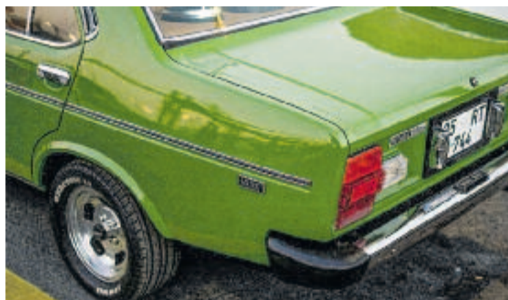
La plaça Pau Picasso serà l'epicentre de la trobada.

Per a poder participar-hi, els vehicles han de mantenir el seu aspecte original. A més, és imprescindible que comptin amb assegurança i que tinguin la ITV vigent.