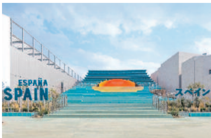
Exterior del pavelló d'Espanya a Osaka.

La companyia granollerina ha estat l'encarregada de dissenyar tota la façana de l'edifici en col·laboració amb els estudis d'arquitectura Enorme i Extudio. El pavelló s'inspira en el corrent oceànic anomenat Kuroshio, que flueix al llarg de la costa est d'Àsia i que està caracteritzat pel color fosc de l'aigua, i per accedir-hi cal pujar una escalinata en forma d'onada recoberta de les rajoles de Cumella. Aquestes juguen amb sis tonalitats diferents de blau per fer l'efecte d'onada, i amb una de groc per fer la forma del sol, situat al capdamunt.