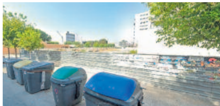
Solar del carrer Berenguer III, on es podrien fer 45 pisos.

HABITATGE ▶ La manca d'habitatge assequible és un problema que afecta la gran majoria dels municipis catalans i Mollet està entre ells. Les queixes de la PAH local i de la gent jove que intenta independitzar-se sense èxit són molt repetides a la ciutat.