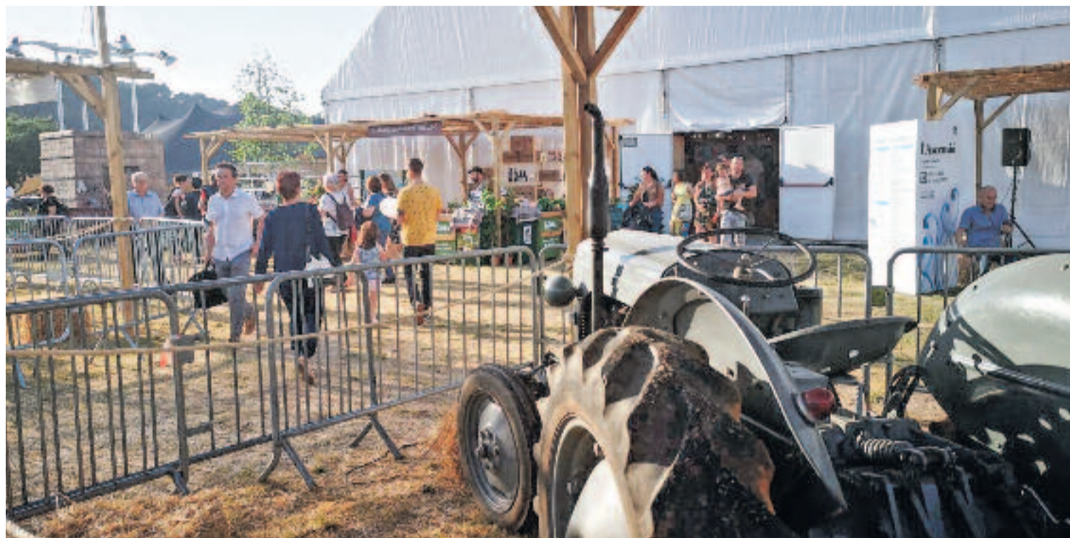
Imatge d'arxiu de la mostra 'Menjar Bé' situada al Parc Firal.

Més enllà de la mostra d'estands de productes, companyies i entitats relacionades amb ca-