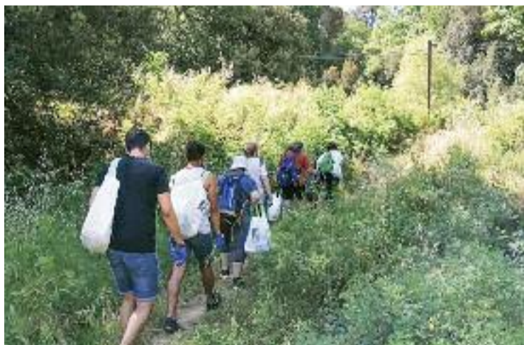
Alguns membres de l'entitat en una neteja al bosc.

"La sequera ha deixat centenars d'arbres morts que són un potencial combustible de cara a aquest estiu", detallen des de la Xopera. Per això, avancen que aquest any "podria ser el pitjor dels darrers 50" i asseguren que és "molt important que tots els habitants de Sant Fost prenguin consciència". "Un passeig en moto per un bosc sec, una cigarreta mal apagada, un descuit a la barbacoa, una acampada irresponsable o un vidre abandonat enmig dels matolls poden ser els detonants d'un incendi i,