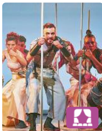
Tirant lo Blanc Joan Arqué

Aquesta adaptació teatral sobre el clàssic literari de Joanot Martorell agafa els capítols més èpics de les aventures del cavaller en el seu llarg periple per tornar a casa, a Constantinoble, des de les costes del nord d'Àfrica. La història narra perills, amors i conflictes relacionats amb la religió cristiana. L'obra es pot veure al Teatre Romea de Barcelona fins al 4 d'agost.