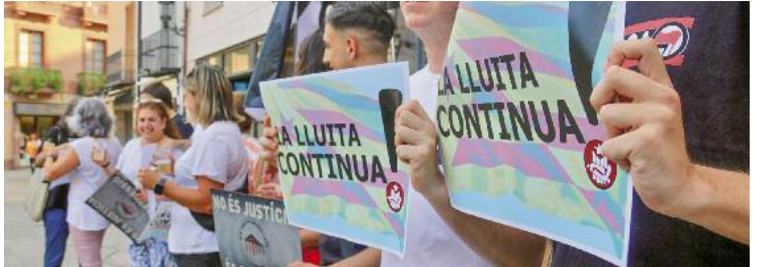
Moment de la celebració de l'aplicació de l'amnistia per als Tres de Granollers, a la Porxada.

"Acaba el patiment de tres famílies durant quatre anys", assenyala l'advocada dels joves, Norma Pedemonte, en un acte de celebració a la Porxada al qual