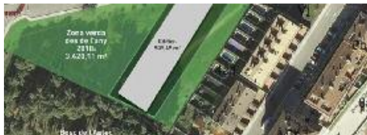
Mostra de la part edificable i no edificable del projecte.

"Malgrat que des de l'equip de govern, des de fa anys, s'ha informat del projecte de construcció i de les positives repercussions que té, encara avui algunes persones s'entesten, des de la mitja veritat i l'interès particular en defensar el que mai ha estat en perill, la zona