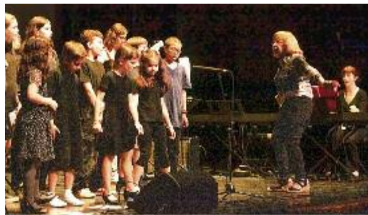
Moment de la celebració del 40è aniversari.

De la trajectòria de la guardonada, cal destacar que és cofundadora del centre Arrels de Santa Perpètua, on treballa com a logopeda especialitzada en veu. A banda, també és professora de Logopèdia a la Universitat Ramon Llull i treballa al Palau de la Música en qualitat d'investigadora, amb un futur molt prometedor al davant.