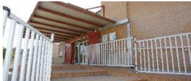
Imatge d'arxiu de l'actual CAP de Parets.