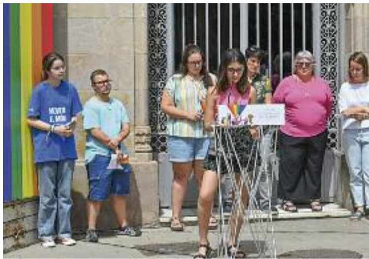
Un moment de l'acte institucional celebrat a Granollers.

Mentrestant, Mollet va viure, per primera vegada, una Festa de l'Orgull. Va ser multitudinària i va