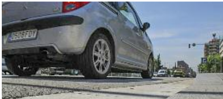
L'avinguda del Parc serà un dels carrers que delimiti la ZBE.

Aquest pas s'ajusta a la Llei de Canvi Climàtic i Transició Energètica, que estableix que les ciutats de més de 50.000 habitants com Granollers han d'implementar una ZBE abans del 2025, amb l'objectiu de reduir la contaminació ambiental. A la capital vallesana, la ZBE comprèn una superfície de mig quilòmetre quadrat delimitada pels carrers Roger de Flor, Prat de la