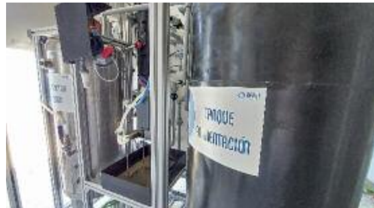
La planta pilot en qüestió.

D'altra banda, asseguren que "l'equip de govern no ha negat mai el diàleg al veïnat" i que està disposat a reunir-se "les vegades que calgui". Mentrestant, pel que fa al canvi d'ubicació que promouen els veïns, asseguren que "en aquest moment és inviable". "Ens obligaria a endarrerir tres anys el projecte, perdre l'ajuda i tornar a la casella de sortida", conclouen.