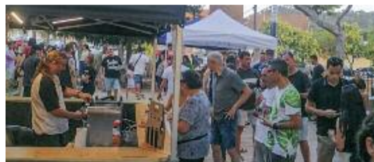
La Beer Fest de l'any passat va omplir Martorelles de vida.

tota aquesta informació a la ciutadania i de transmetre la necessitat de ser responsables al bosc, el conjunt d'entitats locals estan difonent un vídeo i un cartell a les xarxes, una acció que continuaran fent durant tot l'estiu. "No ens podem permetre per cap concepte un incendi, ja que donat l'estat del bosc per la sequera podria ser devastador", conclouen.