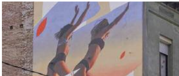
Mural de Dase a l'avinguda Llibertat.

ART ▶ L'artista molletà Dase opta a emportar-se un gran reconeixement internacional: un dels seus murals podria ser el millor del món entre tots els murals fets arreu del planeta al llarg del mes de juny. La plataforma mundial d'art urbà, Street Art Cities, l'ha nominat en el rànquing que presenta mensualment.