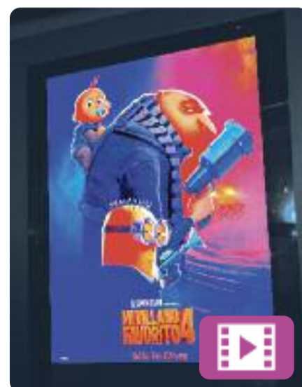
Gru 4. Mi villano favorito Patrick Delage i Chris Renaud

És la quarta entrega de la pel·lícula protagonitzada pels famosos Minions. A la trama apareix un nou membre a la família, Gru Júnior, que sembla arribar amb el propòsit de ser un suplici per al seu pare. En aquest cas, Gru haurà de combinar el paper de pare amb el d'heroi i enfrontar-se a un nou enemic, cosa que obligarà la família a haver de fugir.