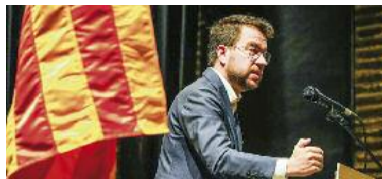
El president Aragonès, en la seva intervenció.

POLÍTICA ▶ El president de la Generalitat, Pere Aragonès, visitava Granollers el 25 de març per participar en el congrés comarcal d'ERC del Vallès Oriental, centrat a elegir els candidats republicans de la comarca per a les eleccions al Parlament del 12 de maig.