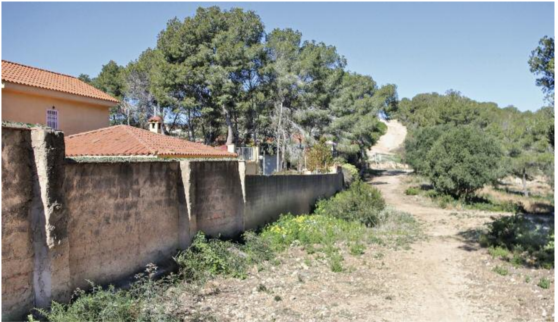
Imatge d'una franja perimetral d'una urbanització.

PREVENCIÓ ▶ Si bé la sequera ens ha posat al límit, hi ha diversos canvis socials que han augmentat progressivament el risc d'incendis als nostres boscos. És per això que la prevenció, tant la dels professionals com la de la ciutadania, és vital per minimitzar aquest risc inherent associat al progrés.