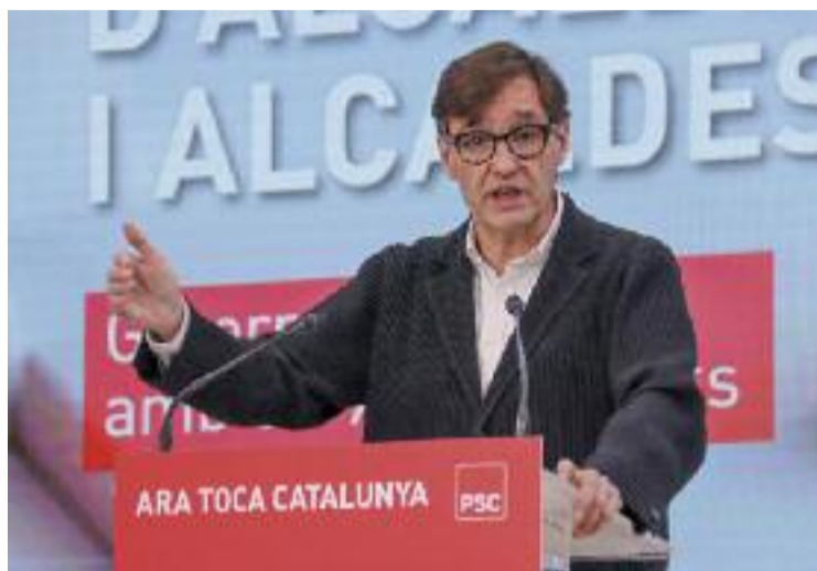
El roquerol Salvador Illa és el candidat del PSC.

Al bàndol socialista, l'exalcalde de la Roca i primer secretari del PSC, Salvador Illa, serà el candidat del partit per a les eleccions. En la llista per accedir