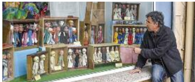
Presentació dels Aparadors dels Titelles.

CULTURA ▶ Com és habitual, amb l'arribada de la primavera i amb l'entrada del mes d'abril la capital baixvallesana s'omple de titelles, espectacles i gent d'arreu que s'apropa per gaudir de la Mostra Internacional de Titelles de Mollet. Enguany se celebrarà del 12 al 14 d'abril i comptarà amb la participació de 14 companyies nacionals i internacionals.