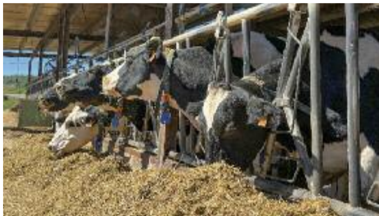
Imatge d'arxiu d'una explotació lletera.

"Ara mateix, ningú sap què passarà, perquè Danone no ens ha dit res més enllà que tanca la planta de Parets", lamenta Cassà. "Tot i això, fa temps que la nostra llet va a la planta de Danone a València i no a Parets, com passava feia anys i, per tant, si res no canvia, el tancament no ens hauria d'afectar", afegeix. Amb tot, el coordinador assegura que "quan una central de l'envergadura de Parets deixa de produir