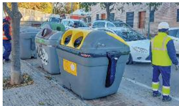
Els contenidors es podrien substituir a partir de l'estiu.

més s'obren amb una targeta que s'entregarà als veïns i que permetrà portar un recompte de les vegades que s'utilitzen per bonificar o incrementar els preus de les taxes de residus. Es tracta d'un canvi en la línia del que han fet altres municipis de la zona que ha de permetre a la localitat augmentar els seus índexs de reciclatge i apropar-se més, així, als barems que marca la Unió Europea. Tot plegat, però, no començaria a funcionar fins a finals d'any, ja que cal una feina informativa prèvia.