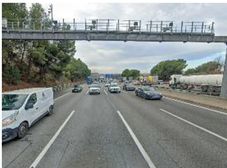
El radar posava 140.357 multes durant el 2023.

En comparació amb el segon radar que més multes va posar l'any passat a Catalunya, el que està situat a la C-31 a l'altura de