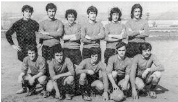
Foto de la Unió Esportiva Extremenya de Montmeló.

Pobles humils d'Extremadura, de Castella la Manxa, Castella i Lleó i d'Andalusia són l'origen d'una part destacada de la població de Montmeló que durant la dictadura, entre els anys 50, 60 i 70, van migrar cap a la ciutat vallesana amb l'esperança de guanyar-se millor la vida. Així ho recull Vinguts del món , el cinquè documental de la sèrie, que s'estrenava el passat mes de març. "Montmeló ha estat un municipi d'acollida d'homes i dones nascuts fora de Catalunya, i el caràcter i el