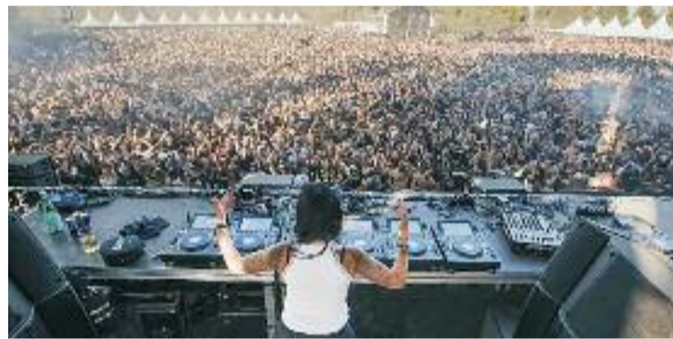
El festival se celebrava a tocar del Circuit.

Davant de tot plegat, des de la plataforma 'No ens vendreu la moto' alertaven que el festival techno es va celebrar "al pitjor indret possible". "A banda dels decibels, és a un turó elevat i orientat al nord-est. Per tant, el soroll es propaga nítid a quilòmetres de distància", explicaven.