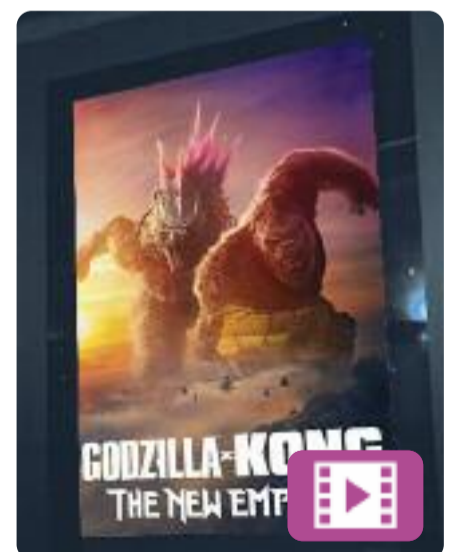
Godzilla i Kong: el nou imperi Adam Wingard

El film narra la batalla de Kong i Godzilla contra una amenaça desconeguda que vol acabar amb el planeta. Les seves mateixes històries personals i orígens seran la clau per vèncer l'enemic a l'èpica Illa Calavera, escenari de les darreres pel·lícules de King Kong. Rebecca Hall, Brian Tyree Henry i Dan Stevens en són els protagonistes principals.