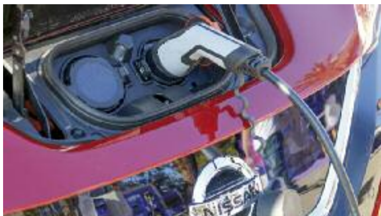
L'empresa gestionarà els punts de recàrrega de cotxes.

Granollers Energia SA, que és el nom que rebrà, es dedicarà, principalment, a produir i vendre energia tèrmica i elèctrica provinent de fonts d'energia renovable. A més, també s'encarregarà de la prestació de servei dels punts de recàrrega de cotxes elèctrics, de promoure l'ús de les energies renovables entre la ciutadania i de vetllar per reduir els gasos d'efecte hivernacle a la ciutat. Una altra tasca destacada que farà serà la construcció, explotació i manteniment d'instal·lacions dedicades a generar energies renovables, com per exemple les dues plantes