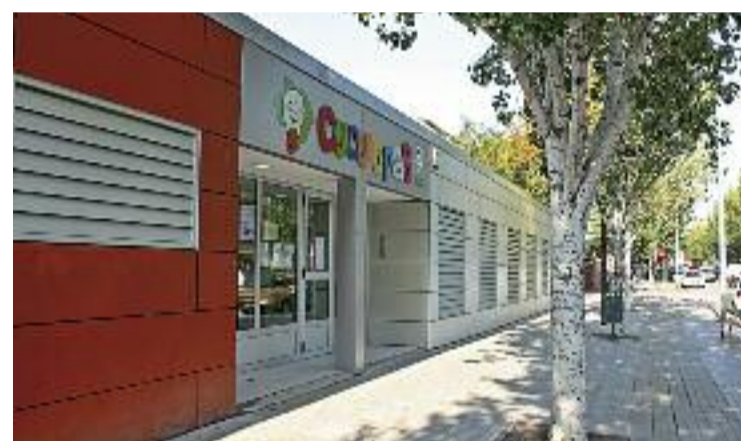
En total s'ofereixen 60 places per al curs que ve.

Per a aquells qui vulguin connectar l'escola abans de la matriculació, a partir de dilluns 8 d'abril es faran portes obertes. Per acudir-hi, però, s'haurà de tancar abans la cita amb el centre, contactant per telèfon o per correu electrònic.