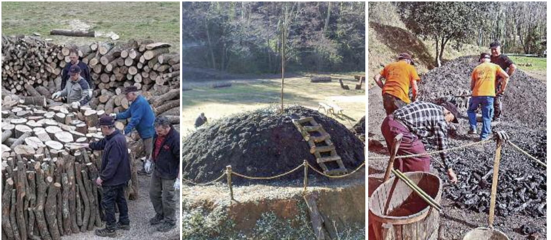
D'esquerra a dreta, procés de carboneig des que es crea la pila carbonera fins que s'aconsegueix el carbó.