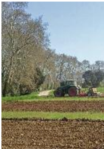
Conreu de Gallecs.

Segons detallen en un comunicat, renunciar als terrenys "atempta contra la viabilitat de les explotacions agràries i pot comportar-ne el tancament de la majoria". En aquest sentit, lamenten que, mentre es facin tots els tràmits, les terres hauran d'estar sense conrear-se i es queixen que totes les decisions preses per part de l'Incasòl i del Consorci s'haurien pactat "d'esquena a la pagesia".