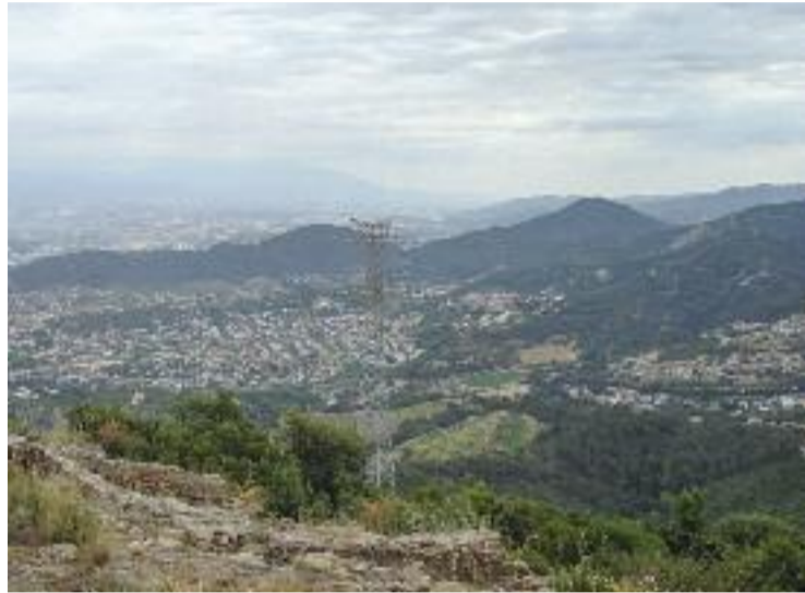
Panoràmica general de la comarca.

Una diferència de més de 200 euros que divideix dos municipis veïns que, malgrat fer frontera, representen dues realitats oposades en el marc de la subcomarca del Baix Vallès. Aquestes dades actualitzades també ofereixen informació referent als contractes signats als municipis del Baix Vallès de l'abril al juny. En concret han estat prop de 820, dels quals la meitat han estat subscrits a Mollet -406 en concret-. Montornès, amb 125, ocupa la segona posició, mentre que Parets -amb 98-, la