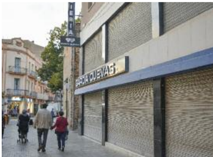
Garcia Cuevas va ser l'últim comerç històric a tancar.

Un exemple clar es veurà amb l'històric Forn de Ca l'Espinas, on pròximament obrirà la marca General Optica, i també amb la botiga de la llar Crack, on obrirà un outlet de roba. Amb tot, continuen buits altres comerços històrics que també han tancat aquest any com la joieria Garcia Cuevas, Pimkie, que feia molts anys que estava ins-