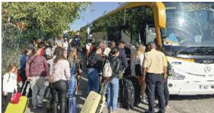
S'ha posat un servei de bus alternatiu.

La plataforma Perquè No Ens Fotin el Tren ha creat una llista dels problemes detectats entre els quals destaquen la desinformació que hi ha pel que fa als horaris dels busos, les parades i la validació dels bitllets, la falta de busos directes a primera hora del matí i la durada dels trajectes. "Els busos que paren a cada estació allarguen molt el temps de viatge perquè des del Figaró a Mollet tarden una hora i mitja i des de