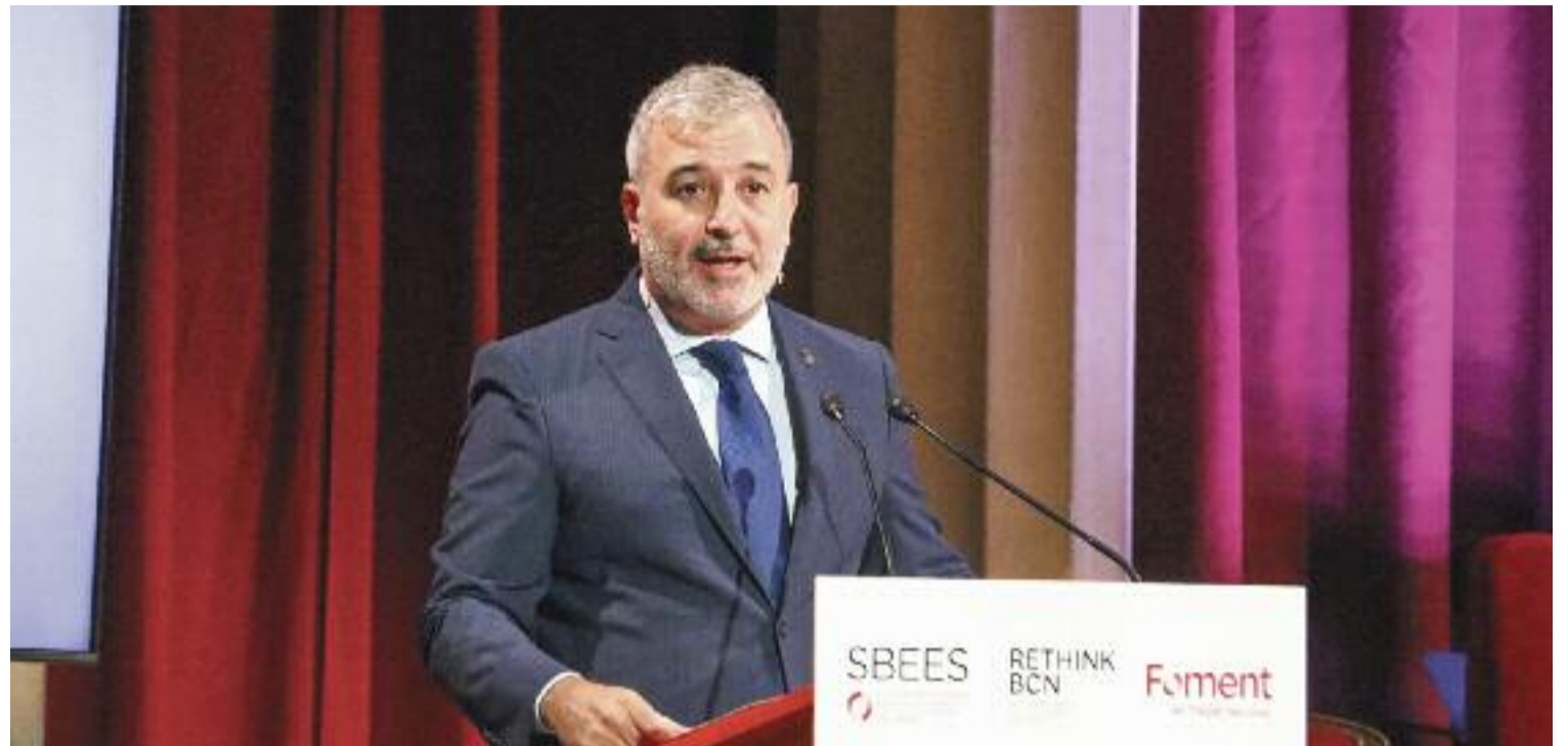
L'alcalde de Barcelona, Jaume Collboni.

Segons l'associació, la Regió Metropolitana té tres visions diferents: la de Barcelona ciutat, la de l'Àrea Metropolitana i la de l'Arc Metropolità. "Són tres visions amb interessos que no sempre convergeixen, però que necessàriament han de parlar-se per establir llaços, estratègies i governances compartides", detallen en el comunicat. Aquest escrit també recorda que l'Arc Metropolità va néixer arran de la manca real d'aquesta visió metropolitana,