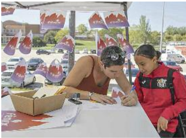
Un estand del projecte a la Fira de Comerç.