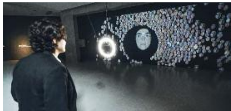
Exposició d'Anaisa Franco.

CULTURA ▶ El Festival Panoràmic d'enguany donava el tret de sortida ahir al vespre. S'inaugurava amb la conferència Repensar el rostre , a càrrec de l'artista Andrés Hispano, i tot seguit, amb la primera visita a les exposicions. Totes elles giren al voltant del concepte del rostre i de la seva representació en la fotografia i el cinema, i a través d'elles es pot fer un recorregut des dels primers retrats fins a aquells que estan fets per la intel·ligència artificial.