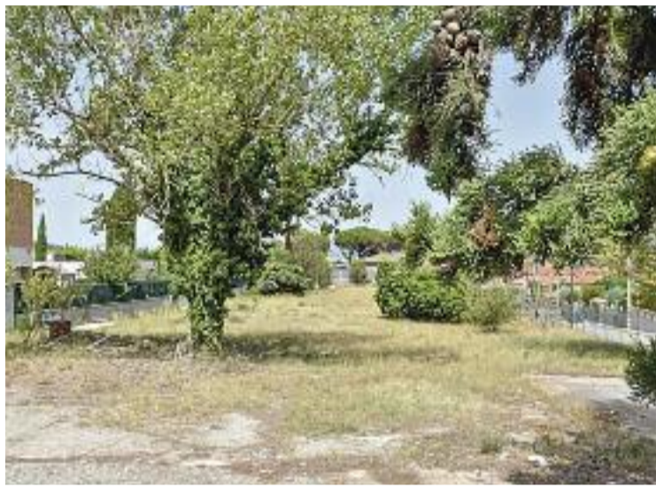
Parcel·la on s'han de construir els pisos.

Des del primer moment els veïns de la zona es van mostrar contraris al projecte perquè trencaria amb la imatge urbanística de la zona conformada majoritàriament per cases unifamiliars. Alhora, diuen els veïns, podria provocar problemes d'aparcament. Davant d'aquesta situació, van penjar pancartes en les quals es podia llegir "zona residencial, sí, blocs de pisos, no".