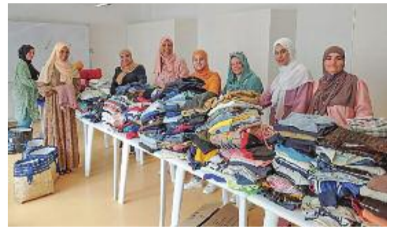
Roba recollida i voluntàries.

El material recollit es va traslladar a la mesquita de Martaró, des d'on s'han organitzat els enviaments d'ajuda cap a les zones afectades pel sisme del país alauita.