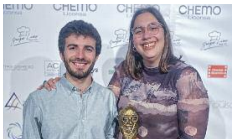
Boquet i Moragriega amb el premi Pícazo.

D'altra banda, cal destacar que una altra vallesana serà candidata als Goya en la categoria de millor curtmetratge documental. Es tracta de la molletana Neus Ballús, amb el seu curt Blow!