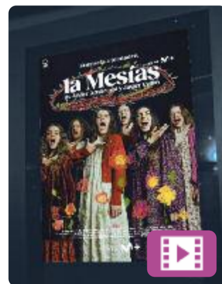
La mesías Javier Ambrossi i Javier Calvo

El vídeo viral d'un grup de música pop cristiana format per diverses germanes impacta en la vida de l'Enric, un home turmentat per una infància marcada pel fanatisme religiós i el jou d'una mare amb deliris messiànics. Els directors coneguts amb el nom de "los Javis" s'inspiren en el grup real Flos Mariae per narrar aquesta història colpidora rodada a Catalunya.