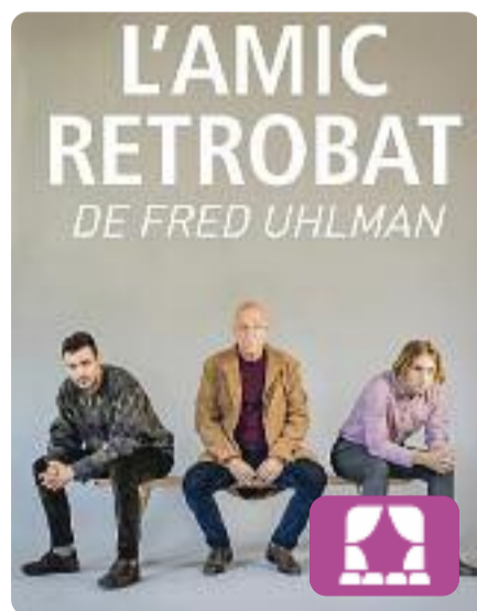
L'amic retrobat Fred Uhlman

L'amic retrobat relata a través de la veu d'un home adult, Hans Schwarz, fill d'una família jueva, la mateixa història d'amistat de fa més de tres dècades amb Konradin Von Hohenfels, fill d'una família aristocràtica de Suàbia. Els nois es coneixen a l'escola més famosa de Württemberg i inicien una intensa relació. Al Teatre Goya de Barcelona.