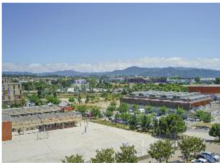
Escola Lluís Piquer.