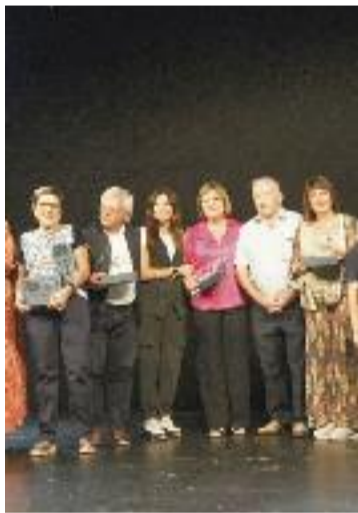
Alguns dels guardonats.

Els premiats que fa més anys que tenen activitat a la ciutat són l'empresa de materials de construcció i mobiliari Serme Concept, amb 132 anys de trajectòria, i Calçats Angulo, amb 115. Els segueix l'agència de viatges de 67 anys International Travel Consulting, Calçats Bambi i Espai Decora, amb 60, Llegums Pepita i la botiga de roba Carmen Foz, amb 54, Decoració Licos amb 50 i la joieria Albert Pous amb 33.