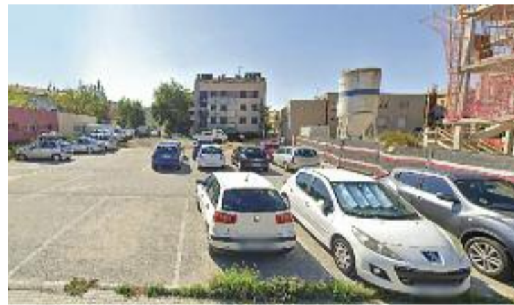
Els pisos es faran al carrer del poeta Joan Maragall.

El projecte té un pressupost estimat de quasi tres milions d'euros dels quals un 15% són dels Fons Next Generation i el 85% restant anirà a càrrec de l'Incasol. Així mateix, l'obra contempla una reserva de més del 25% dels habitatges per a joves fins a 35 anys i una reserva de fins al 25% dels habitatges per a persones vulnerables. "La resta d'habitatges s'adjudicaran d'acord amb el reglament que marcarà els criteris d'accés amb la intenció de prioritzar joves i gent gran", diuen des de l'Ajuntament.