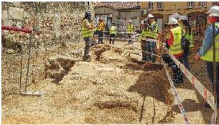
Imatge d'arxiu d'una visita guiada a la zona.

Cal recordar que les restes s'han trobat mentre es feien les obres a l'entorn de l'església amb l'objectiu de pacificar els carrers del voltant. Van començar al març amb una durada prevista de sis mesos, però ara s'han endarrerit i, segons Bertran, continuen a un ritme més lent. "Encara queden