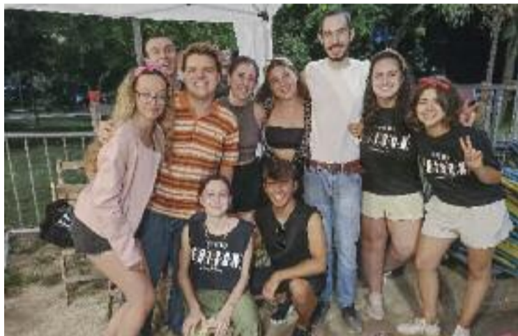
Membres de La Crida Edison.

En aquest sentit, cal recordar que a principis de l'any passat, l'Associació Cultural obria una convocatòria dirigida a joves de la comarca amb inquietuds cinematogràfiques, amb la voluntat de crear un espai on poguessin trobar-se, compartir interessos i eines que els ajudessin a tirar endavant els seus propis projectes audiovisuals. El resultat era la formació de La Crida Edison, un grup que naixia per participar en la programació, l'organització i els projectes del Cinema Edison,