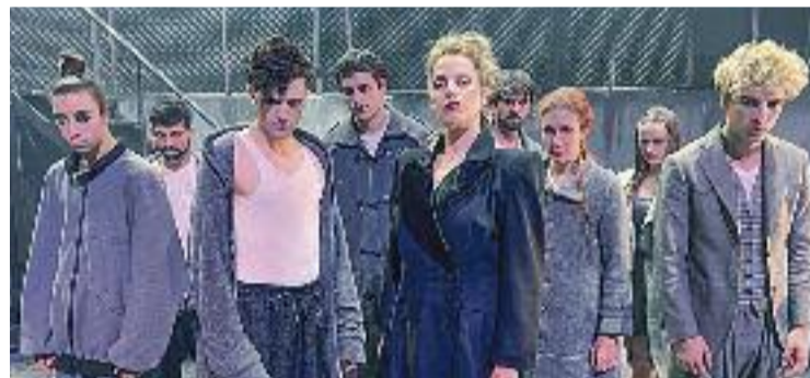
Dagoll Dagom.

CULTURA ▶ La nova temporada d'espectacles de la programació Escena Gran donarà el tret de sortida demà. En aquest primer cap de setmana cultural des del Teatre Auditori han apostat per oferir dues de les funcions més potents de la temporada com són la del grup teatral Dagoll Dagom i la de la cantant Dàmaris Gelabert.