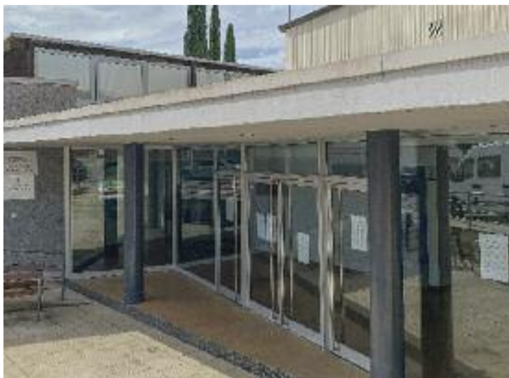
La piscina municipal, tancada.

Ara, quatre mesos després, han començat aquestes obres. "En aquest impàs s'ha estat protegint l'equipament amb la col·locació de xarxes i també s'ha fet el projecte bàsic i les gestions tècniques pertinents per poder començar l'obra", asseguren des de l'Ajuntament. Preguntats per la durada dels treballs, però, el consistori no dona detalls al respecte ni tampoc si es proposaran o no solucions alternatives o compensacions per als usuaris de la piscina mentre s'allarguin les obres.