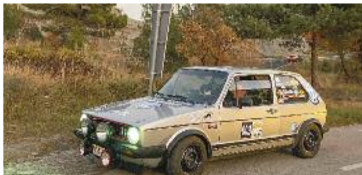
Enguany se celebra la desena edició de la trobada.

L'esdeveniment, que gira al voltant dels cotxes d'època, té l'honor de celebrar la seva primera dècada i es farà a la ronda del Pedregar i a la zona del polígon industrial, de la mà del Clàssic Club Montmeló. Així, els assistents podran viure en primera persona nombroses activitats entre les quals destaquen la possibilitat de conduir un clàssic al Circuit de Barcelona-Catalunya. Prèvia inscripció, els pilots més nostàlgics podran rodar per l'asfalt del circuit en voltes guiades amb els seus propis vehicles o fer-ho en tandes guiades a major velocitat amb cotxes i motos fabricats abans del 1993. Així mateix,