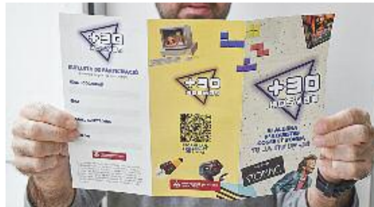
La primera edició del +30 kosmos va ser un èxit.

A més, la trobada comptarà amb una llotja del motor, el Retromarket per comprar i vendre vehicles històrics, esmorzar de brasa i música en viu.