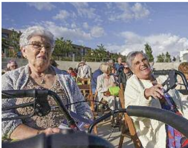
Imatge d'arxiu de l'homenatge a la gent gran.

Una de les activitats amb més participació va ser l'excursió de dimecres al monestir de Sant Benet de Bages, a la qual es