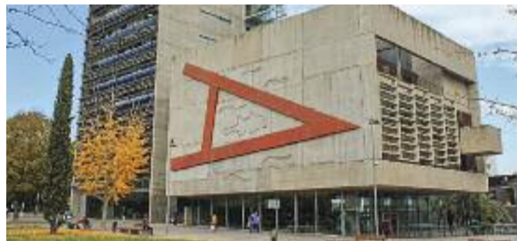
Imatge d'arxiu de l'Ajuntament de Mollet.

SOCIETAT ▶ Mollet liderarà la xarxa europea DIGI-INCLUSION, que té com a objectiu impulsar la inclusió digital. La tasca de la capital baix vallesana serà treballar per facilitar l'accés a la tecnologia a tota la societat i també afavorir el desenvolupament de les habilitats necessàries per poder aprofitar al màxim les oportunitats que ofereix el món digital.