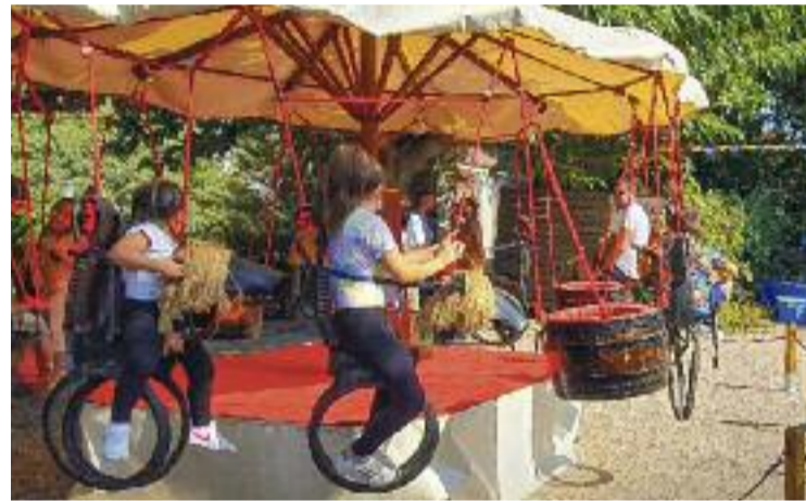
Atraccions de la Festa del Patró.

Les seves filles, de fet, van ser les encarregades de descobrir una placa d'homenatge a Safont, locutor històric de l'emissora que va mostrar un fort compromís pel seu poble i per la seva cultura i esport.