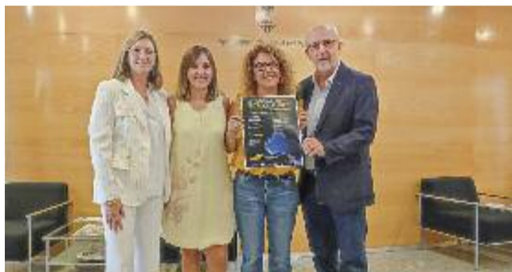
Acte de presentació del festival.

Pel que fa a la programació, entre els concerts més destacats hi ha el de la Mollet Jazz Band i el del quintet Daahoud Salim Quin-