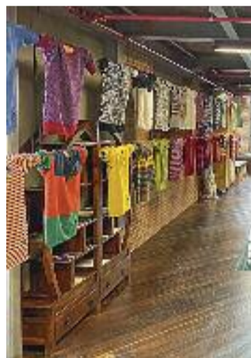
Jerseys laios.

la 10a Setmana del Cineclubisme Català. També serà reconeguda la distribuïdora cinematogràfica i excol·laboradora del Cineclub AC Alba Molas, que rebrà el premi a persona relacionada amb els cineclubs catalans, i Alcarràs que ha estat escollida com la millor pel·lícula catalana d'enguany.