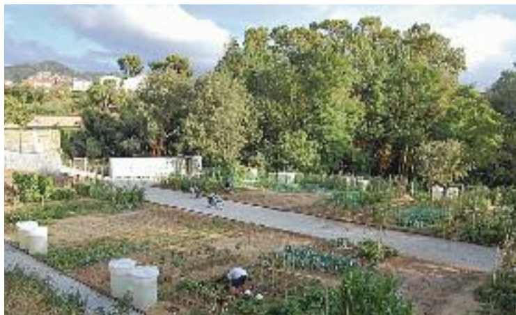
Els horts hauran d'anar a un altre lloc.

D'aquesta manera, si a partir d'aquella data alguna de les parts, sigui la societat o el con-