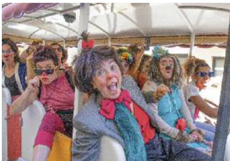
Pallasses en una imatge d'arxiu.