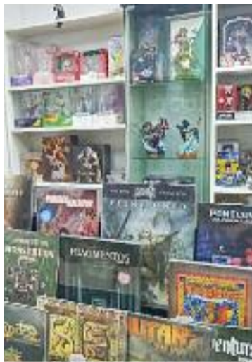
Botiga.