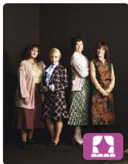
La dona fantasma T de Teatre

La dona fantasma gira al voltant de quatre mestres a finals dels anys setanta. Porten una vida intensa i melancòlica, marcada per la cura dels pares i dels fills, pels desenganys amorosos i pels desafiaments que els provoquen les seves alumnes. L'extraordinari irromp en aquesta quotidianitat esglaiadora: una dona fantasma. Al Teatre Romea de Barcelona.