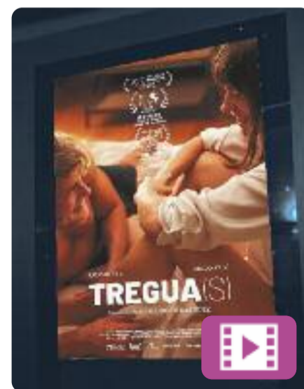
Tregua(s) Mario Hernández

L'Ara i l'Edu són amants des de fa una dècada, des que eren una actriu i un guionista novells. Al marge de les seves relacions "oficials", sempre troben un moment per estar junts, un oasi en les seves vides. Després d'un any sense veure's, es retroben en un festival de cinema, però ni tan sols aquesta treva està lliure de les mentides i nostàlgies de la vida real.