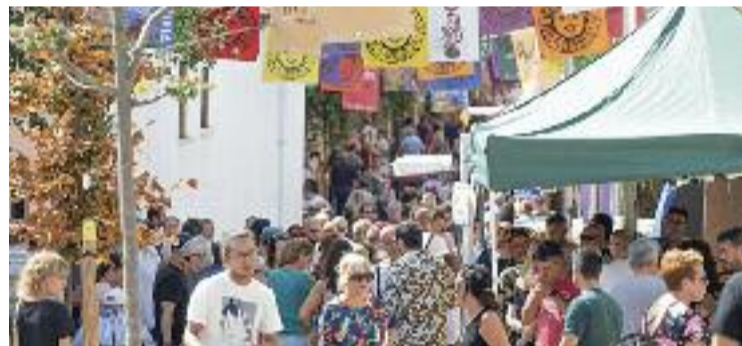
Fira d'enguany.