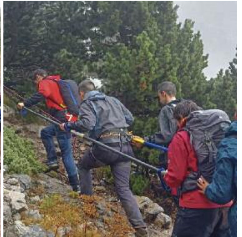
Per moure una cadira joëlette cal un mínim de 10 persones i per una barra direccional, almenys 8.

diferents a desenvolupar-se a la natura i, en aquest sentit, hi juga un paper clau la figura del voluntari. Són els encarregats de preparar-los per pujar els cims i, a la vegada, d'ajudar-los a fer-ho possible, sigui portant les cadires joëlette o les barres direccionals per guiar persones cegues. El mateix club els ofereix formacions per aprendre-ho a fer.