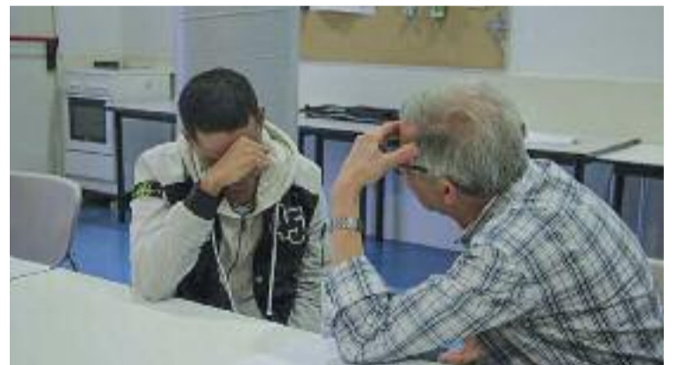
Els mentors acompanyen persones migrants.

tecció Civil va constar d'altres activitats. A les onze del matí del mateix dissabte, hi va haver una exposició de vehicles d'emergència al carrer de l'Estació i, més tard, el parc Popular va ser l'escenari de diverses exhibicions canines.