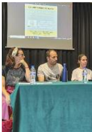
Ponents de la xerrada.