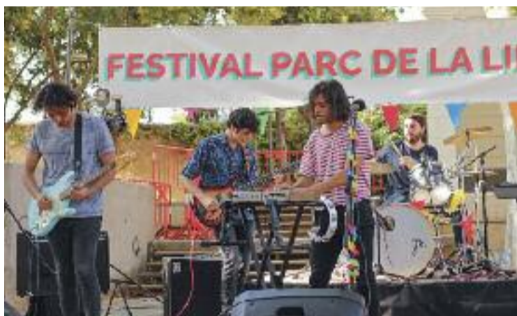
Imatge d'arxiu d'un grup tocant al festival.