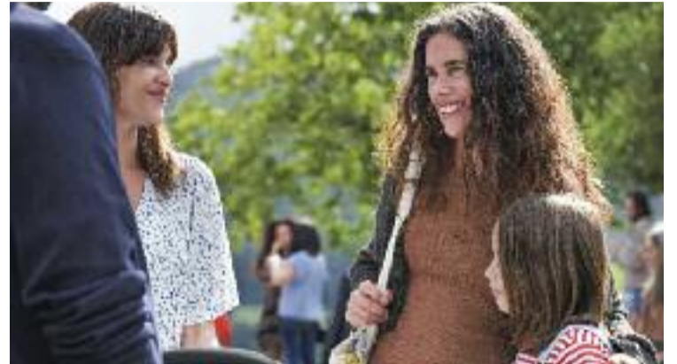
Imatges de la pel·lícula.

algú, organitzem un partit", explica la veïna. "Ho fem per recaptar diners si es tracta d'una persona de fora, per poder repatriar el seu cos, però també per recordar-lo", afegeix. Sens dubte, serà el partit més trist que viurà el barri barceloní. Així mateix, l'Antonio explica que el regidor d'Esports de Barcelona va visitar ahir dijous el barri per mostrar el seu condol a la família de l'Àlex.