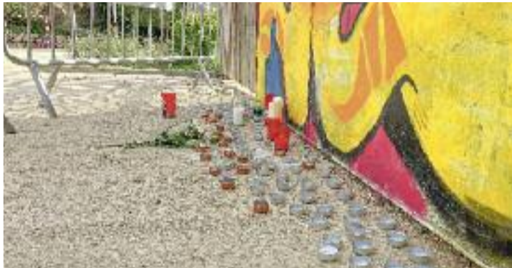
El 14 de setembre els amics van fer un homenatge al difunt.