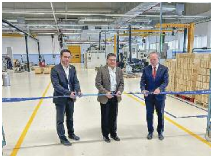
Les autoritats tallen la cinta per inaugurar l'ampliació.