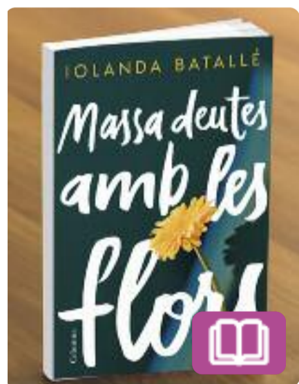
Massa deutes amb les flors Iolanda Batallé

Una dona en crisi s'instal·la en una casa a les muntanyes amb l'esperança de refer-se escrivint en solitud. No preveu, però, que les persones ferides es reconeixen i s'ajuden, i és així com serà acollida per una família després d'una vivència colpidora. Conversa rere conversa, l'escriptora reconstruirà una història familiar que és un cant d'amor a la vida al Pirineu.