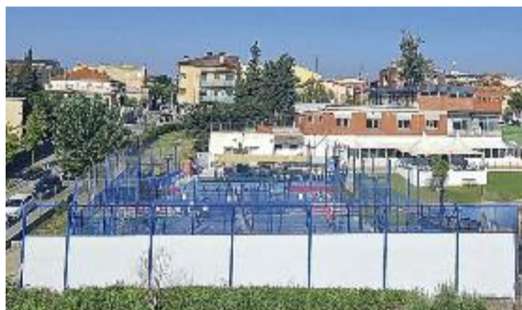
Pantalles instal·lades a COREFO.