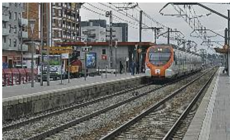
Imatge d'arxiu de l'estació de Mollet-Sant Fost.

D'altra banda, i coincidint amb el darrer dia de l'exposició, dijous que ve Can Borrell acollirà una segona proposta. Es trac-