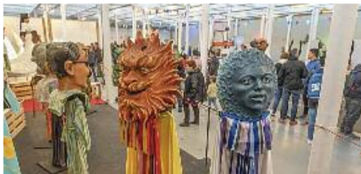
Imatge d'arxiu d'una exposició anterior.

CULTURA ▶ Un cop acabada la Festa Major, tots els elements festius que hi participen tornen a Roca Umbert, que és l'espai que els acull durant l'any. Com és habitual, però, abans de guardar-los es farà una exposició amb tot el bestiar i els grups folklòrics, i enguany aquesta mostra serà especial amb motiu dels 40 anys de la festa de Blaus i Blaus.