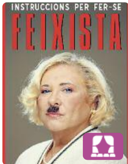
Instruccions per fer-se feixista Michela Murgia

L'assaig de Michela Murgia és tota una provocació. Un text ple d'ironia sobre la perillosa propagació dels populismes a les nostres societats. Mercè Arànega es posa a la pell d'aquesta escriptora i activista italiana per convertir-se en la protagonista d'un monòleg que denuncia l'actual onada de feixisme.