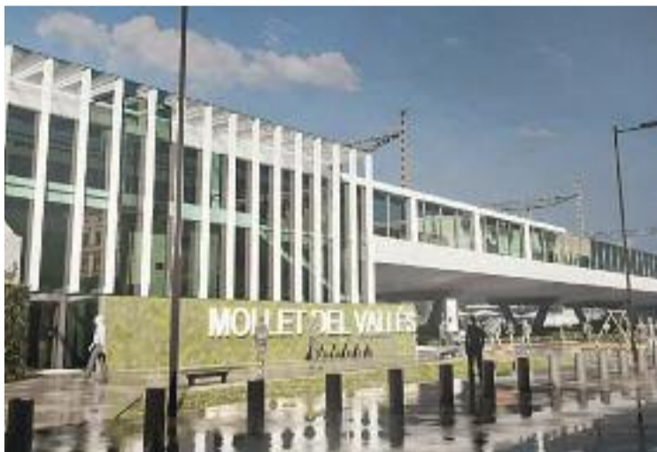
Així serà la nova estació.

MOBILITAT ▶ Mollet tindrà una nova estació de tren amb les vies integrades a la ciutat. Ho avançava divendres la ministra de Transports, Raquel Sánchez, en una visita a Mollet que va servir per anunciar la licitació del doblement d'un tram de 2,8 quilòmetres de l'R3 entre Mollet i Parets. Aquest projecte també inclou el trasllat de l'estació de Mollet-Santa Rosa a l'entorn de la Rambla Nova, uns 750 metres al nord de la posició actual.