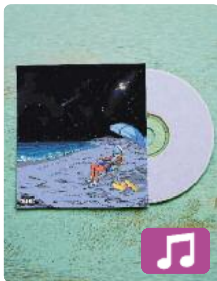
Playa Saturno Rauw Alejandro

Rauw Alejandro està disposat a ser un dels artistes més escoltats aquest estiu amb el seu nou àlbum, Playa Saturno . El single que va estrenar com a avançament del disc és Baby hello , amb l'exitós productor Bizarrap, però l'àlbum també inclou una sorprenent col·laboració amb Miguel Bosé, Si te pegas . No hi ha, en canvi, cap cançó amb la seva parella, Rosalía.