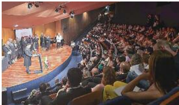
Acte de celebració del centenari.

Amb motiu del seu centenari, divendres, dia de Sant Raimon de Penyafort, patró dels advocats, se celebrava un acte al Teatre Auditori de Granollers que commemorava aquesta efemèride. "Va comptar amb un reconeixement als nous togats, als advocats que fa més de 25 anys que estan al