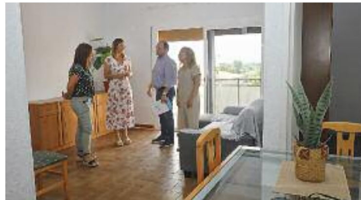
Visita al pis cedit a la fundació.