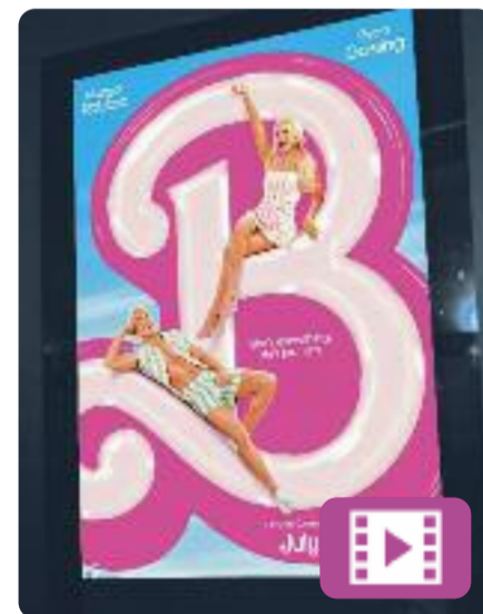
Barbie Greta Gerwig

Arriba la pel·lícula més esperada de l'estiu, després d'una promoció inigualable. En aquest film de Greta Gerwig, la famosa nina Barbie abandona Barbieland (on té una vida perfecta) per anar al món real. En Ken, com no podia ser d'una altra manera, decideix acompanyar-la. Però quan el CEO de Mattel descobreixi que s'han escapat, intentarà retornar-los a la caixa.