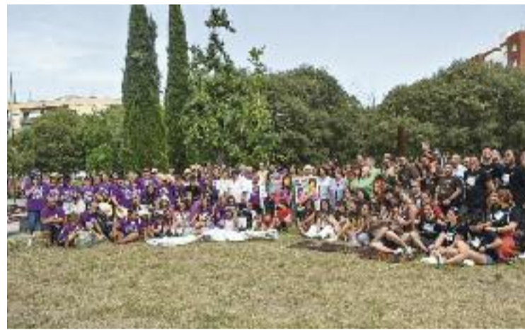
Presentació del programa.

D'altra banda, ahir començava la Festa Major de Gallecs, que s'allargarà fins diumenge, amb quatre dies d'activitats per a tots els públics.