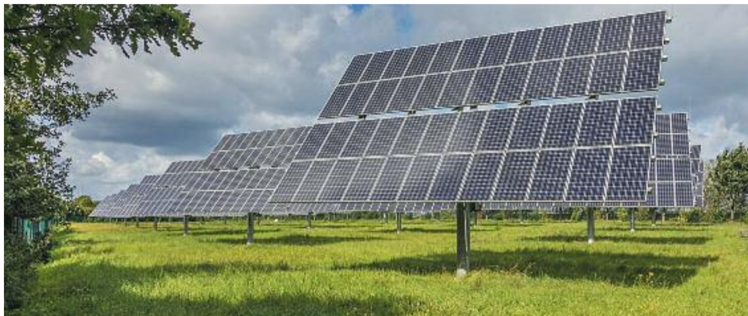
El pla preveu instal·lar parcs solars i eòlics a sòl no urbanitzable i altres tipus de sòl.