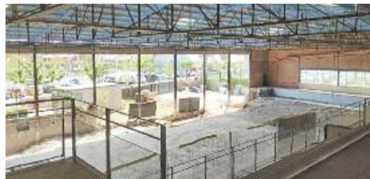
Les obres es van aturar el maig del 2022.

EQUIPAMENTS ▶ Les obres de renovació de les piscines velles del Club Natació Granollers ja tornen a estar en marxa. Es reprenien dimarts després d'haver estat aturades 14 mesos per la renúncia d'Abolafio, l'adjudicatària, davant l'augment del preu de les matèries primeres. Això obligava a tirar endavant una nova licitació que ha implicat un augment del cost de l'obra de gairebé 2 milions d'euros i la redacció d'un nou projecte. En concret, el pressupost ara s'enfila fins als 6 milions.