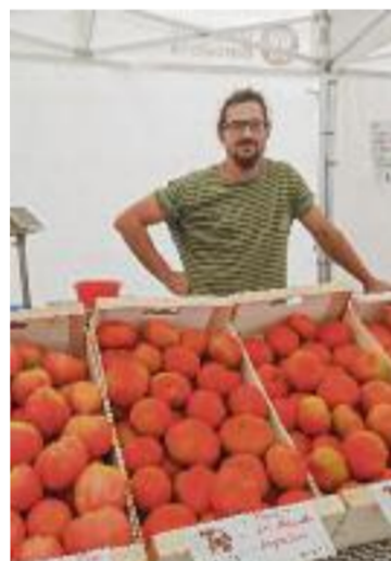
Fira 2022.

Sobre la trajectòria, des de la institució expliquen que "durant aquests 100 anys d'història, el col·legi ha evolucionat conjuntament amb la societat i ha participat activament en la millora i en la construcció d'una societat més justa". "Estem orgullosos dels èxits aconseguits fins ara i esperem continuar avançant i creixent en els pròxims anys", sentencien.