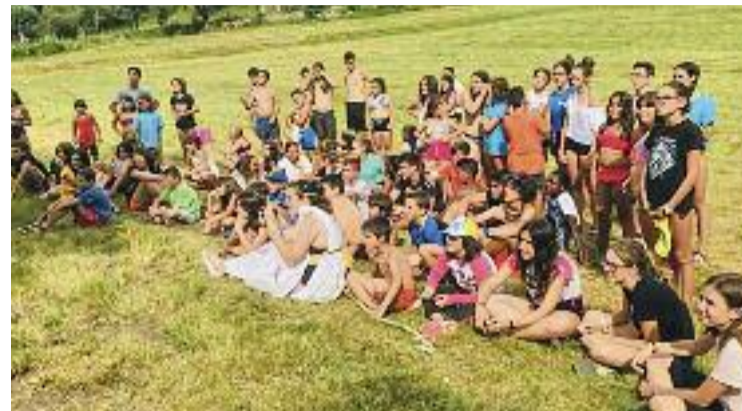
Les colònies s'havien de celebrar a partir del 30 de juliol.

ciar que cancel·lava la celebració de l'esdeveniment musical al Circuit. El motiu va ser "la mala acollida del públic" per la reubicació del festival, segons els organitzadors. Feien referència al canvi de lloc de l'esdeveniment arran d'un informe de l'Agència Catalana de l'Aigua sobre el risc que suposava situar el festival a Escalari, fet que va provocar el canvi a Montmeló.