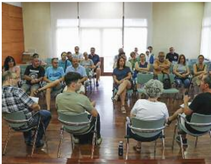
La reunió de dilluns entre el consistori i les entitats.

L'objectiu d'aquesta iniciativa és "enfortir la comunicació entre les entitats i l'Ajuntament i, posteriorment, també amb la ciu-