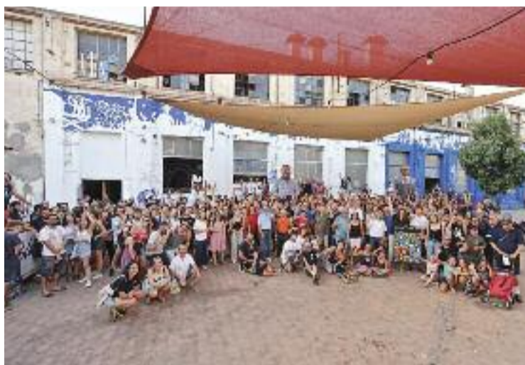
L'acte de presentació fet dimarts.

En la presentació del programa també s'avançaven els