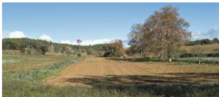
Imatge d'arxiu d'un camp de Gallecs.

Entre les cessions més importants que marca l'acord destaca la de les masies Can Xalet i Can Banús, algunes buides, on el Consorci "facilitarà la implantació d'activitats compatibles amb els usos de Gallecs". Es dona la situació, però, que en algunes cases hi viu gent de manera irregular i, en aquests casos, l'Incasòl haurà d'oferir "contractes d'arrendament, masoveria urbana o cessions" per regularitzar la situació abans de cedir la gestió al Consorci.