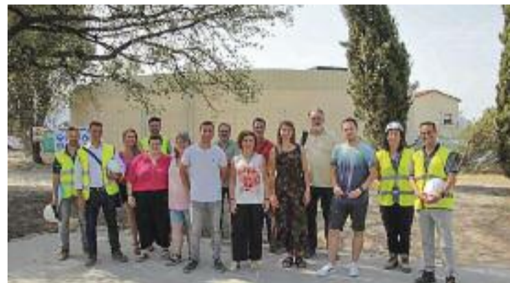
Visita institucional al nou dipòsit de la Florida.

agenda, tràmits, gestió d'espais, videotutorials o fòrum, entre d'altres. "Volem que el portal sigui actiu i participatiu per a les entitats i, a més, que tothom hi pugui accedir fàcilment. Hem de saber què volen les entitats per poder incorporar-ho", va dir Monterrubio.