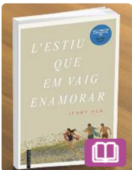
L'estiu que em vaig enamorar Jenny Han

La Belly mesura la vida en estius. Els hiverns només serveixen per comptar les setmanes que falten per arribar al mes de juny i marxar a la casa de la platja amb la Susannah, la millor amiga de la mare, i els seus fills, en Jeremiah i en Conrad. En Jeremiah és com un germà. En Conrad és el seu amor de sempre. Un amor impossible. Però aquest estiu no és com els altres.