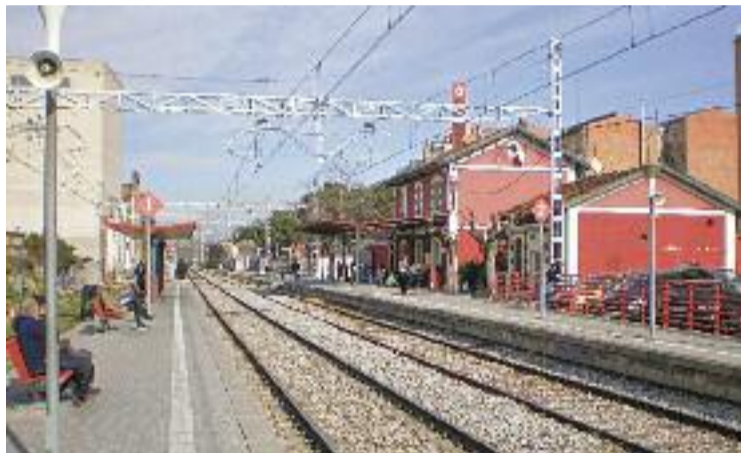
Imatge d'arxiu de l'estació de Mollet Santa Rosa.

El desdoblament d'aquests 10 quilòmetres forma part del projecte global de duplicar tota la línia entre Montcada i Vic, "on ja hi ha treballs a diferents trams", apunten des del ministeri en un