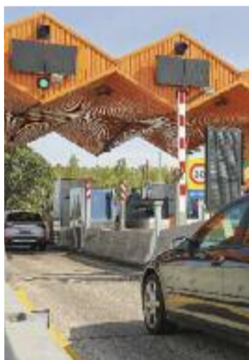
Un peatge.

CANOVELLES ▶ Ja s'ha signat l'acta d'inici de les obres d'urbanització del sector de Ca la Piuja, on anteriorment s'havien ubicat els barracons de l'escola Els Quatre Vents. El projecte preveu la construcció d'un carrer nou en forma d'U i de diversos habitatges, que estaran envoltats d'una nova àrea verda. Abans, però, caldrà analitzar què hi ha a sota, ja que és una zona d'interès arqueològic.