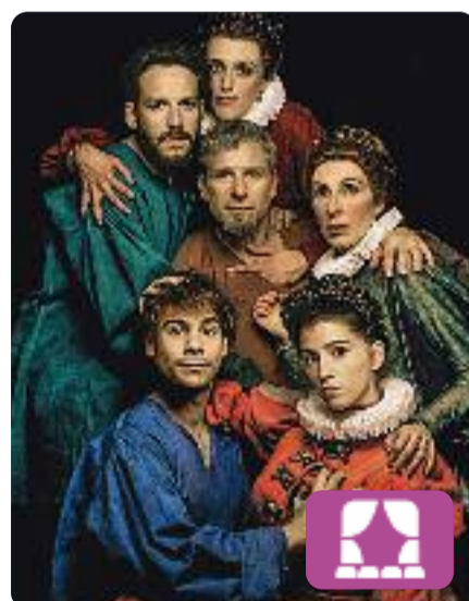
La tendresa Alfredo Sanzol

Una reina una mica maga i les seves dues filles viatgen en l'Armada Invencible, obligades per Felip II a casar-se en matrimonis de conveniència amb nobles anglesos després d'haver envaït Anglaterra. La reina Maragda odia els homes perquè li han robat la llibertat, i no permetrà que les seves filles tinguin el mateix destí.