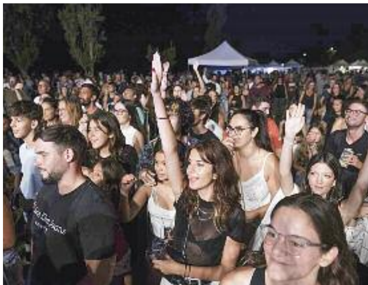
Un moment de la Festa Major de l'any passat.

L'escenari de la seva actuació serà el parc de la Ribera, que a partir de les deu de la nit i fins a les dues de la matinada es convertirà en tota una festa. A més de Ladilla Rusa, també hi actuaran els DJ Adrià Soler i Uri Mora de l'emissora Els 40 , amb el seu xou Los 40 on Tour . La música anirà acompanyada d'un espectacle audiovisual i acabarà