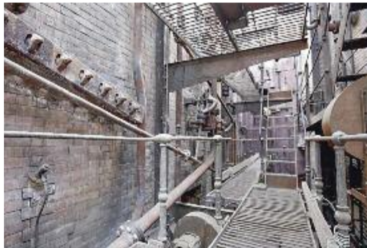
La Tèrmica, per dins.

Juntament amb aquest espai s'han escollit 18 museus i edificis patrimonials catalans per formar part d'aquesta ruta. Entre altres, destaca Can Marfa Gènere de Punt- Museu de Martaró, la Farga Palau de Ripoll o el Museu Nacional de la Ciència i la Tècnica de Catalunya.