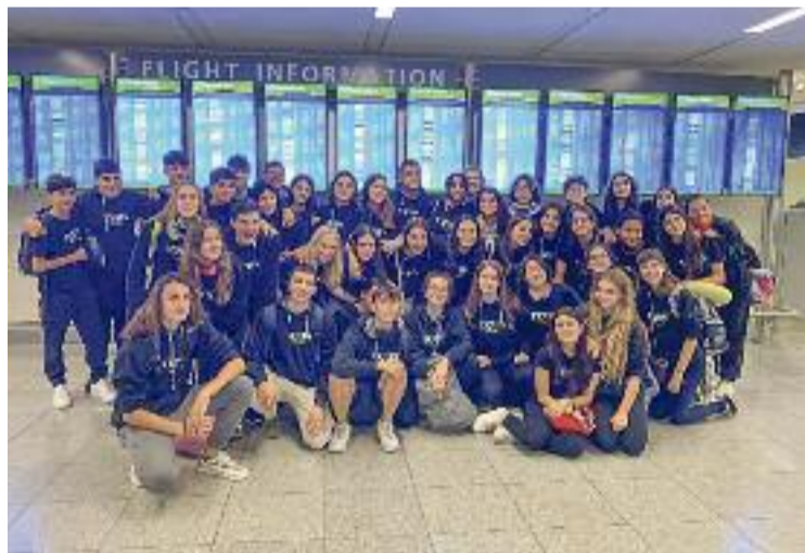
Cor Infantil Veus, en la seva arribada als Estats Units.