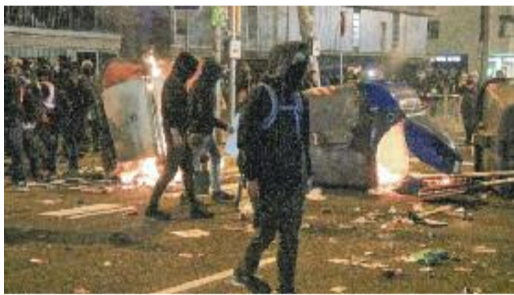
Imatge d'arxiu dels aldarulls emmarcats en l'1-O.

JUSTÍCIA ▶ L'Audiència de Barcelona ha condemnat tres joves de Granollers a tres anys de presó per llançar pedres a una furgoneta dels Mossos d'Esquadra durant les protestes de l'1 d'octubre del 2020, en el marc del tercer aniversari de l'1-O. A més, la sentència, avançada per l'agència Efe , detalla que un dels condemnats haurà de complir mig any més de pena i pagar 76.600 euros per lesionar un dels agents, que hauria caigut a terra i s'hauria trencat el peroné durant la detenció.