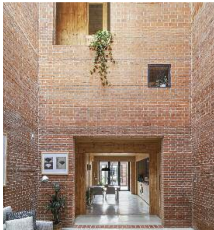
A l'esquerra, imatge de la casa per fora i, a la dreta, per dins. Foto: Adrià Goula/Harquitectes

ser la creació d'una "llista de desitjos" on el propietari va plasmar com volia que fos la casa. "El client, però, estava obert i això ens va permetre sorprendre'l", detalla