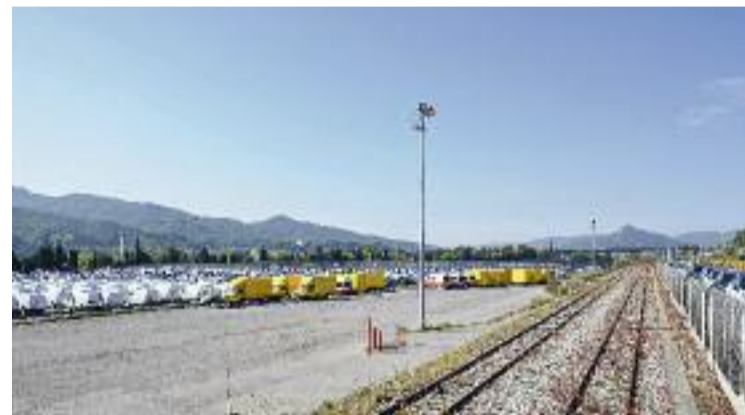
La futura estació intermodal tindrà 105.000 metres quadrats.

precisament, durant la Festa Major d'Estiu de l'any passat. En aquella ocasió es va programar el Festival de Ràdio Flaixbac, que va ser tot un èxit. El consistori espera repetir aquella implicació per part del jovent amb l'espectacle de Los 40 on Tour .