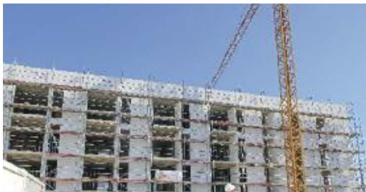
A Montmeló i Montornès hi haurà 54 habitatges.

Així mateix, l'Estat ha detallat que seran edificis energèticament eficients i que comptaran amb un pressupost de 110,6 milions d'euros, dels quals el govern espanyol n'aportarà 21,4. Aquests habitatges se sumen,