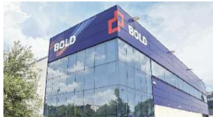
Bold espera facturar 100 milions anuals abans de 2030.

més, encapçalats per Terrassa (Vallès Occidental), amb 277; Blanes (la Selva), amb 80; i Sant Boi de Llobregat (Baix Llobregat), amb 40. També n'hi haurà a Santa Coloma de Gramenet (38), Vilafranca del Penedès (36), el Masnou (36), Olesa de Montserrat (33), Montcada i Reixac (32), Lloret de Mar (30), Tortosa (28), Rubí (24), Igualada (24) i Barcelona (16).