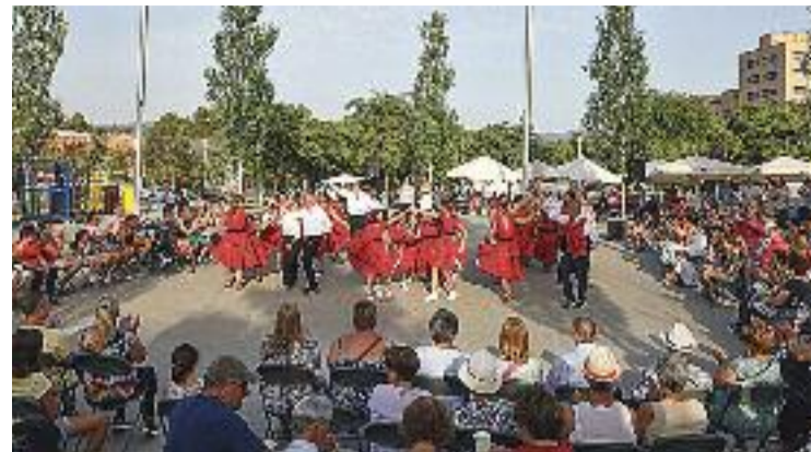
Moment de la ballada.

D'altra banda, pel que fa als seus pròxims projectes, avança que ja està treballant en altres llibres. "En tinc dos de començats, però el pròxim que publicui m'agradaria que fos relacionat amb l'Alzheimer, una malaltia que va patir el meu pare", conclou.