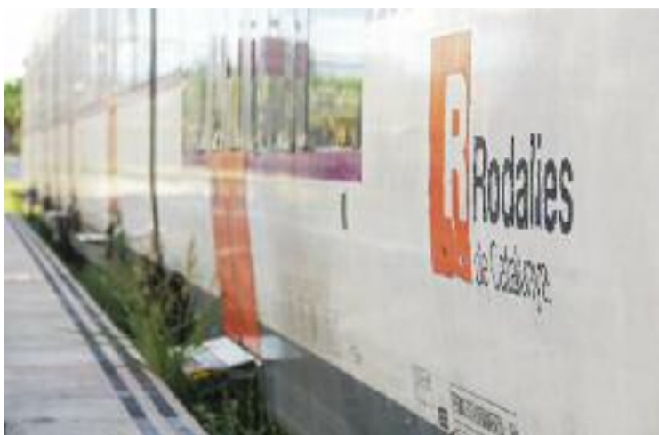
S'estudia la connexió de l'R4 i l'R12 amb l'R7 i l'R8.

El temps de redacció d'aquest estudi és de dos anys i mig i costarà gairebé 910.000 euros. El document buscarà totes les solucions possibles per entrellaçar la xarxa ferroviària actual i crear una nova connexió de Rodalies, i proposarà la millor de les solucions per a ser executada. L'actuació està emmarcada dins del Pla de Rodalies de Catalunya 2020-2030 i també respon als objectius de l'Estratègia de Mobilitat Soste-