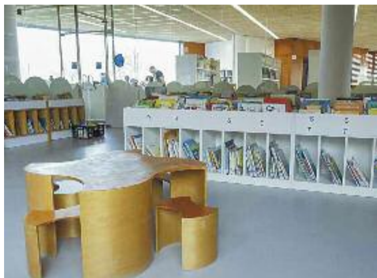
La biblioteca renovada.

La directora de la biblioteca municipal, Míriam Gásquez, admet que l'espera per poder comptar de nou amb aquest equipament "ha estat llarga", i