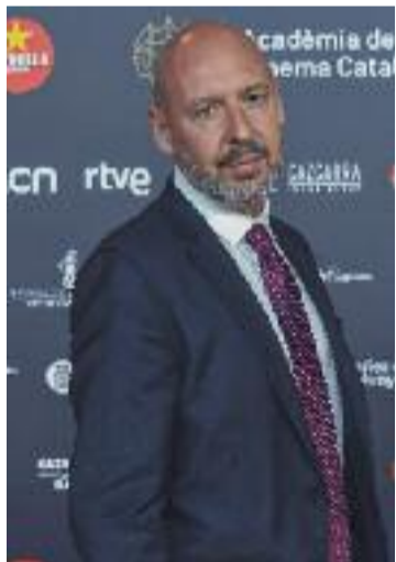
Balagueró.

Aquest thriller, protagonitzat per Ester Expósito, explica com el robatori que comet una ballarina en una discoteca la porta a ser perseguida per un grup de mafiosos i a amagar-se en un edifici maleït. Una història que Balagueró exposava i detallava en el col·loqui posterior a la projecció del film, on també interactuava amb el públic.