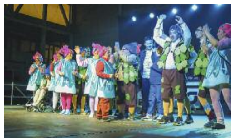
L'entrega de premis del concurs, a la festa de Carnaval.

L'entrega de premis del concurs de disfresses va tenir lloc al Pavelló del Complex Esportiu Municipal El Turó, en el marc de la festa de Carnestoltes organitzada per l'Ajuntament. La celebració va continuar amb una festa al mateix escenari que es va allargar fins a la matinada.