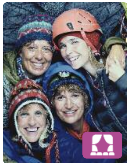
Fitzroy Jordi Galceran i Sergi Belbel

Quatre escaladores estan a mitja ascensió del Fitzroy, una de les vies d'escalada més complicades del món i mai assolida per una cordada femenina. El mal temps les ha fet aturar i, mentre esperen que les condicions millorin, sorgeixen problemes inesperats que les fan dubtar de si tirar endavant o rendir-se. Al Teatre Borràs de Barcelona.