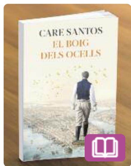
El boig dels ocells Care Santos