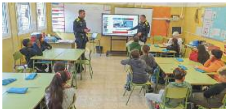
Moment d'una de les sessions que imparteix la Policia Local.

En aquest sentit, d'una banda, s'està tirant endavant el programa Internet Segura amb alumnes de 5è, on es tracten temes com l'ús responsable de les tecnologies, l'assetjament digital, les estafes digitals i la ciberseguretat, entre d'altres. "Amb la proliferació de