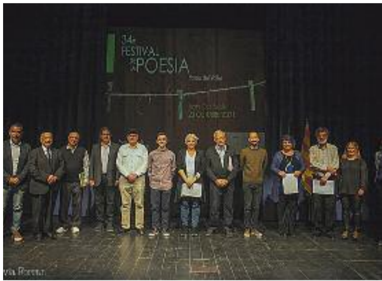
Imatge d'arxiu del Festival de Poesia.

Al llarg d'aquest temps, Niu d'Art no només ha impulsat recitals poètics, sinó que també organitza anualment el Festival de Poesia Niu d'Art, que ha comptat amb poetes convidats com Olga Xirinacs o Joan Margarit, i un concurs de poesia es-