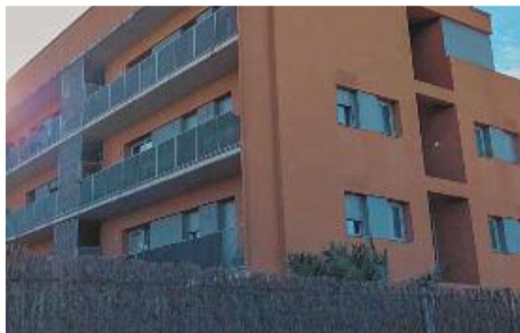
Habitatges afectats per les pujades de l'energia.

Per altra banda, a la reunió del dia 17 també es va tractar la situació dels habitatges i del manteniment, perquè l'Agència Catalana de l'Habitatge tingui tota la informació necessària per actuar en conseqüència.