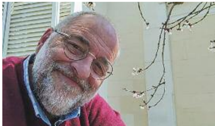
L'artista Pere Salinas va morir a l'edat de 65 anys.

A més, a principis dels anys vuitanta va fundar a Montornès la mostra Mont-Art i va deixar algunes de les seves obres al municipi. Avui dia, a l'Ajuntament, per exemple, hi ha la seva pintura La sábana .