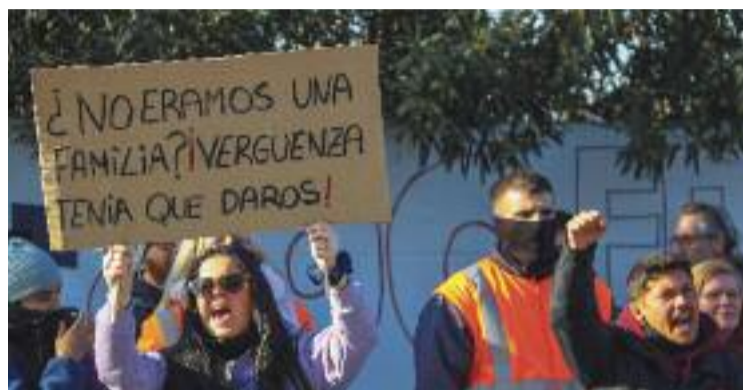
Protestes davant del centre d'Amazon al poble.

El preacord arriba en el tram final de les negociacions entre les parts per resoldre la situació de la planta de Martorelles, després que el passat mes de gener es fes efectiva la decisió de la firma de traslladar l'activitat a altres centres, una decisió que la plantilla sempre ha qualificat de tancament encobert.