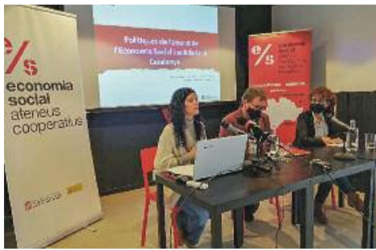
Imatge d'arxiu d'una xerrada de l'Ateneu.