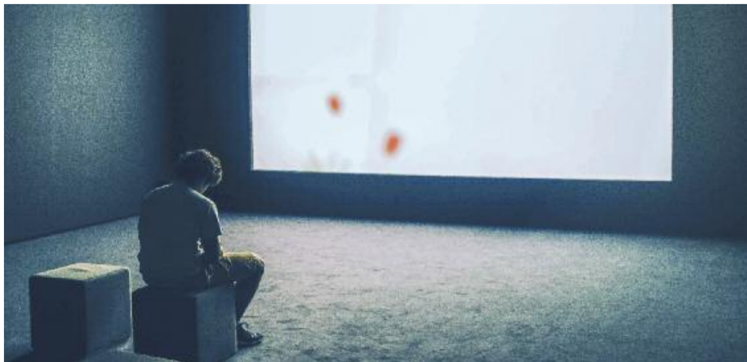
Un 1,5% dels joves espanyols d'entre 12 i 17 anys té addicció a Internet.

En tots els casos de dependència i d'ús excessiu de les pantalles, in-