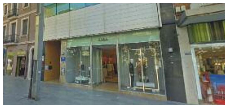
Imatge de l'antic Zara.

COMERÇ ▶ Ja fa més d'un any que el local que durant gairebé 24 anys havia ocupat Zara, al carrer Anselm Clavé, està tancat. Però ara un nou llogater s'ha interessat per l'espai. En concret, la marca Druni, una cadena de perfums, cosmètica i productes de bellesa nascuda a València fa 35 anys, que ocuparà el soterrani, la planta baixa i la primera planta de l'edifici.